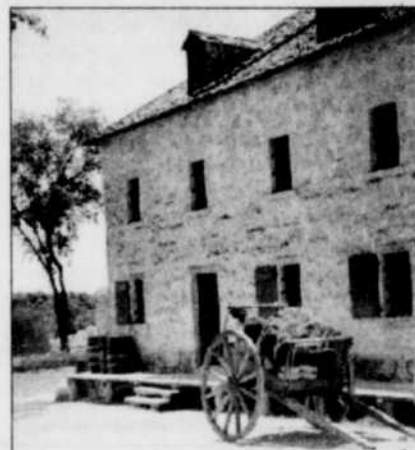
Lower Fort Garry, le poste de traite de la Compagnie de la baie d'Hudson sur la rivière Rouge.

poursuivra jusqu'au 20 octobre. À compter du 1 er décembre 1998, les réservations pourront se faire par téléphone (1-888-780-7328). Pour de plus amples renseignements, veuillez téléphoner au (204) 985-1999 ou consulter le site Web ( www.panamgames.org ).