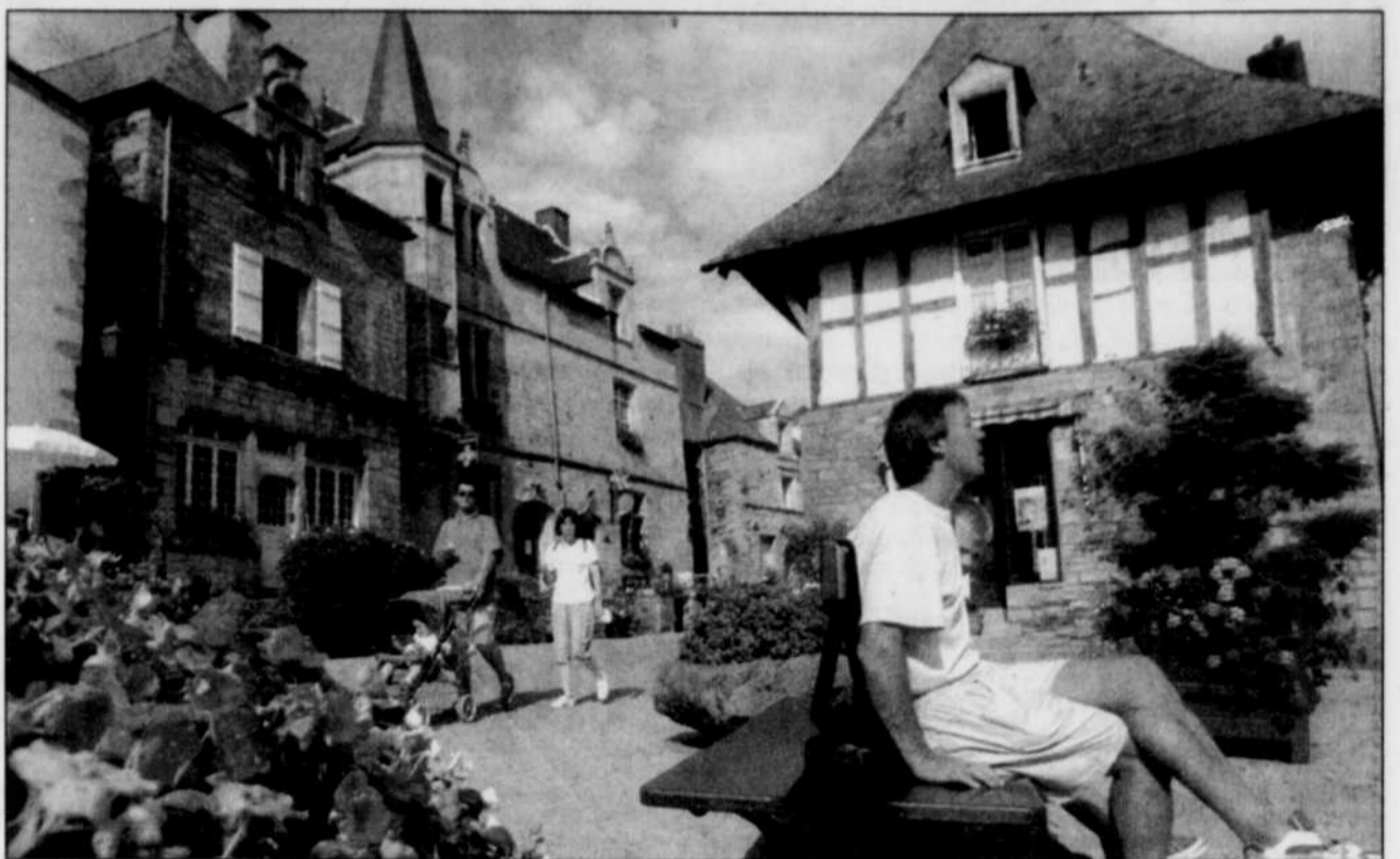
Rochefort-en-Terre, petit village du Morbihan faisant partie des «Petites cités de caractère», est l'un des plus visités de l'Europe.