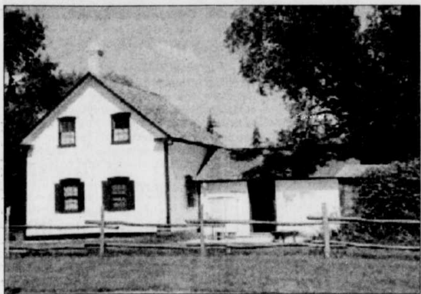
La maison de la mère de Louis Riel, où ce dernier fut exposé.