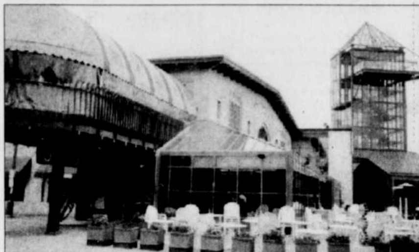
La « Fourche », le cœur de Winnipeg.

Deuxième manifestation sportive en importance après les Jeux olympiques, les Jeux panaméricains constituent également un événement culturel. Ainsi, à la quarantaine de disciplines sportives (athlétisme, tir à l'arc, natation, base-ball, basket-ball, boxe, canoë/kayak, cyclisme, équitation, escrime, hockey sur gazon, gymnastique, judo, karaté, taekwondo, patinage à roulettes, racquetball, aviron, voile, tir, soccer, tennis de table, handball, volley-ball, water-polo, ski nautique, haltérophilie, lutte, etc.) s'ajoutent toutes sortes d'activités culturelles qui se concentrent à la « Fourche », lieu de rendez-vous par excellence des artisans, des amuseurs publics et de toutes les célébrations. L'été 1999 sera donc bien rempli à Winnipeg et la ville s'y prépare fébrilement à en juger par les nombreux travaux de réaménagement actuellement en cours et les milliers de bénévoles déjà recrutés pour prêter main forte au comité organisateur.