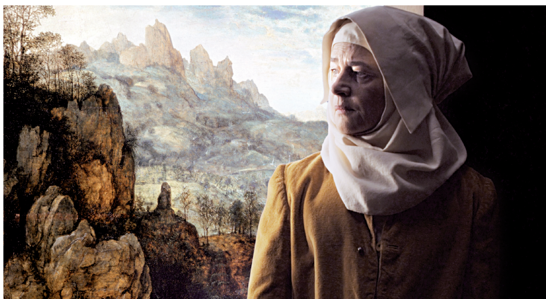
Charlotte Rampling interprète le rôle de la Vierge Marie dans le film Le moulin et la croix .

Mais la vraie force du FIFA est ailleurs. Chaque film ouvre au spectateur des horizons en lui donnant l'envie de mieux connaître le peintre,