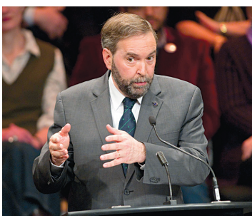
BEN NELMS REUTERS