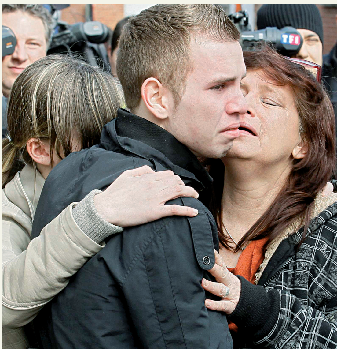
YVES HERMAN REUTERS

Journée de deuil national en Belgique après une tragédie «sans précédent». Plusieurs personnes ont rendu hommage hier, sur le parvis de la Sint Lambertus school, située à Heverlee, aux 22 enfants et aux six adultes qui ont perdu la vie la veille dans un accident d'autocar en Suisse. Page A 3