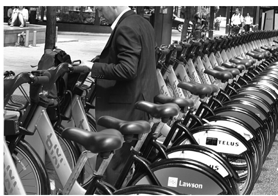
JACQUES NADEAU LE DEVOIR

Tôt ou tard, Montréal devra freiner ses ambitions puisque le gouvernement du Québec a exigé que la Ville et la SVLS se départent du volet international de Bixi, la Loi sur les cités et villes interdisant aux municipalités de se livrer à des activités commerciales. Hier, le maire Tremblay ne semblait pas pressé de se conformer à la demande de Québec. «Notre priorité, c'est de continuer à créer de la valeur pour Bixi. Quant aux autres enjeux, on