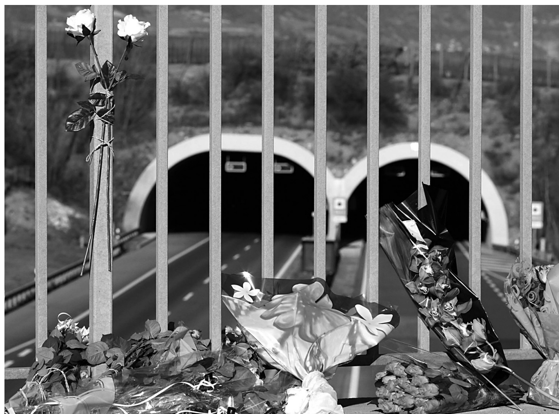
Des fleurs ont été déposées hier près du lieu du tragique accident.