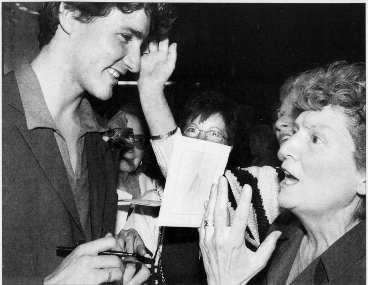
Quelque 600 personnes ont assisté au dévoilement du timbre commémoratif, mais aucun n'a été aussi populaire que l'ainé des fils Trudeau, Justin.