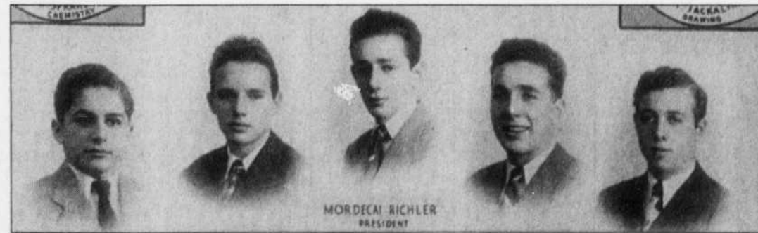
Étudiant au Baron Byng High Scholl, Mordecai Richler, au centre, était président de classe.