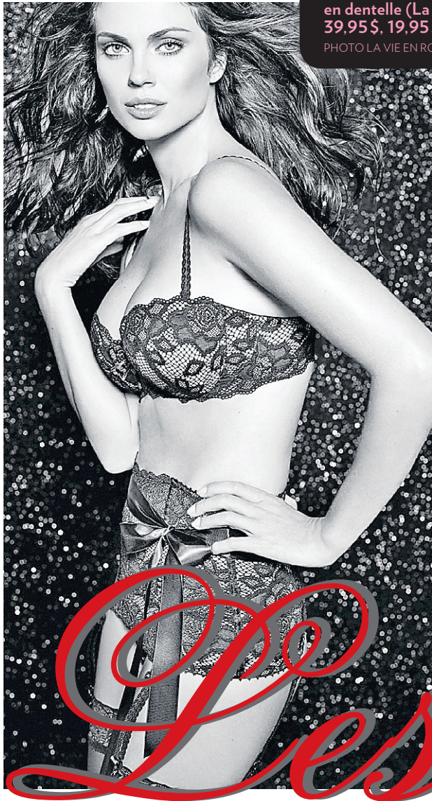
Soutien-gorge, culotte brésilienne et ceinture de taille en dentelle (La Vie en rose, 39,95$, 19,95$ et 35,95$).