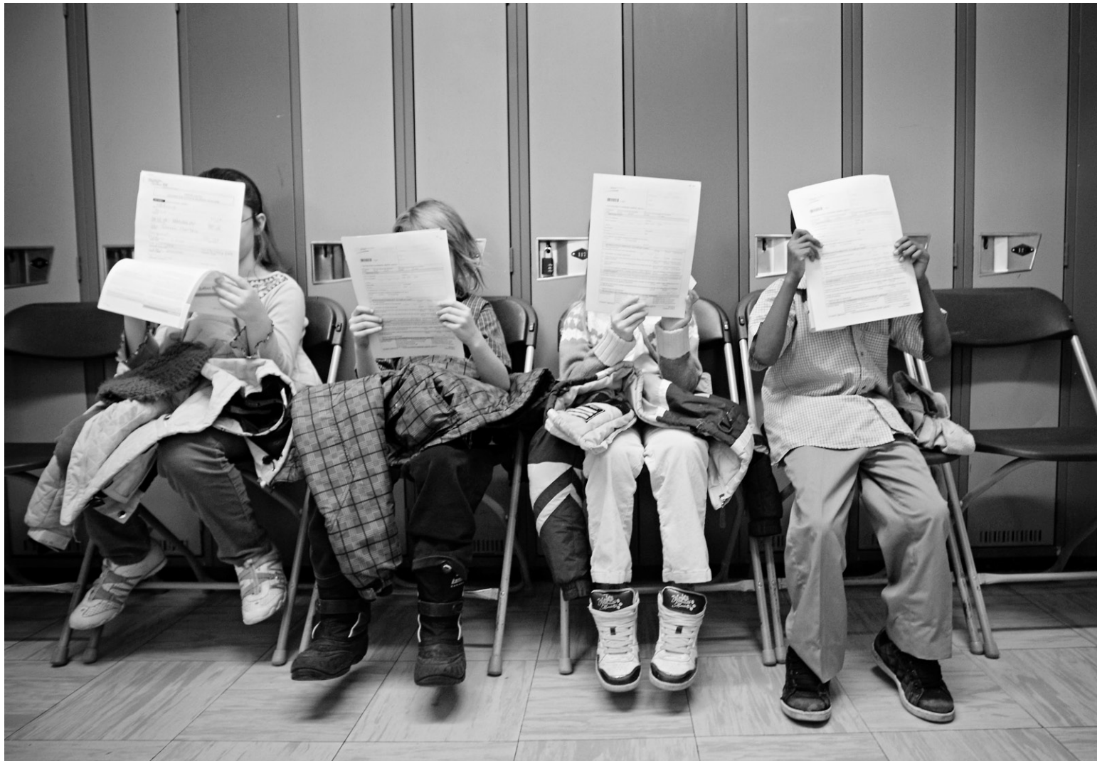
Des élèves du primaire attendaient sagement leur tour à l'école Samuel-de-Champlain hier dans le cadre de l'opération de vaccination pour les jeunes de 5 à 19 ans.

D'abord, une mise au point. Un coach ne vous donnera jamais de réponse, de truc ou de recette toute faite. On ne fait pas ici dans la psycho pop. Au contraire. Le travail du coach est plutôt le suivant: «Je pose des questions et je guide vers des réponses. Je ne donne pas de conseils. Les gens savent déjà quoi faire. Mais ils ne prennent pas le temps de réfléchir», dit-elle. En gros, son travail consiste à poser des questions, entendre les réponses, et encourager ses