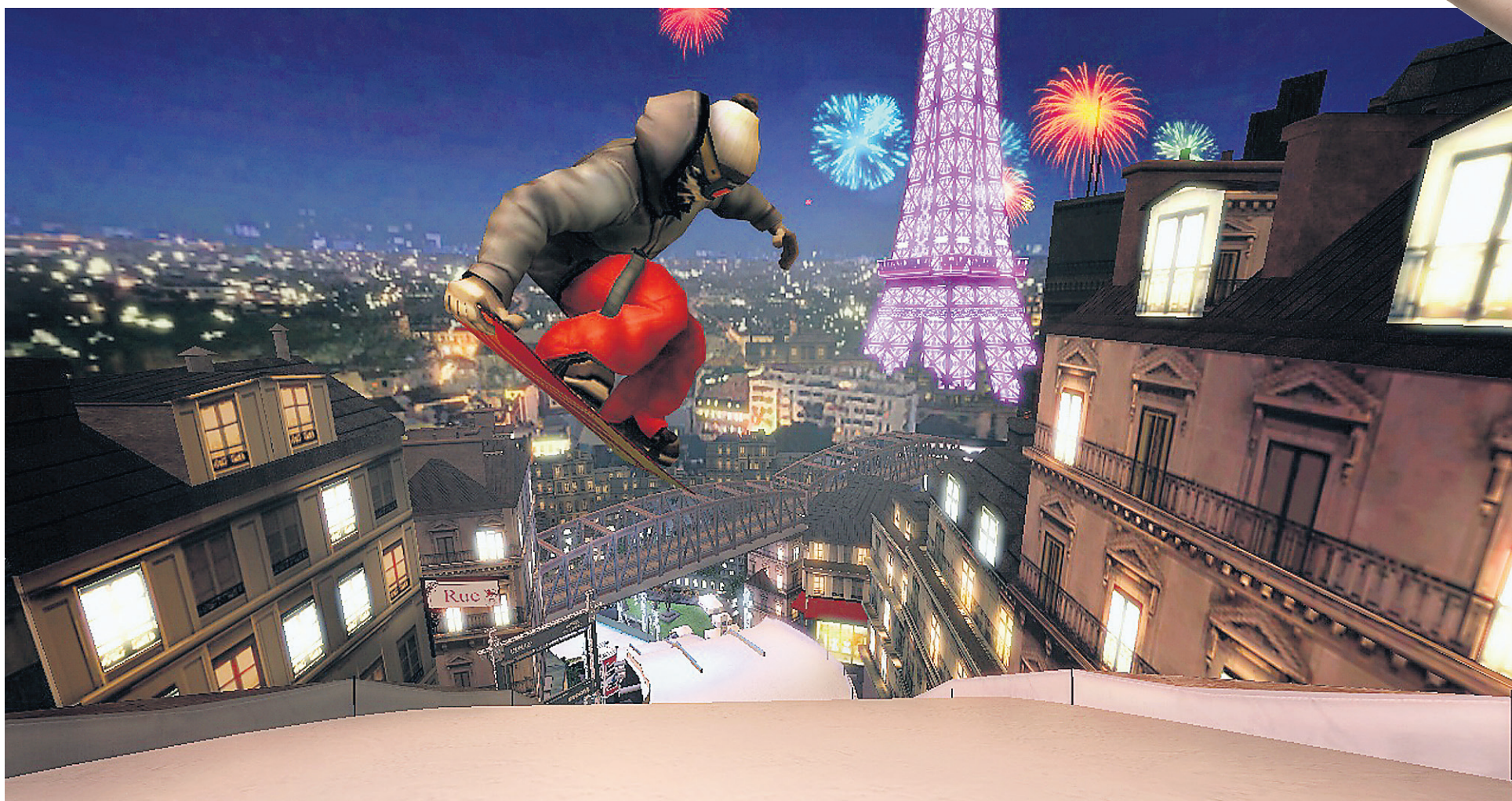
Shaun White Snowboarding: World Stage