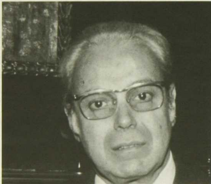
Son Excellence Javier Perez de Cuellar