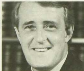
Le Premier ministre du Canada, Brian Mulroney

À cette occasion, la télévision de Radio-Canada retransmettra le vendredi 8 mars à 20h00 , en direct du Château Frontenac à Québec, le discours de Son Excellence Javier Perez de Cuellar, secrétaire des Nations unies, qui sera présenté par le Premier ministre du Canada, Brian Mulroney, puis remercié par le Premier ministre du Québec, René Lévesque.