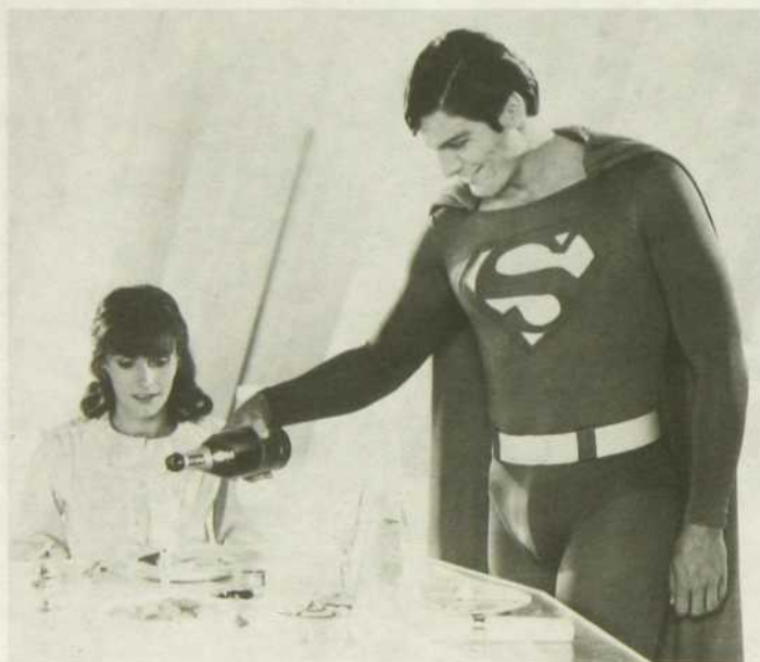
Margot Kidder et Christopher Reeve