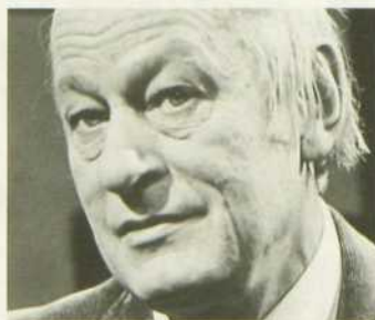
Le Premier ministre du Québec, René Lévesque