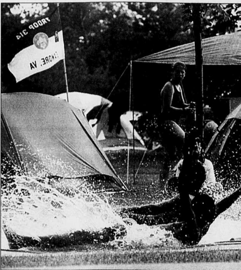
MARTIN CHAMBERLAND LE DEVOIR

Ils tiendront des Jeux olympiques mercredi, organiseront une foule d'activités sportives et culturelles tout au long de la semaine, mais les milliers de scouts qui campent au parc Maisonneuve cherchaient surtout hier un peu d'eau pour se rafraîchir.