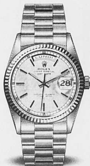
OYSTER PERPETUAL DAY-DATE

Si vous avez choisi le modèle Day-Date, le plus prestigieux de la collection Oyster, n'oubliez pas de choisir la langue dans laquelle vous aimeriez lire les jours de la semaine. Vous pouvez choisir parmi 26 langues, toutes disponibles.