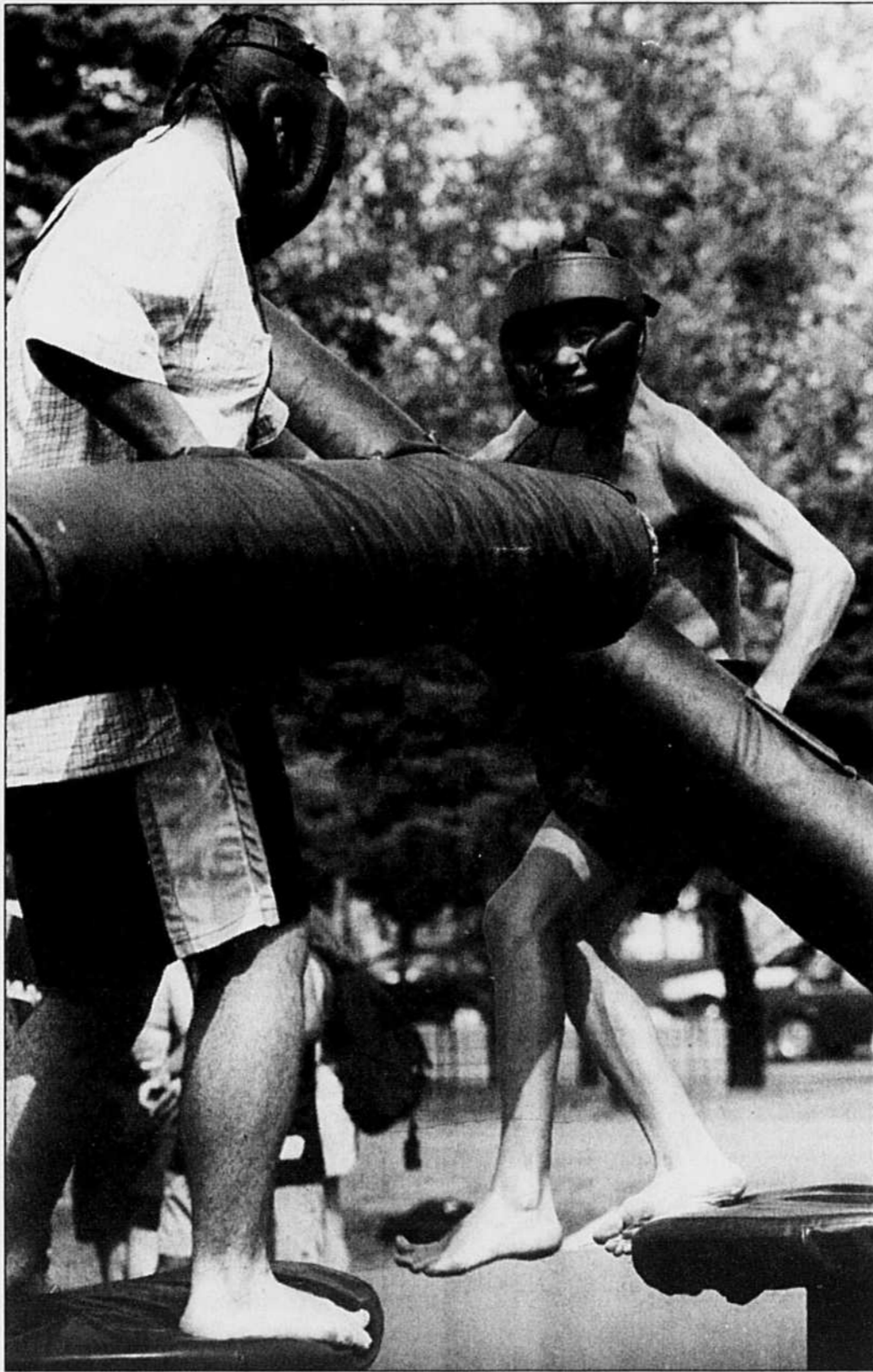
MARTIN CHAMBERLAND LE DEVOIR

MALGRÉ la chaleur accablante ils étaient des milliers de jeunes à dormir hier soir sous la tente au parc Maisonneuve à Montréal à l'occasion d'un événement unique: un jamboree, grand festival qui permettra à 5000 scouts de 7 à 20 ans de passer la semaine à Montréal. Nos informations en page A 2.