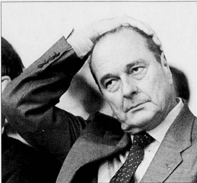
Jacques Chirac, président de la République française.

À ce point, il est intéressant d'analyser les critiques qu'utilisent les tenants de gauche pour s'opposer à l'éventuelle formation d'une droite incluant le FN. Chaque fois qu'une alliance, même tactique, est évoquée, on en appelle aux principes démocratiques devant supposément mener les