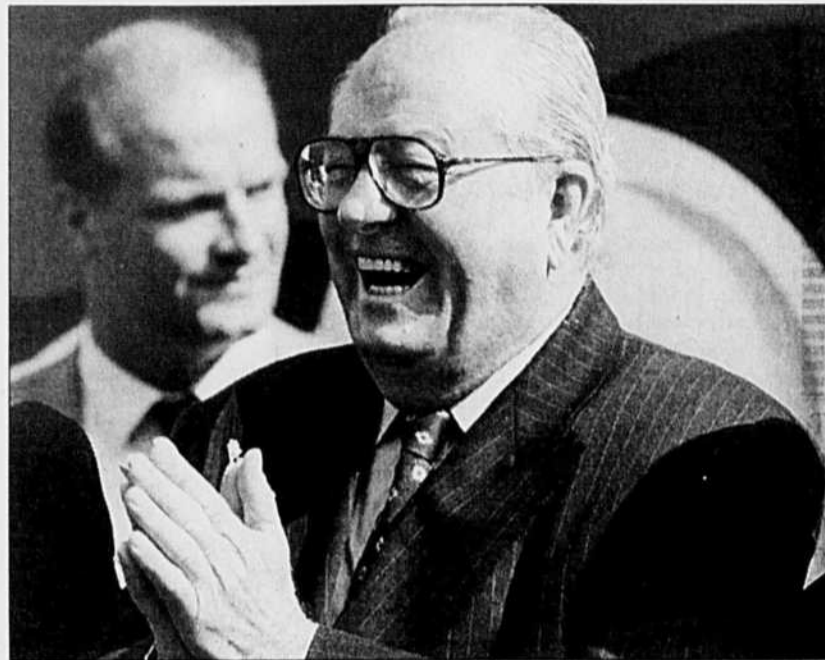
Jean-Marie Le Pen, président du Front National.

D'un point de vue moins historique, on peut encore regarder objectivement la possibilité d'une alliance FN-droite classique. Comme nous l'affirmons plus haut, la gauche actuelle, elle aussi, gouverne avec sa part d'extrémistes et de radicaux. Cependant, mis à part les quelques communistes révolutionnaires des groupuscules