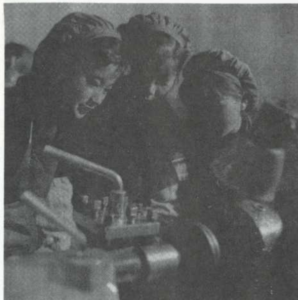
On apprend à manoeuvrer un tour et on COMPREND comment il fonctionne.

"Jusqu'en 1958 dans ce quartier, la plupart des femmes restaient encore à la maison, au service de leur famille, ménage, soins des enfants. C'est alors que le pays tout entier se souleva pour accomplir "le grand bond en avant", c'est-à-dire que toutes les énergies se mobilisèrent pour franchir une nouvelle étape de transformation de la société. Dans les campagnes, les paysans regroupaient les coopératives de forme supérieure pour créer des communes populaires; l'industrie se décentralisait largement, on vit se développer dans les coins les plus reculés des petites unités de production industrielle. Et nous, les femmes, devions-nous rester à la maison, à l'écart de la tempête? Le président Mao nous appela "à compter sur nos propres forces, à nous dégager des tâches ménagères et à participer aux activités productives et sociales". Nous voulions répondre à cet appel, faire nous aussi le grand bond en avant. Mais comment s'y prendre? C'est alors que dans ce quartier une vingtaine de femmes se décidèrent à "franchir" la porte de la famille pour créer une usine de quartier. Le comité de rue nous prêta deux hangars vides à cet effet. A voir les choses sous un certain angle on peut dire que nous avions