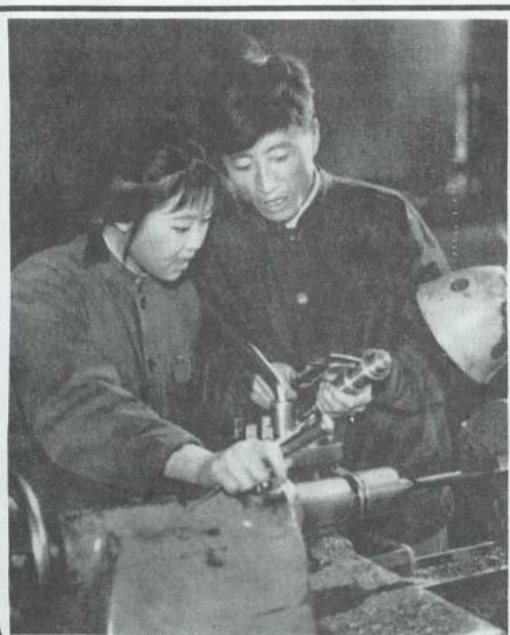
De l'égalité des tâches à l'égalité des salaires

L'article fait remarquer que si justement les hommes ont acquis une supériorité technique dans ces travaux, cela vient uniquement du fait qu'ils en ont une longue pratique, tandis que les femmes, elles, étaient confinées, dans l'ancienne société, dans les tâches domestiques, les travaux agricoles leur étant le plus souvent interdit.