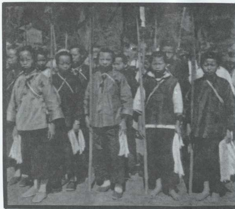
Un détachement féminin de l'Armée Rouge, pendant la guerre de Libération.