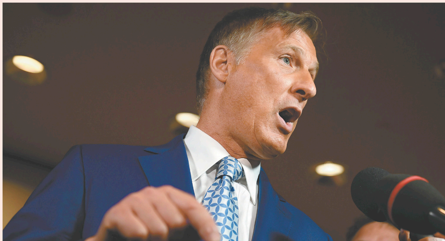
Maxime Bernier s'adressant aux journalistes en marge du congrès de son parti, en août dernier.