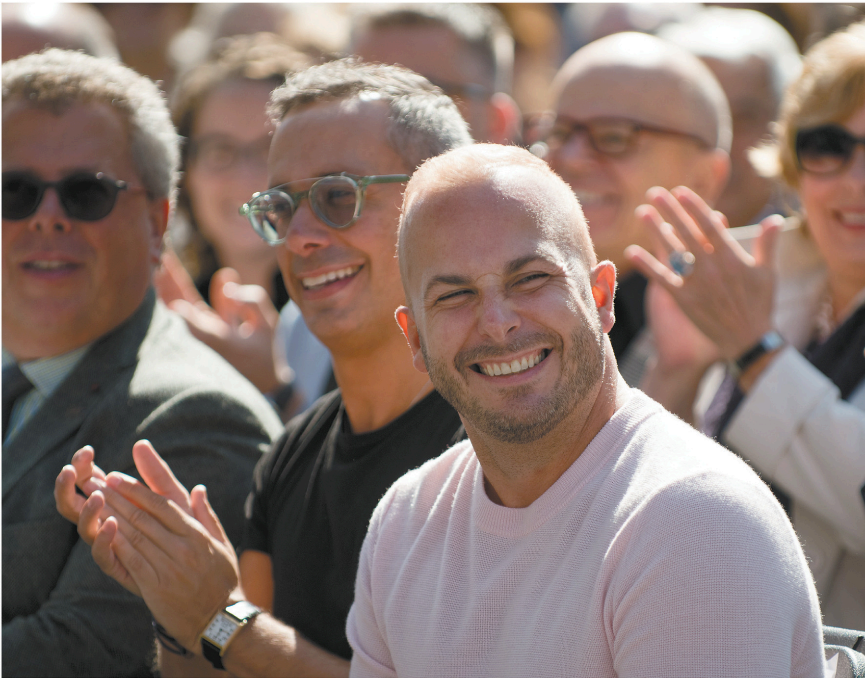
Le chef Yannick Nézet-Séguin et l'Orchestre Métropolitain ont annoncé lundi une union toute particulière.