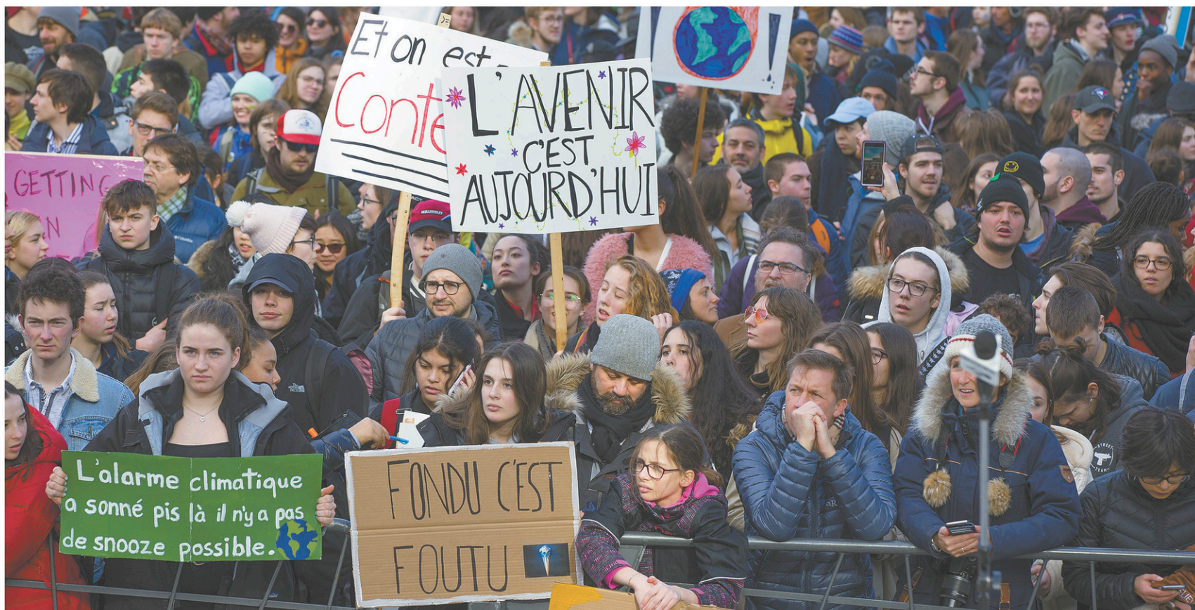
Des milliers de manifestants, étudiants et travailleurs, devraient se réunir à Montréal pour la manifestation du 27 septembre.

Pour réduire les risques liés aux déversements illégaux, M e Bishop recommande à la Ville d'envisager de créer et d'opérer elle-même des sites d'entreposage temporaire pour les sols faiblement contaminés. Elle suggère aussi à la Ville d'élaborer une stratégie d'approvisionnement afin de conclure des ententes-cadres avec des sites d'élimination.