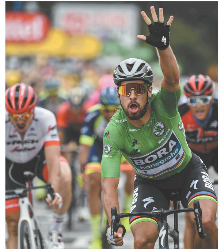
Peter Sagan a moins souffert en montagne que ses adversaires.