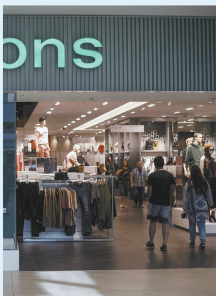
Des clients entrent dans une succursale du détaillant à Edmonton, en 2017.