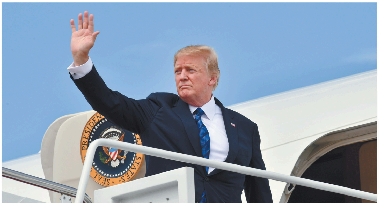
Le président américain est monté à bord de Air Force One, vendredi, sur la base militaire Andrews dans le Mayland, aux États-Unis.