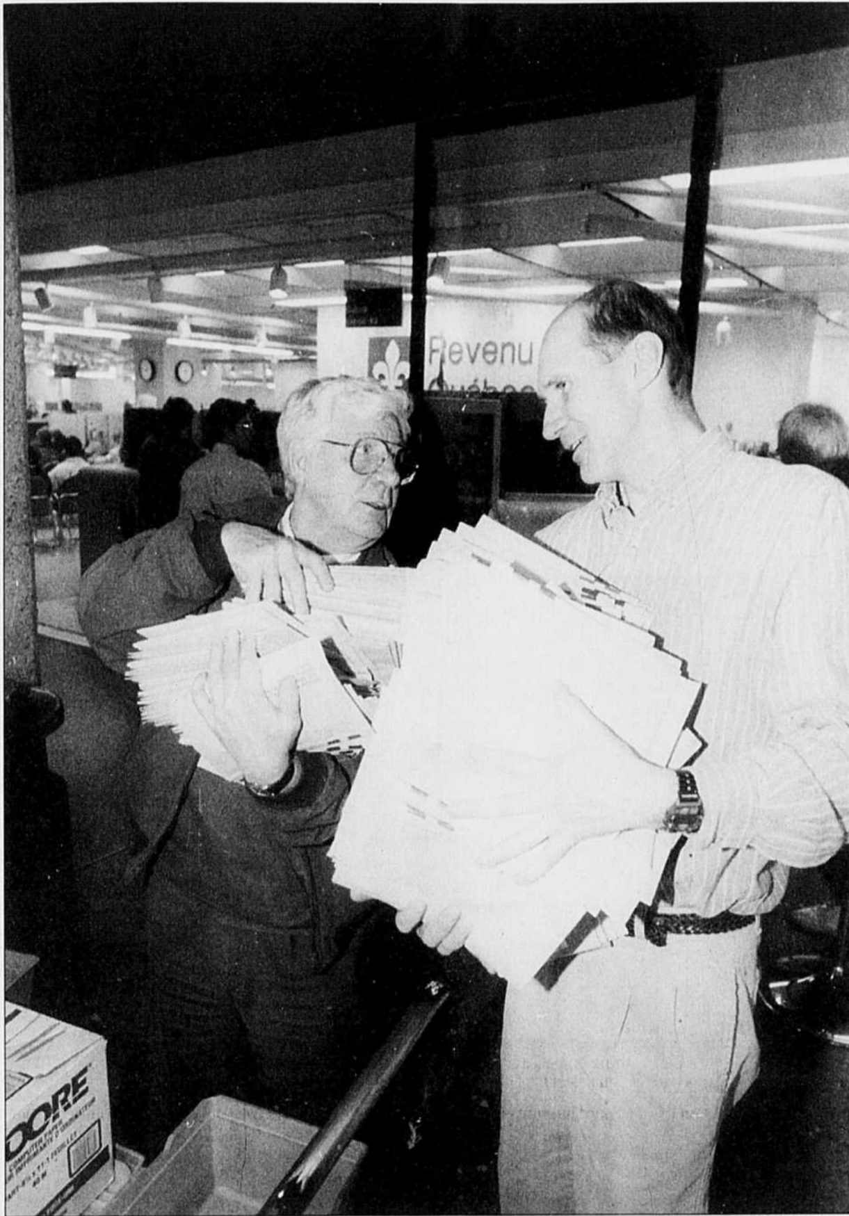
Plusieurs personnes âgées considèrent leurs impôts trop élevés par rapport à leurs revenus.

Je crois qu'il est vraiment temps que nous, de la majorité silencieuse, trouvions le moyen de nous impliquer. Je sais que nous sommes très occupés à tenter de joindre les deux bouts, à donner à César ce qui revient à César... Je souhaite également que nous commençons très tôt à éduquer nos enfants sur les questions de gestion monétaire.