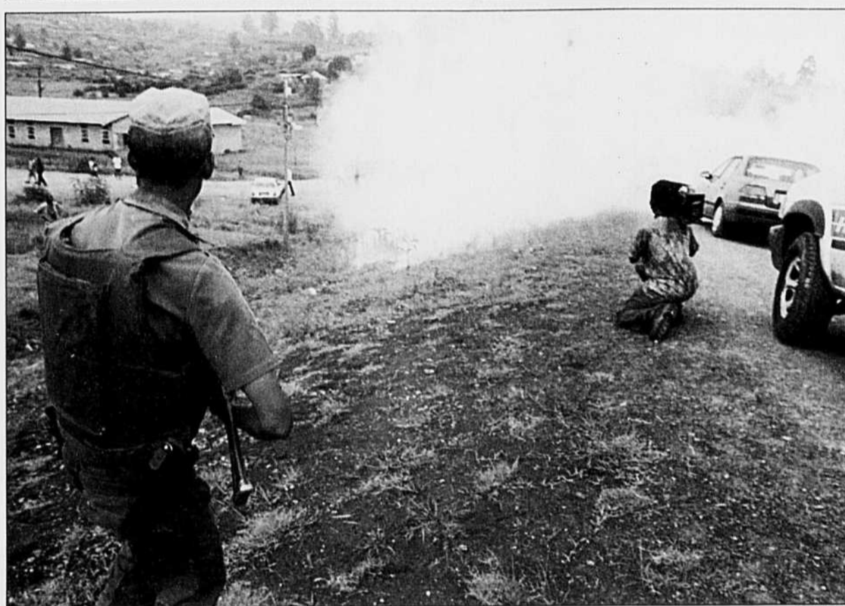
Un policier tire des gaz lacrymogènes pendant une manifestation hier à Mogada. Plusieurs personnes ont été tuées samedi dans cette région d'Afrique du Sud.

M. Sahhaf avait proposé sans succès à ses homologues un projet de déclaration appelant les pays arabes «à lever immédiatement et unilatéralement les sanctions frappant l'Irak».