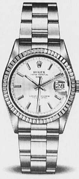
OYSTER PERPETUAL DATE

Nous sommes fiers d'être votre bijoutier agréé Rolex.