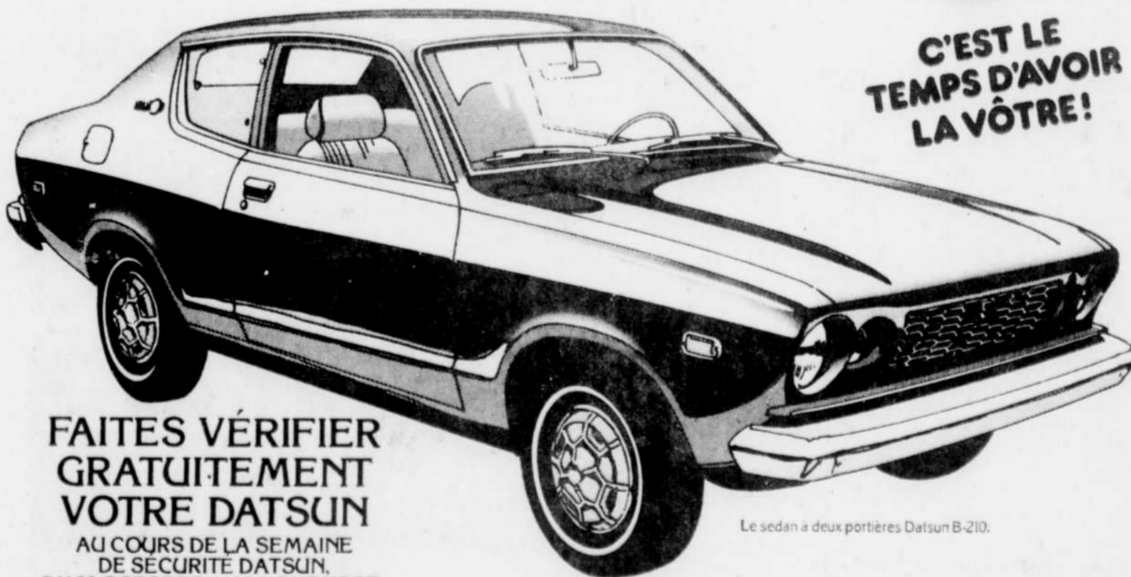
Le sedan à deux portières Datsun B-210.

FAITES VÉRIFIER GRATUITEMENT VOTRE DATSUN