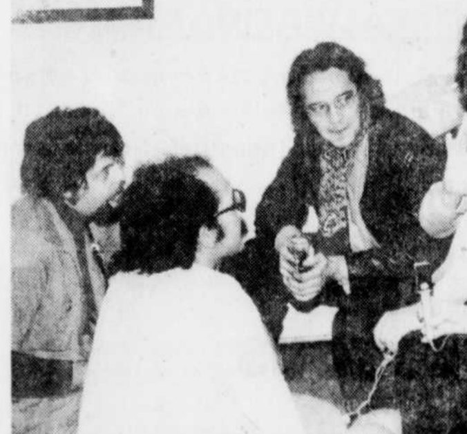
Il y avait foule au Centre Culturel de la rue Ringuet à l'occasion du vernissage des oeuvres d'un exposition intitulée Premier Automne. On pouvait admirer les oeuvres de 6 jeunes artistes de Drummondville réunis dans une sorte de coopérative artistique. En fait, ils sont 7 dans ce groupe, puisqu'on y trouve aussi un "poèteux" comme il s'appelle lui-même. La réaction du public fut dès plus positive et si l'on en croit les premiers commentaires l'exposition vaut la peine d'être vue. On trouve de tout pour tout les goûts, en fait l'exposition est comme les artistes: c'est frais, inattendu, farfelu même. Elle présente côte à côte violence et réalisme ainsi que l'irréel et le fantastique d'un monde "bonbon".

sonnes dont le nom est mentionné l'ont aidé surtout à la dernière étape de la réalisation du projet, soit au stade de l'expérimentation, pour vérifier en dernier ressort la qualité du parcours. Finalement, il a ajouté que tous les éléments intéressants et importants du projet seront décrits en détail, avec tout ce que cela suppose d'impact, lors de la prochaine livraison d'un hebdomadaire local, dont M. Chaput est collaborateur et qui paraîtra mercredi prochain.