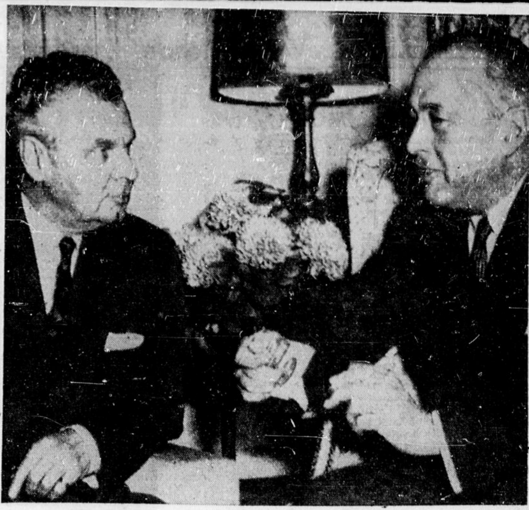
AMICAL ENTRETEN — Le premier ministre du Québec, l'hon. Paul Sauvé, qu'on voit ici à droite, a eu hier après-midi un entretien amical avec le premier ministre du Canada, le très hon. John Diefenbaker, à la résidence de celui-ci, 24 Sussex, Ottawa. Tout porte à croire que la question de la répartition des subventions fédérales entre les universités du Québec a fait l'objet de cet entretien.