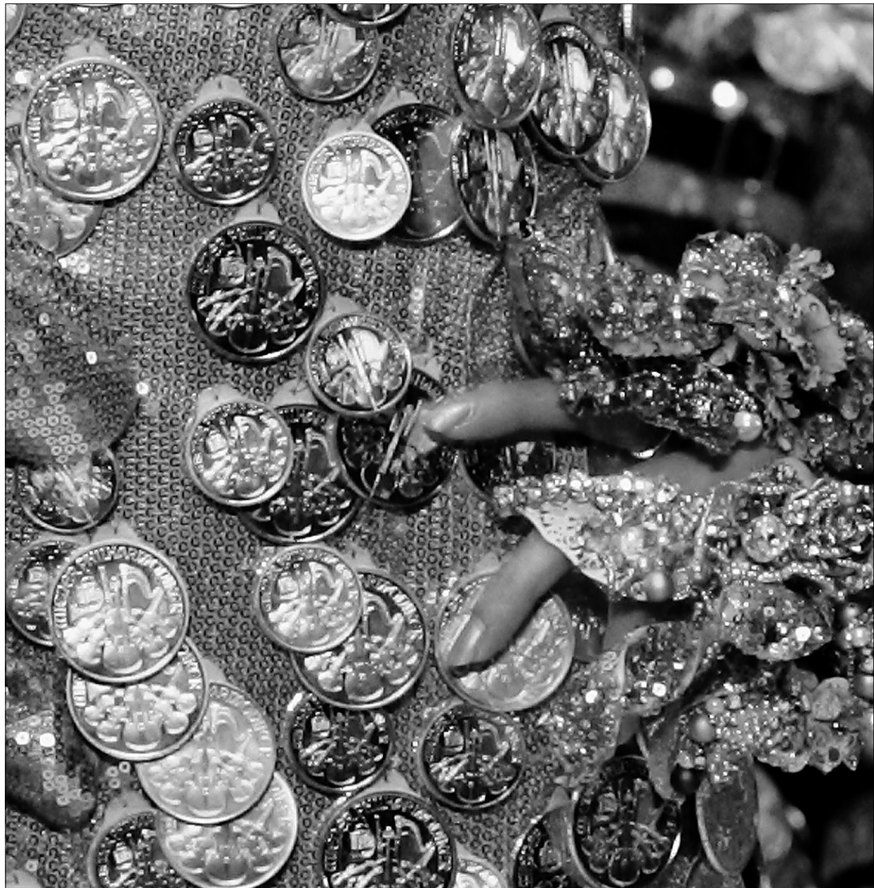
Comme l'once d'or est libellée en dollars, le pouvoir d'achat des investisseurs hors zone dollar s'en trouve accru, ce qui stimule la demande.

L'once de palladium valait 369 $ contre 370 $ vendredi dernier.