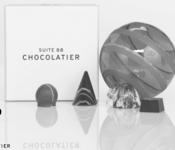
SUITE 88 CHOCOLATIER 3957 RUE SAINT-DENIS WWW.SUITE88.COM 514-844-3488

Venez vivre, rire et apprécier le chocolat.