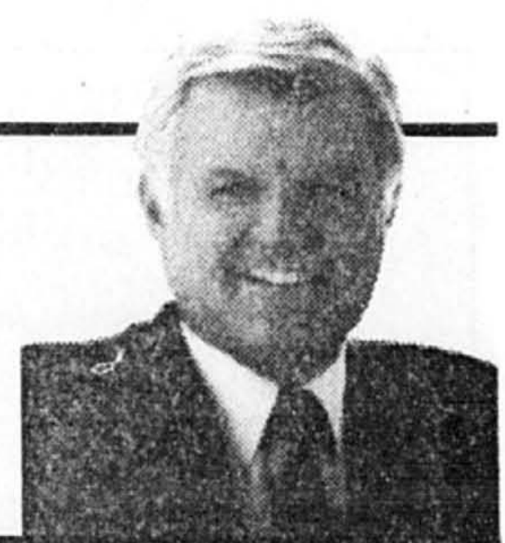
Ted Kennedy Ce soir, 21 h