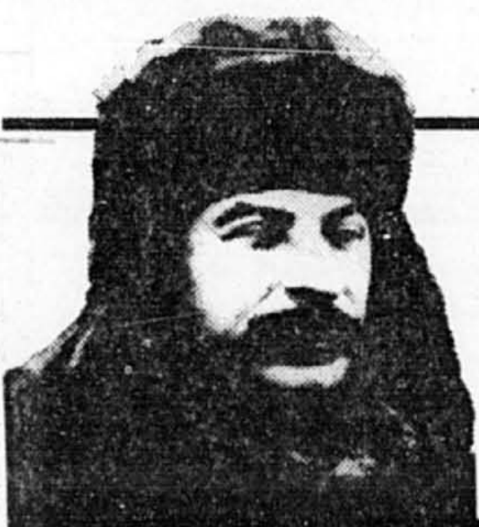
Staline Ce soir, 20 h