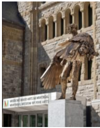
L'Oeil de David Altmejd, exposé au Musée des Beaux-Arts de Montréal