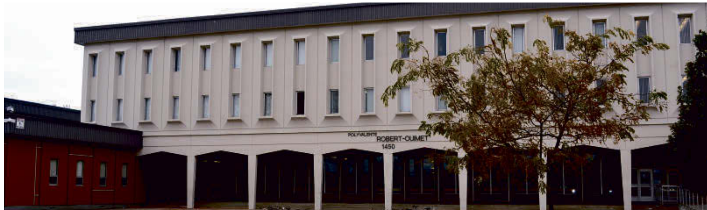
La Polyvalente Robert-Ouimet célébrera son 50 e anniversaire lors d'une journée spéciale qui aura lieu le 25 mai 2019.

« Nous souhaitons marquer les 50 ans de la polyvalente en proposant une journée rassembleuse et conviviale. Le samedi 25 mai en avant-midi, les