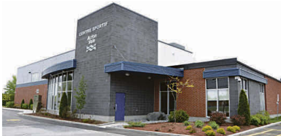
La fête du 50 e anniversaire du Centre sportif d'Acton Vale permettra d'inaugurer le Panthéon des sports d'Acton Vale.

« Plusieurs bénévoles donnent de leur temps afin que les motoneigistes aient du plaisir sur nos sentiers. Je suis très fier de l'implication des Pionniers », confie-t-il.