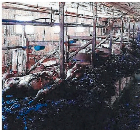
« Une scène d'horreur », peut-on lire dans le rapport vétérinaire. (Photo capture d'écran)