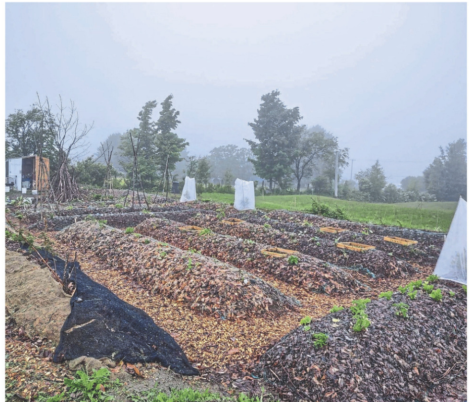
Les buttes autofertilisantes

Avec les buttes, les pluies abondantes n'affectent pas la culture qui se trouve surélevée. Vicky et son groupe ont également prévu des boîtes à chauves-souris, de même que des nichoirs pour les oiseaux de proie. « Parce que l'an passé, on avait beaucoup de petites taupes. On se doit d'inviter nos alliés à venir créer l'écosystème. Pour cela, il leur faut des conditions propices pour que tout se mette en place comme il faut », mentionne-t-elle.