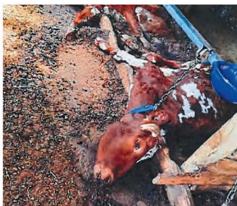
Près d'une cinquantaine de bovins ont été trouvés morts en mai 2022.

L'abandon des animaux, note-t-on, les a condamnés à une longue agonie. Ils ont été soumis à l'anxiété et à des souffrances excessives menant à la mort. « Un cas de cruauté extrême », peut-on lire. Le 27 mai 2022, le propriétaire, dans une déclaration écrite, reconnaissait la mort de 49 bovins laitiers depuis au moins le 3 mai et que les carcasses n'avaient pas été disposées selon les normes applicables.