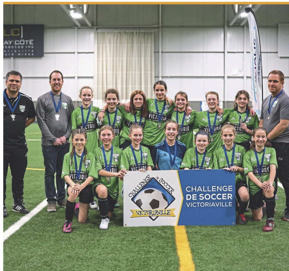
Une équipe de l'Optimum de Victoriaville qui a remporté la finale dans sa catégorie lors de l'édition 2023.