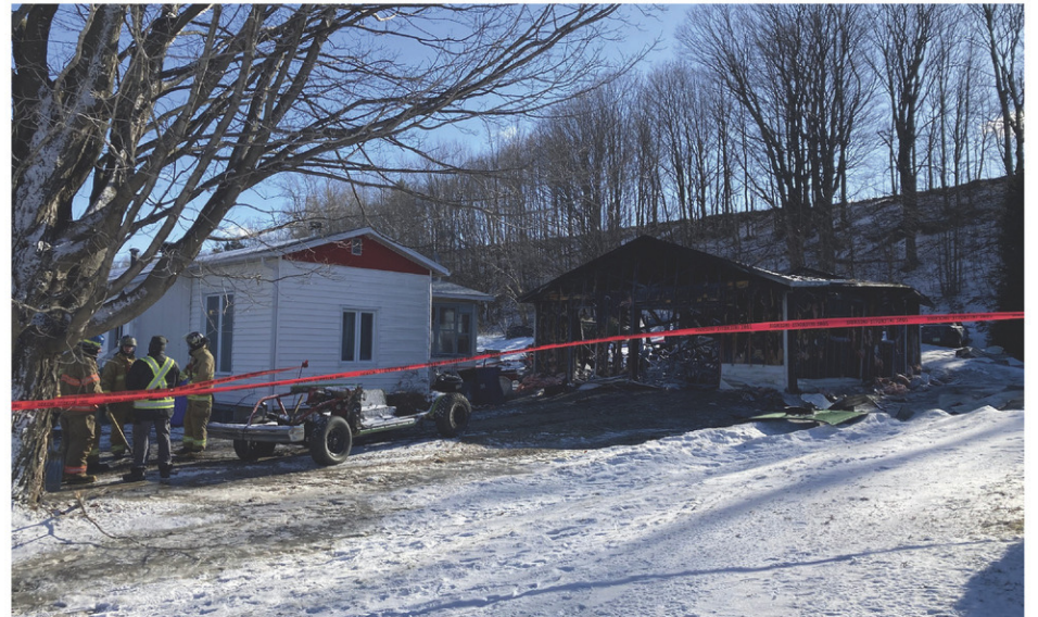
Les pertes sont sommairement évaluées à 75 000 $.