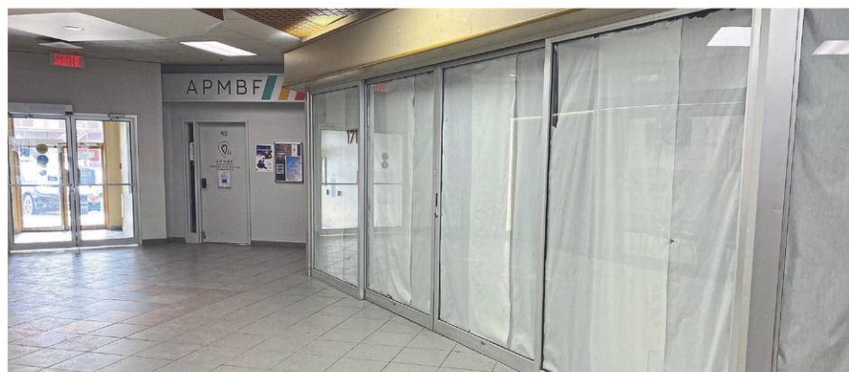
C'est à cet endroit qu'on retrouvera, dès le 22 avril, les services automatisés de Desjardins au centre-ville de Victoriaville.