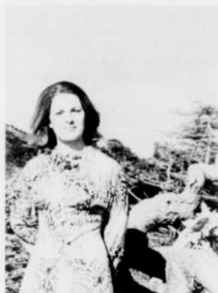
Tournesol vendredi 9, 21 h 30

Sprint est réalisé par Thérèse Patry; l'idée originale de l'émission est de Pierre Duceppe.