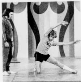
Psst! Psst! Aïe-là! le samedi, 12 h 00