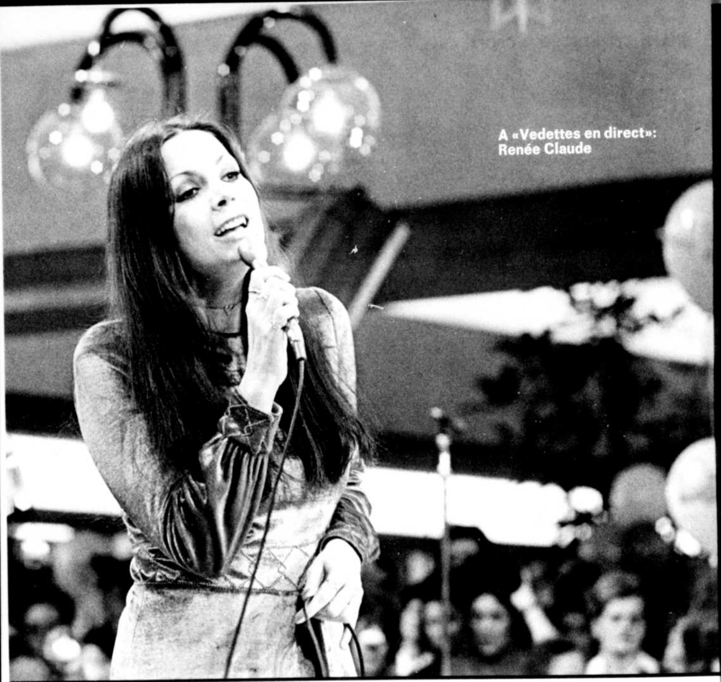
A «Vedettes en direct»: Renée Claude

POUR NOUS ÉCRIRE AU SUJET DE VOTRE ABONNEMENT Changement d'adresse, facturation, réclamation ou réabonnement, adressez votre correspondance à