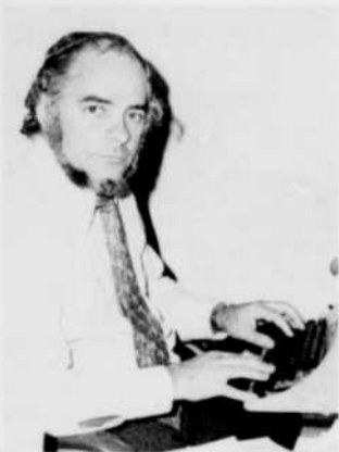
Rencontres dimanche 4, 23 h 30