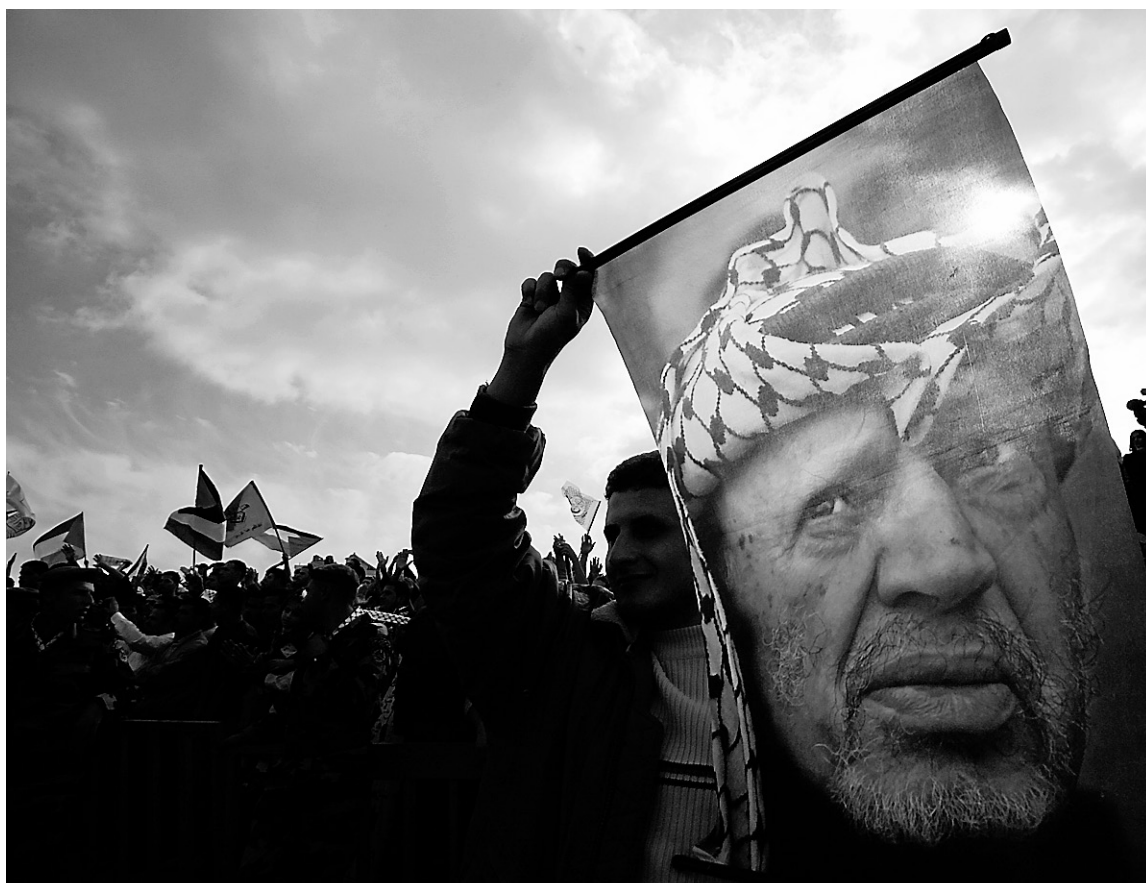
Un Palestinien tient une bannière à l'effigie de Yasser Arafat, le 11 novembre 2007, au troisième anniversaire de la mort de ce dernier. Si la présence de polonium a été confirmée par un laboratoire suisse, il est impossible, pour le moment, de conclure que ce poison est la cause du décès d'Arafat.

Une quantité de polonium grosse comme une tête d'épingle contient 3400 fois la dose mortelle pour l'homme.