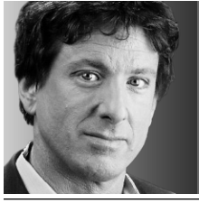
YVES BOISVERT CHRONIQUE

Is ont fini par trouver un nom un peu compliqué, mais quelle importance, au fond?