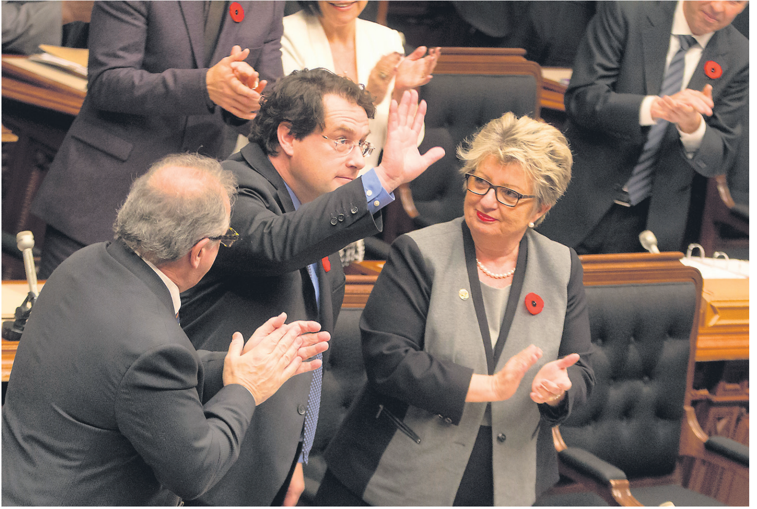
Le ministre Bernard Drainville a reçu l'appui de ses collègues du Parti québécois à l'Assemblée nationale, hier, notamment la ministre responsable de la Charte de la langue française, Diane De Courcy.

Dans le projet d'hier, plusieurs modifications aux intentions annoncées il y a deux