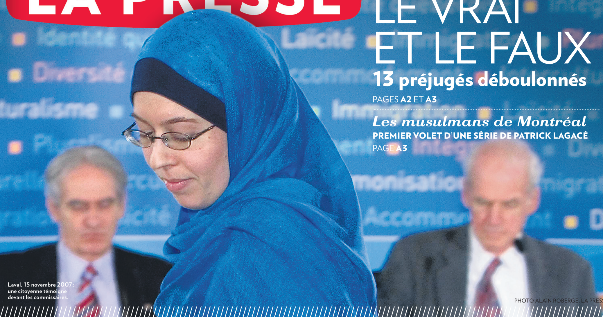
Laval, 15 novembre 2007 : une citoyenne témoigne devant les commissaires.

PAGES A2 ET A3 Les musulmans de Montréal PREMIER VOLET D'UNE SÉRIE DE PATRICK LAGACÉ PAGE A3