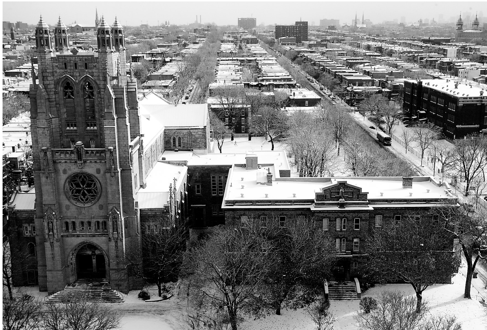
Le monastère rédemptoriste sera converti en 287 appartements pour personnes âgées. Les pères rédemptoristes ne sont plus que 18 à habiter l'immense immeuble.

« Ce projet est intéressant parce qu'il y a peu d'intervention sur les bâtiments, explique M me Besner. L'intégrité architecturale est conservée, de même que le jardin.