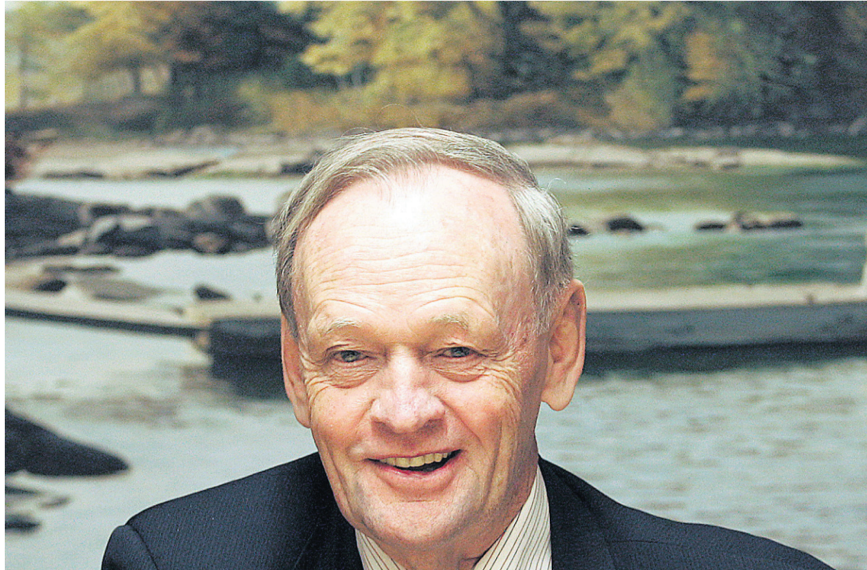
Jean Chrétien, qui avait refusé d'engager le Canada dans l'invasion de l'Irak, a envoyé une flèche à l'administration Bush, hier.

Sur une note plus légère, il a raconté en détail la tentative d'agression dont lui et sa femme avaient été l'objet en 2005 dans leur chambre à coucher au 24 Sussex Drive. Sa femme, Aline, après avoir vu l'intrus dans le corridor, aurait dit: « Je l'ai vu. Il a des gants, il a une tuque, il a un couteau et il ressemble à Forrest Gump! »