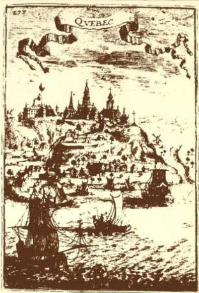
Bibliothèque Nationale du Québec