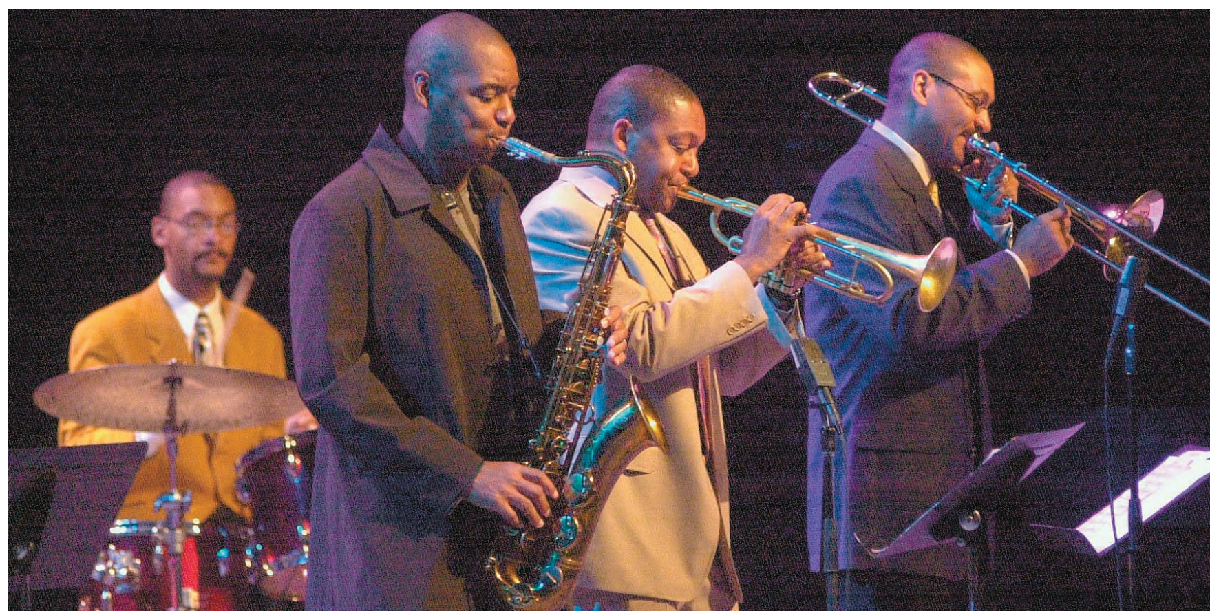
Les frères Marsalis: Jason, Branford, Wynton et Delfeayo.

CAHIER C | LA PRESSE | MONTRÉAL | MARDI 25 FÉVRIER 2003