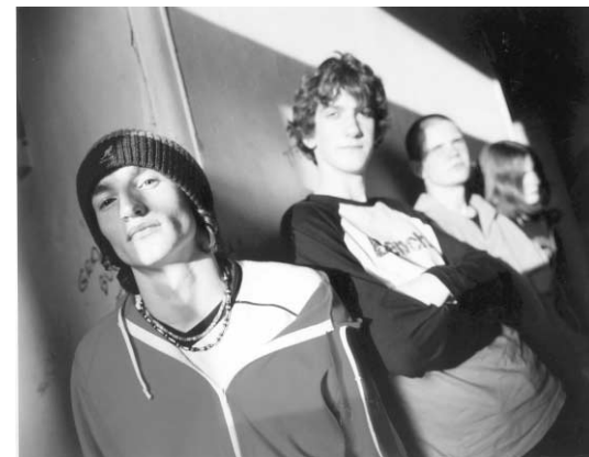
Les membres du groupe The Music.

C'est dans le côté blues qui vient napper ces chansons brouillonnes et gonflées de The Music qu'on détecte l'influence du guitariste