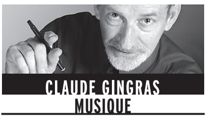
CLAUDE GINGRAS MUSIQUE

L'Atelier d'opéra de l'Université de Montréal présente Dialogues des Carmélites , de Poulenc, pour quatre représentations à compter de demain soir, 19 h 30, salle Claude-Champagne. Inspiré d'un épisode de la Révolution française, soit l'arrestation et la condamnation à mort des Carmélites de Compiègne, l'ouvrage de Poulenc est monté à l'UdM par Alice Ronfard et dirigé par Jean-François Rivest. La partition comprend 30 rôles, dont 18 de religieuses. Il y a deux distribu-