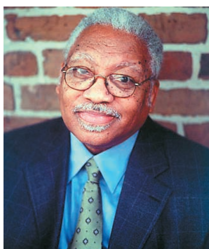
Ellis Marsalis, père d'une impressionnante dynastie.

Enregistrant jusqu'au tournant du millénaire sur la puissante étiquette Columbia, Wynton et Branford sont devenus célèbres à l'aube des années 1980. Le timing de leur lancée était alors excellent : des millions de mélomanes s'approprièrent à renouveler leur discothèque, vu l'arrivée du CD. Ce changement technologique coïncidait avec la réémergence du jazz acous-