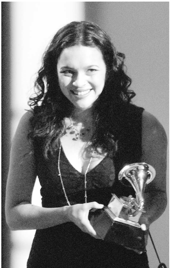
Norah Jones a remporté cinq Grammy Awards, dimanche soir.