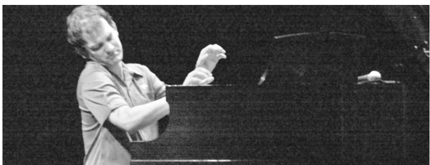
Brad Mehldau, en juin dernier à Montréal.

Le chanteur de U2, Bono, ne ménage pas ses efforts pour donner un coup de main à l'Afrique. En compagnie de Bob Geldof, à qui l'on doit notamment Live Aid, il a mis sur pied DATA (Debt, AIDS, Trade in Africa), une initiative visant à aider les pays africains dans le besoin. Comme le nom de l'organisme l'indique, la dette, le sida et le commerce (équitable, sans doute), seront les chevaux de bataille de DATA. « Ce sont les trois enjeux les plus importants pour l'Afrique », a déclaré le chanteur au Hollywood Reporter . Bono a été déclaré personnalité de l'année par l'Académie des arts et des sciences de l'enregistrement, lors du long week-end des Grammys.