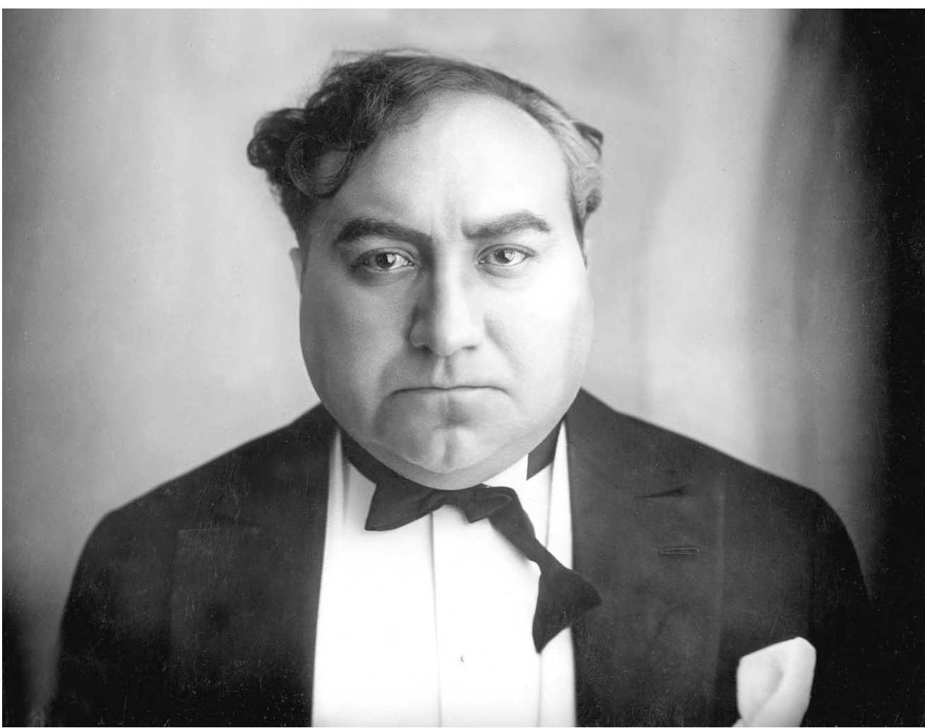
Le comédien et cinéaste juif, Kurt Geron.