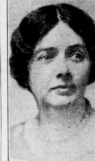
Mme Iva Campbell FALLS, de Peterboro, Ontario, qui, par sa récente nomination à la Chambre Haute, devient la deuxième femme sénateur du Canada.