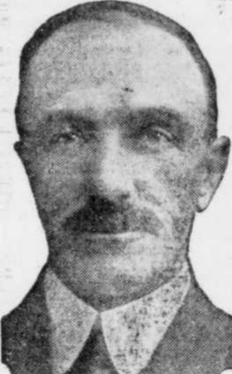
L'hon. WALTER M. LEA, le nouveau premier ministre de l'île du Prince-Édouard, qui a remporté une victoire unique, aux élections provinciales de l'île du Prince-Édouard, en faisant élire tous ses candidats libéraux.