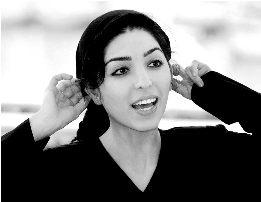
La réalisatrice Samira Makhmalbaf, lors du Festival de Cannes en mai 2000.