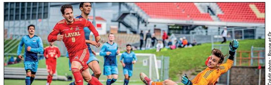
Trois étudiants-athlètes du Rouge et Or de l'Université Laval apparaissent sur le tableau d'honneur du Réseau du sport étudiant du Québec (RSEQ) pour la saison 2019 de soccer extérieur.

Enfin, la troupe de Samir Ghrib est partie à la conquête d'un premier titre provincial depuis 2013 le dimanche 27 octobre prochain en affrontant les Carabins de Montréal au CEPsum en demi-finale du RSEQ. Troisième au classement général en 2019, le Rouge et Or s'est avoué vaincu à deux reprises cette saison contre Montréal. ■