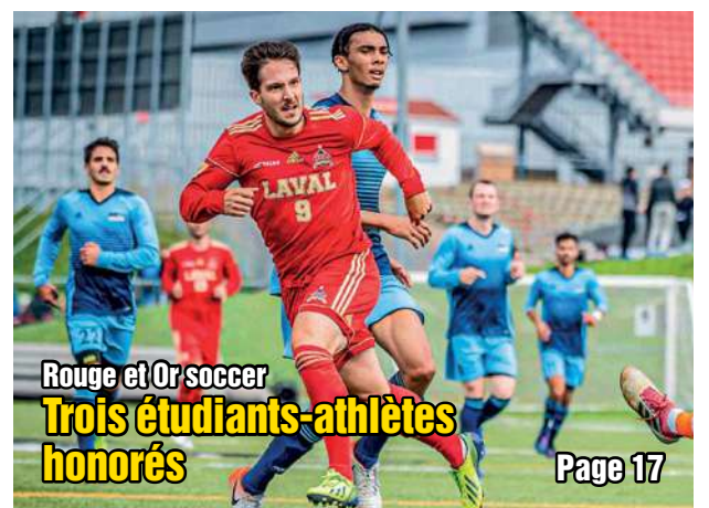
Rouge et Or soccer Trois étudiants-athlètes honorés