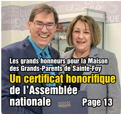
Les grands honneurs pour la Maison des Grands-Parents de Sainte-Foy Un certificat honorifique de l'Assemblée nationale