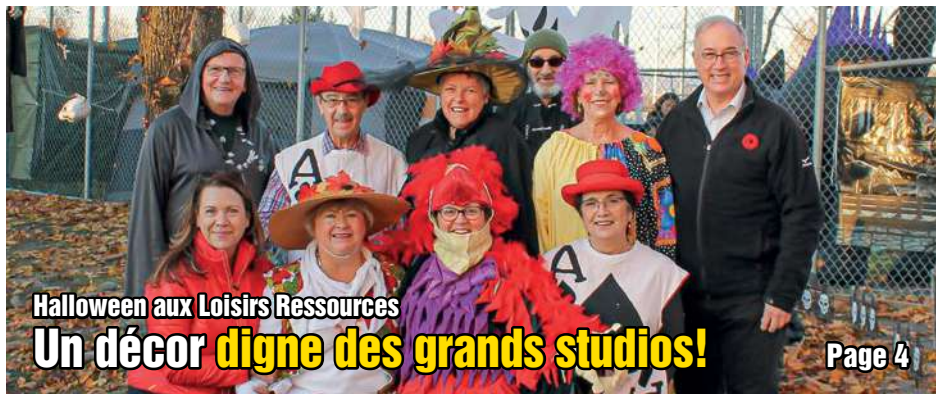
Halloween aux Loisirs Ressources Un décor digne des grands studios!