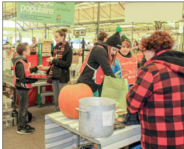
Des bénévoles en pleine action.