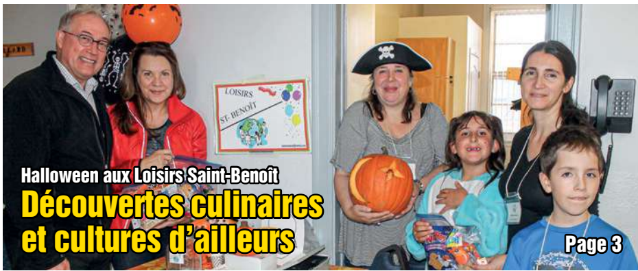
Halloween aux Loisirs Saint-Benoît Découvertes culinaires et cultures d'ailleurs