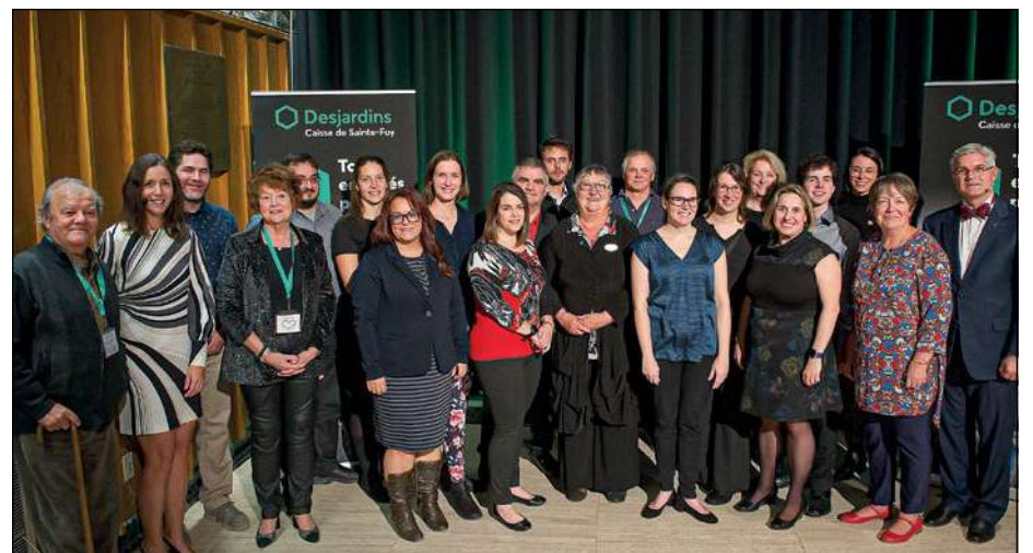
Les organismes lauréats de cette 10 e édition de remise des prix FADM de la Caisse Desjardins de Sainte-Foy.