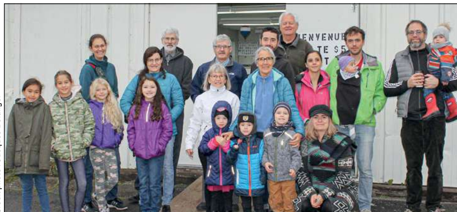
Les membres du premier groupe de visiteurs de L'EspaceLab, photographiés quelques minutes avant la visite des locaux de la SMFQ.

Petits et grands ont commencé la journée sur une note des plus agréables. Rappelons que cette année, l'exposition de trains miniatures se tenait les 12, 13 et 14 octobre dernier. ■