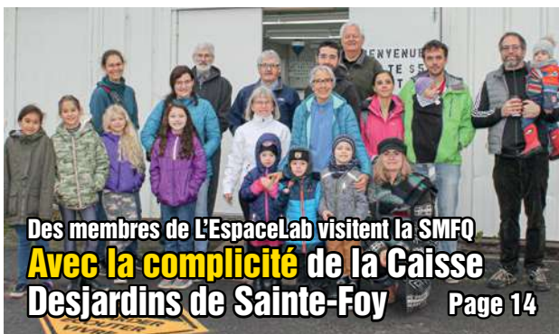
Des membres de L'EspaceLab visitent la SMFQ Avec la complicité de la Caisse Desjardins de Sainte-Foy