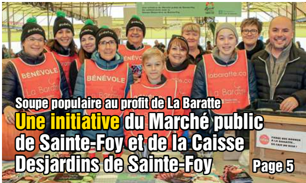
Soupe populaire au profit de La Baratte Une initiative du Marché public de Sainte-Foy et de la Caisse Desjardins de Sainte-Foy