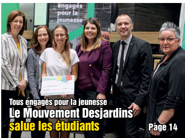
Tous engagés pour la jeunesse Le Mouvement Desjardins salue les étudiants