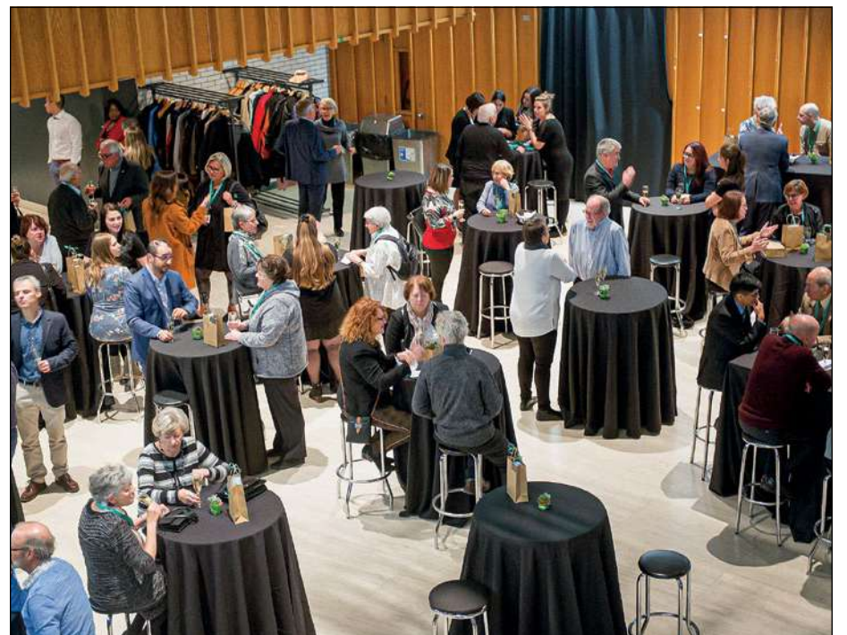
À la Margelle du Cégep de Sainte-Foy, l'ambiance portait à la bonne humeur et aux échanges entre les organismes du secteur.