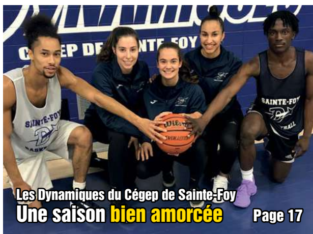
Les Dynamiques du Cégep de Sainte-Foy Une saison bien amorcée