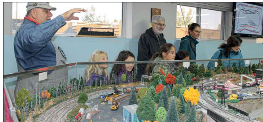
Petits et grands ont pu en apprendre davantage sur la passion du modélisme ferroviaire qui anime les membres de la SMFQ.