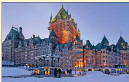
Fairmont Le Château Frontenac