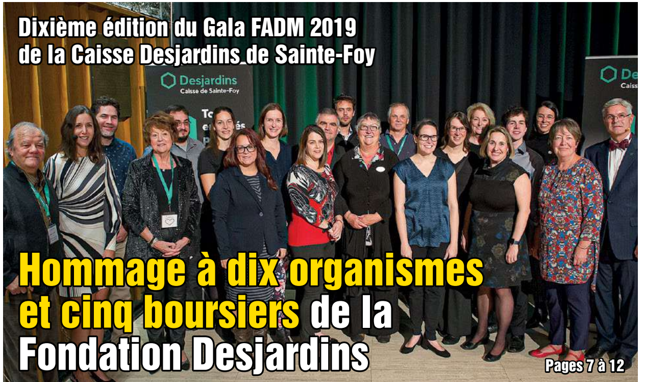
Dixième édition du Gala FADM 2019 de la Caisse Desjardins de Sainte-Foy