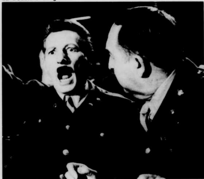
La Doublure du général