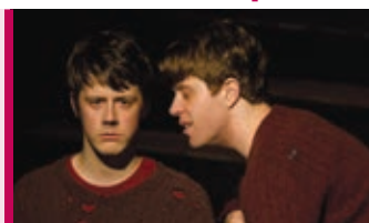
Le grand cahier 16 mars – 20 h Théâtre Lionel-Groulx Théâtre