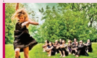
S'envoler 29 mars – 20 h Théâtre Lionel-Groulx Danse