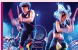
Scrap arts music 25 mars – 20 h Théâtre Lionel-Groulx Ados et grand public moins de 18 ans (50% rabais)