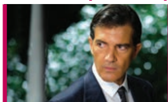
La peau que j'habite 11 mars – 16 h et 19 h 30 Théâtre Lionel-Groulx Cinéma