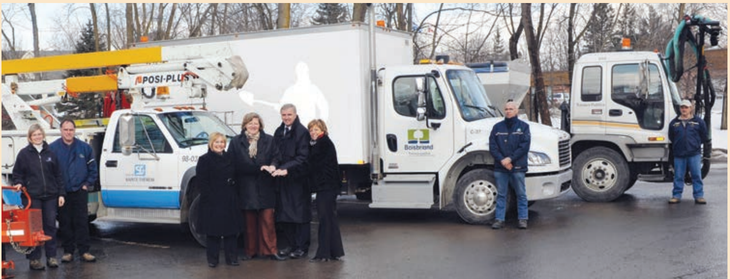
Le maire de Blainville, François Cantin, est entouré des mairesses de Boisbriand, Sainte-Thérèse et Rosemère, ainsi que d'employés des Services des travaux publics des 4 villes participantes.

La mise en application demeure assujettie au maintien des opérations courantes de chaque ville sur son propre territoire. La collaboration intermunicipale ne prendra donc forme que si elle ne nuit pas aux opérations de terrain.