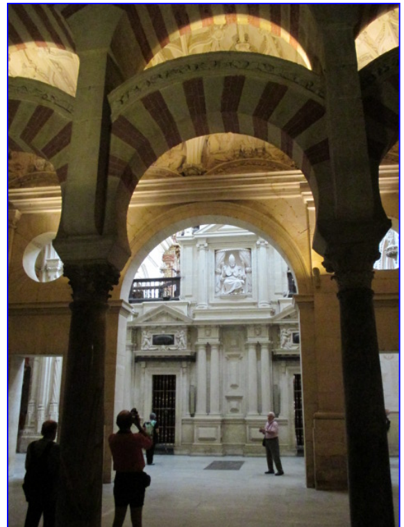
Mosquée-cathédrale Cordoue, en Espagne. De toute beauté

La suite dans les Chroniques de Jacques .