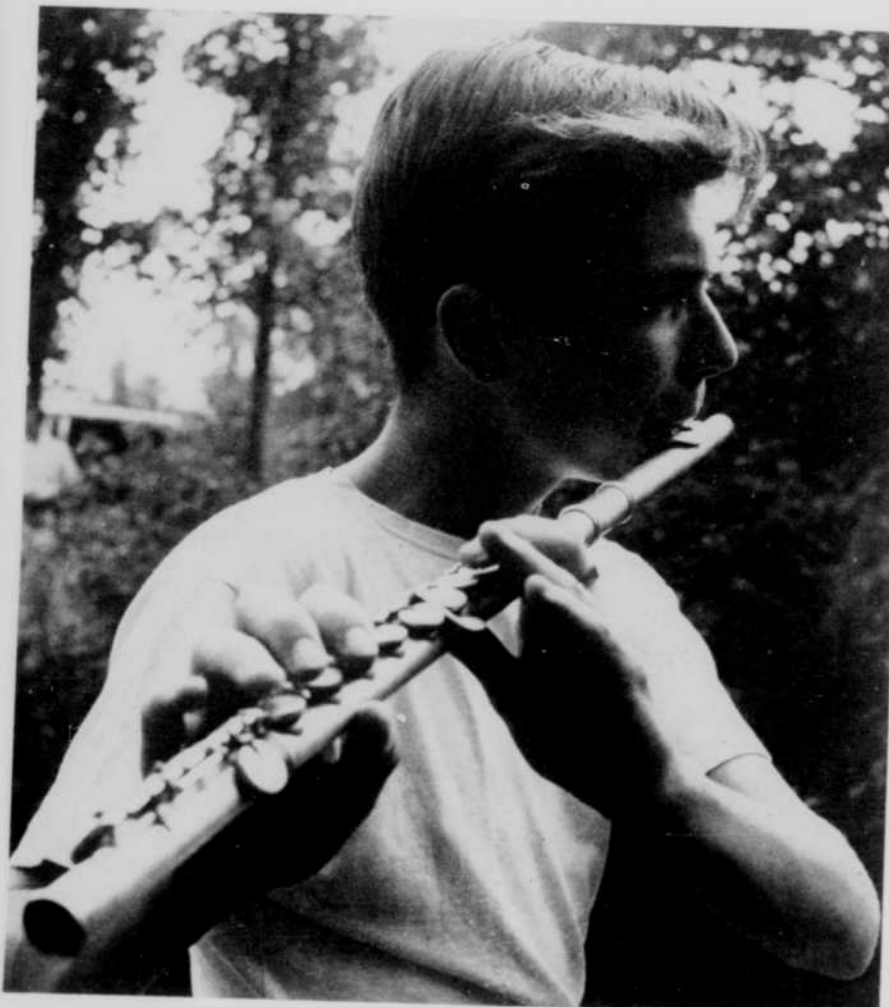
"Jeunesses musicales", côté pratique. La radio nous fera profiter de l'enseignement théorique donné aux campeurs.