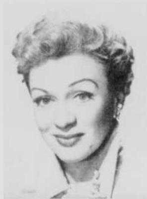
Eve Arden (Miss Brooks)