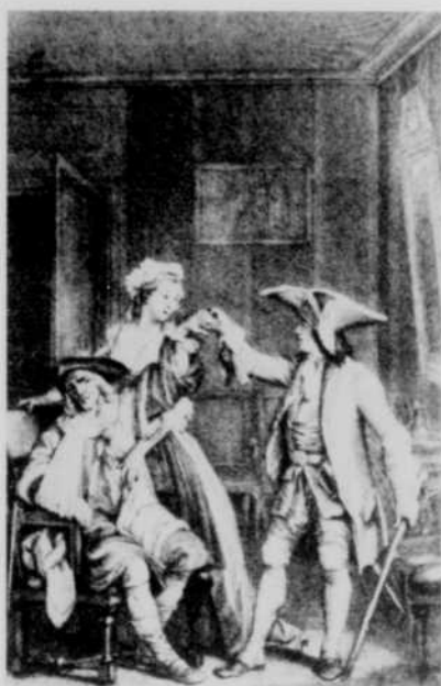
"Le Légataire universel", d'après un dessin de Moreau le Jeune.

L e Légataire universel , que nous entendrons le mercredi 6 janvier à 8 heures du soir, dans le cadre de la série radiophonique Sur toutes les scènes du monde , n'est rien de plus qu'une farce, et la plus gaie que Jean-François Regnard ait écrite.