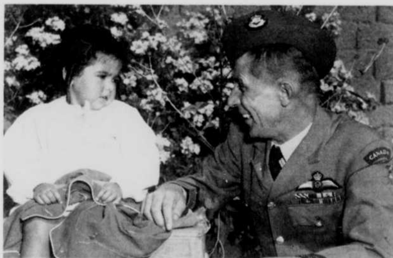
Un officier de l'aviation canadienne échange ici quelques mots avec une fillette d'un orphelinat européen, à qui il vient de remettre des vêtements. Scène familière à nos militaires cantonnés dans les "Petits Canadas" d'Europe.