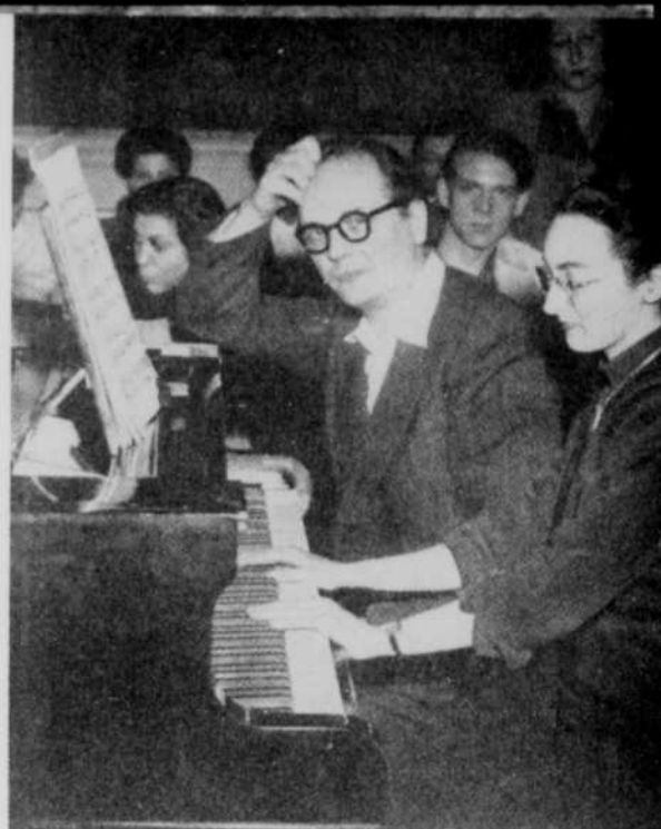
OLIVIER MESSIAEN au milieu de ses élèves, dont la pianiste Yvonne Loriod, qu'on entendra le 11 janvier.

La série Festivals européens présentera aux amateurs de belle musique beaucoup d'autres oeuvres créées par des compositeurs de notre époque. C'est ainsi que, à compter du 18 janvier, chaque émission comportera au moins une oeuvre dodécaphonique. On entendra d'excel-