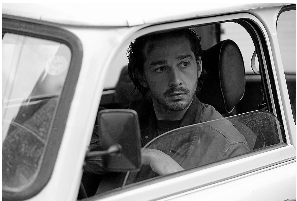
L'acteur Shia LaBeouf dans une scène du film Charlie Countryman .

Le deuxième court métrage de Shia LaBeouf, très bien accueilli au Festival de Cannes où il a été sélectionné en 2012, traite ironiquement de déontologie journalistique. Tout comme The Company You Keep de Robert Redford (2012 aussi), dans lequel le jeune acteur incarne un