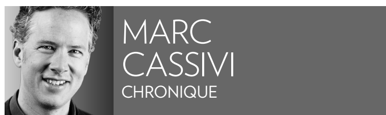
MARC CASSIVI CHRONIQUE

Shia LaBeouf a été pris la main dans le sac. Le jeune acteur américain, qui est de la distribution du sulfureux film de Lars von Trier Nymphomaniac , a réalisé un court métrage inspiré d'une bande dessinée... sans en demander la permission à son auteur.