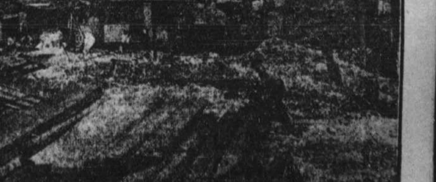
Vue du camp où les vétérans américains s'étaient installés près du Capitole en attendant que le gouvernement règle la question de leur traitement. Les vétérans ont reçu l'ordre d'évacuer la place qui est la propriété du gouvernement, étant donné que celui-ci doit construire sur cet emplacement. Les anciens soldats ont refusé de quitter les lieux et ont nommé un avocat pour défendre leur cause auprès des autorités.

Avez-vous besoin de bons livres? Adresses-vous au Service de librairie du "Devoir", 430 rue Notre-Dame est, Montréal. (Téléphone: HArbour 1241*).