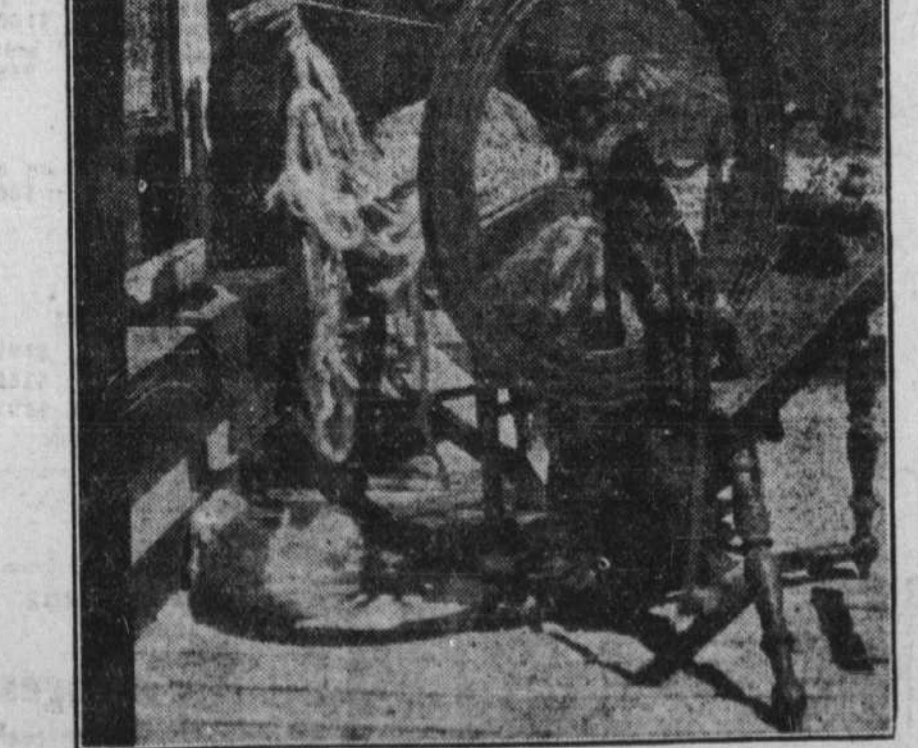
Il se tient ces jours-ci au Manoir Richelieu à la Malbaie une exposition d'arts domestiques sous les auspices de l'Ecole des arts domestiques de la province de Québec. L'on peut voir dans l'un des kiosques cette brave Canadienne qui fait tourner son rouet comme nos aïeules.