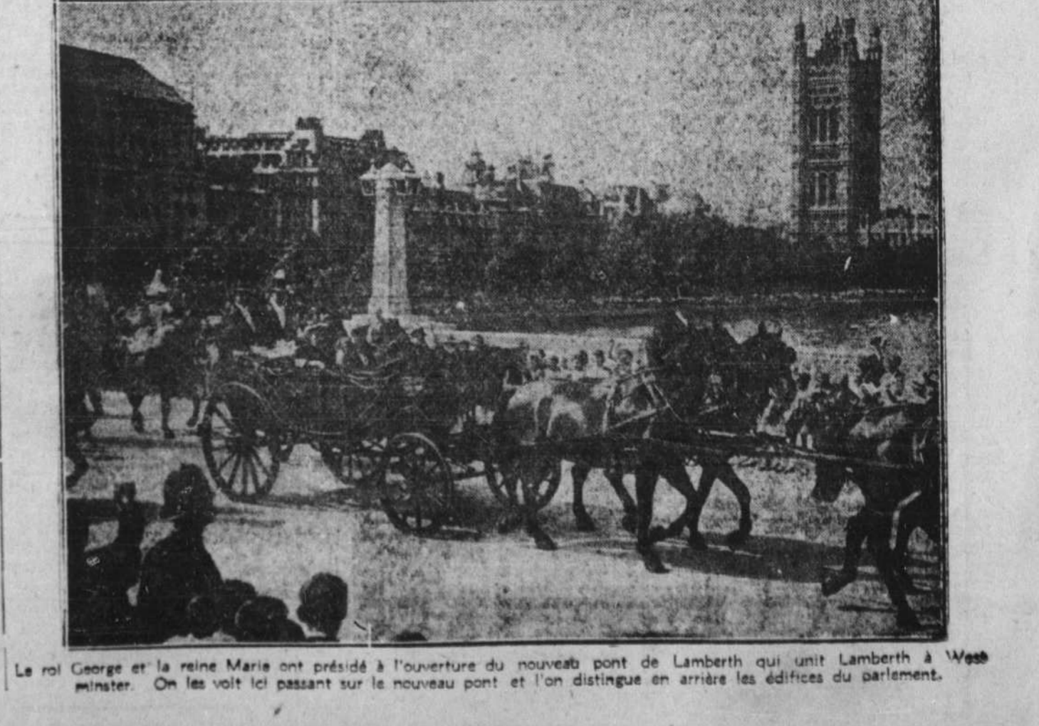
Le roi George et la reine Marie ont présidé à l'ouverture du nouveau pont de Lamberth qui unit Lamberth à Westminister. On les voit ici passant sur le nouveau pont et l'on distingue en arrière les édifices du parlement.