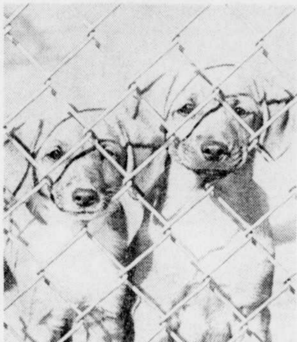
Nez à nez

Finie la fondue bourguignonne pour Bibi, le boeuf est trop cher. Hier midi je me suis acheté un livre de juteux cubes de viande ($0,99) du cheval s'il-vous-plait, et va donc pour la fondue Marchemignonne à partir de maintenant.