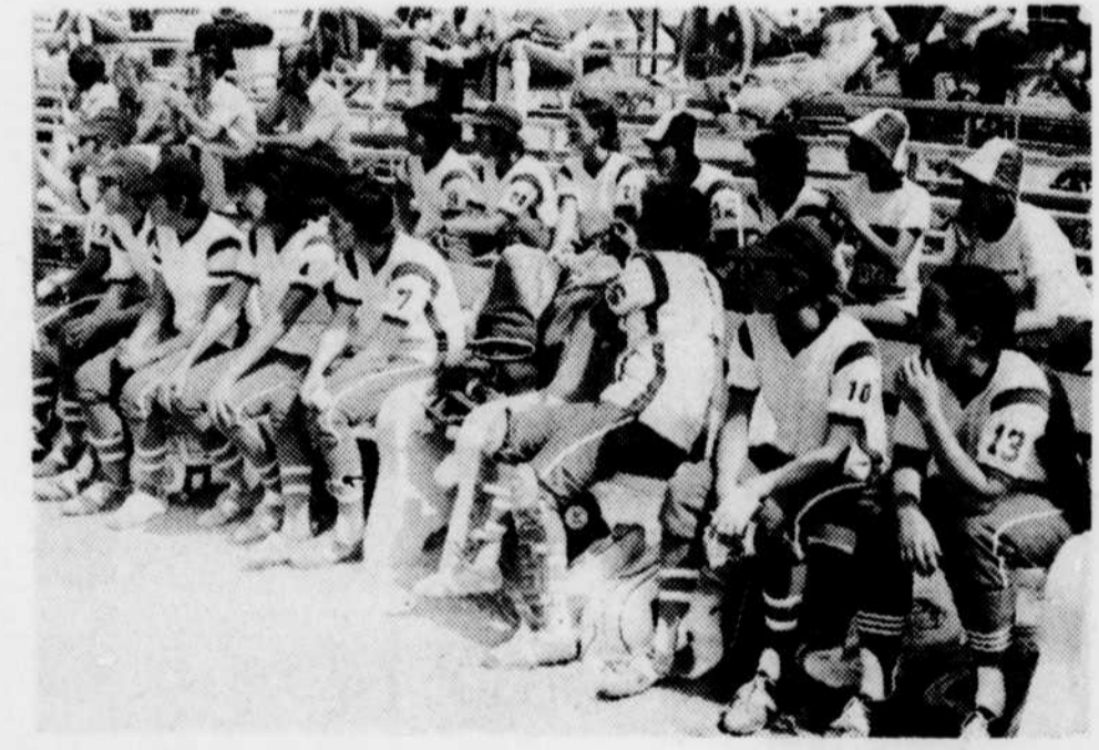
Un dernier regard