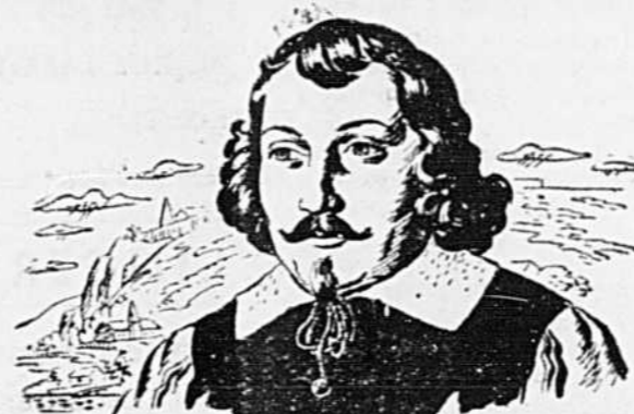
"Il a apporté au Canada la pensée française et la civilisation."

(Ceci est le neuvième d'une série d'articles publiés dans l'intérêt de nos lecteurs qui songent à construire ou acheter une maison.)