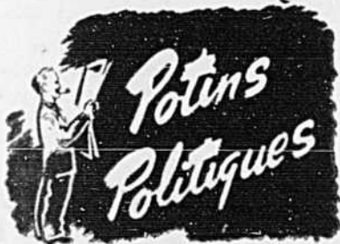
Contre l'autonomie scolaire