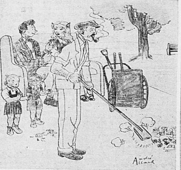
Le balayeur de rues à Saint-Jérôme: "Comment voulez-vous tenir une ville propre avec tant de casseaux vides et tant de patates frites jetés en arrière de mon balais!..."