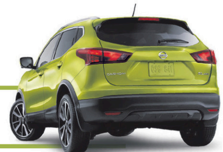
Qashqai SL Platine illustré*

PRIX À L'ACHAT À PARTIR DE 22 063 $* Transport et préparation inclus. Pour le Qashqai S.