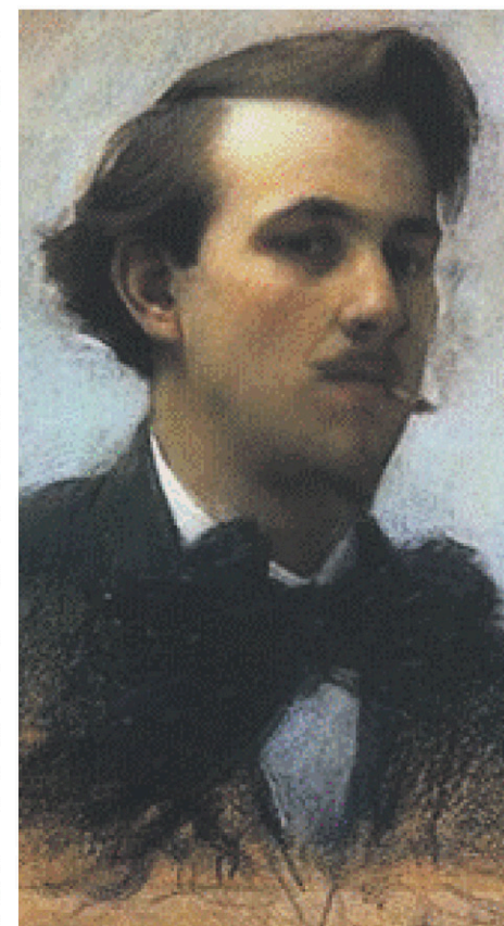
Suzor-Coté, le sujet de conversation du 5 septembre.

Les places étant limitées, il est préférable de réserver sa place au 819 357-8655 ou secretariatmlaurier@videotron.ca. L'entrée pour les membres amis(es) du Musée est de 5 $ et pour les non membres est de 10 $.