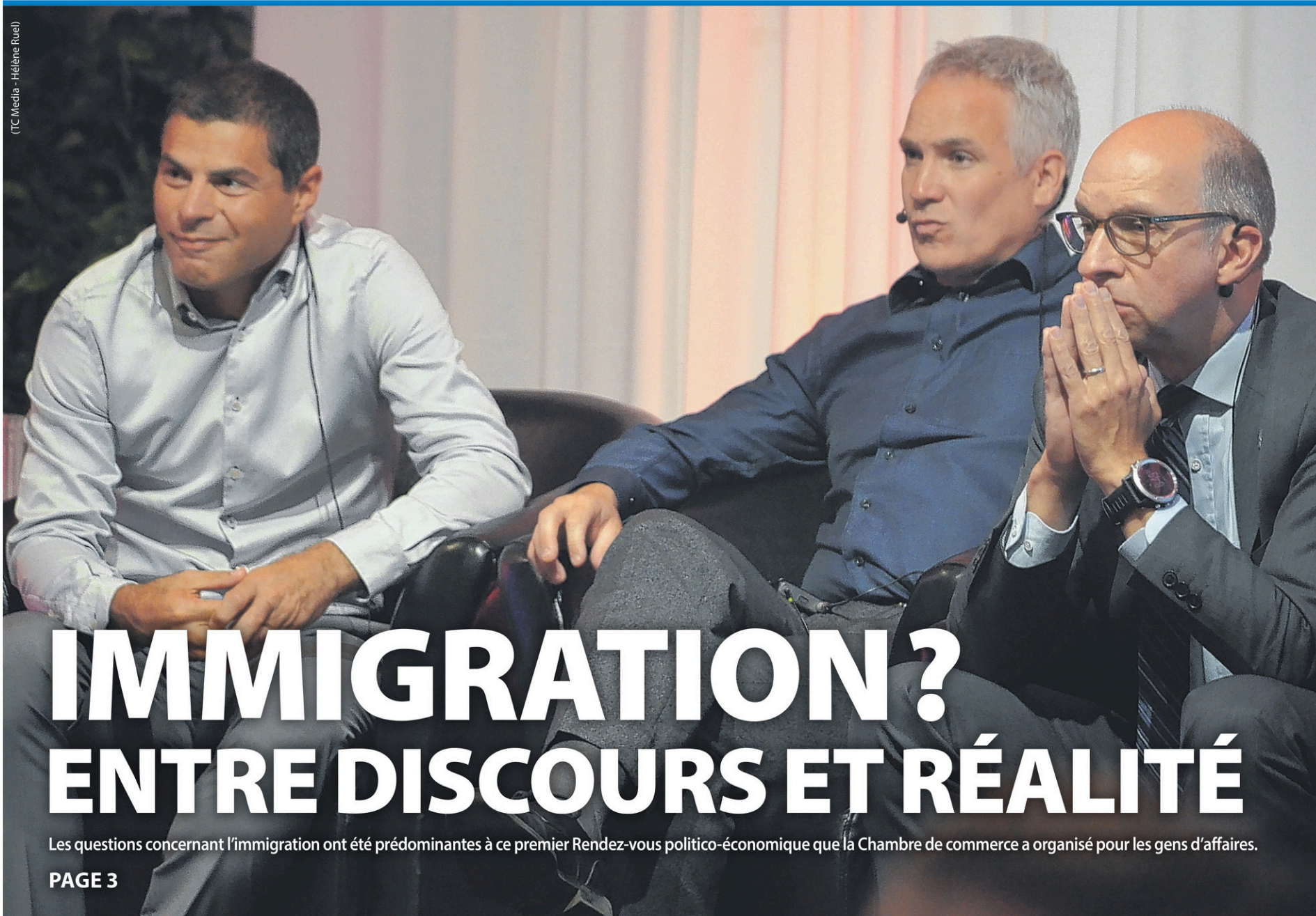
(TC Media - Hélène Ruel)