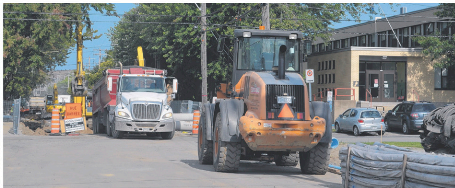
La rentrée des élèves de La Myriade a constitué un énorme casse-tête pour la CSBF en raison des travaux rue Monfette. Des parents ont décidé de garder leur enfant à la maison, craignant que les dynamitages ne les perturbent.

M. Sicotte souhaite qu'aucune famille ne soit dans l'inconfort et que les parents ayant décidé de garder leur enfant à la maison cette semaine puissent changer d'idée au cours des prochains jours, la CSBF s'engageant à leur offrir un environnement sain et sécuritaire.