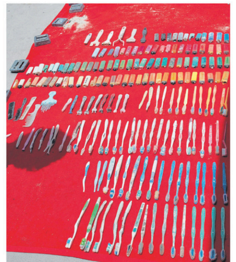
Parmi les déchets, des brosses à dents, des peignes et des briquets

« Dans un article paru, note Michel Labrecque, l'homme, considéré comme le plus grand explorateur de tous les temps, estime que, maintenant, la seule façon de pouvoir explorer, c'est d'être spécialisé, a-t-il dit, ajoutant que le monde s'ouvrirait à ceux qui ont la chance de pouvoir faire de la plongée sous-marine, car c'est la seule place où il y a encore de l'exploration à faire. »