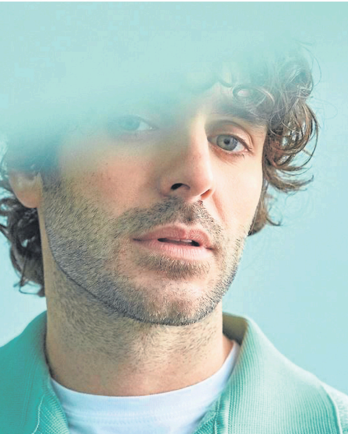
...vsky propose un album entièrement instrumental.

« Je me rends compte que ce qui veut émerger, c'est l'envie de partager mes mélodies. Ça n'a rien à voir avec moi qui donne des entrevues ou moi qui fais de l'argent. Ça, ce n'est plus important. Le temps m'a permis de faire le tri dans mes valeurs et de mieux m'aligner avec qui je suis. Avant, il y avait une quête d'argent. Là, je le fais pour l'amour de la musique, comme au début de ma carrière. J'ai ce même sentiment-là qui m'habite. »