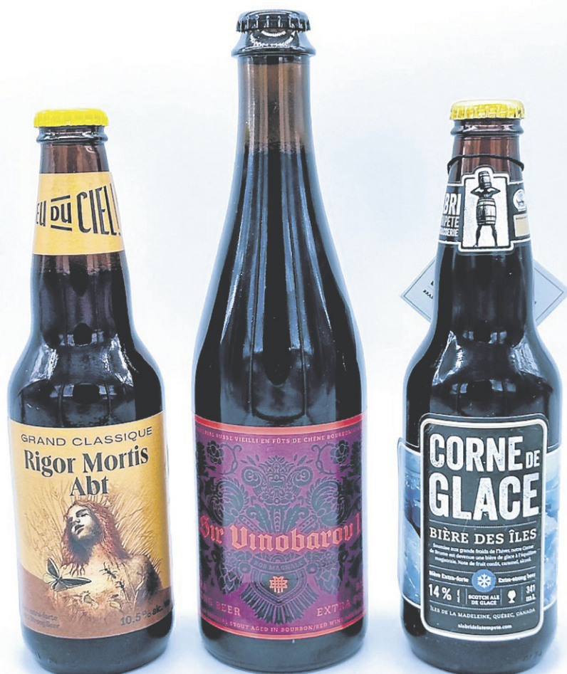
Trois bières extra-fortes à déguster.