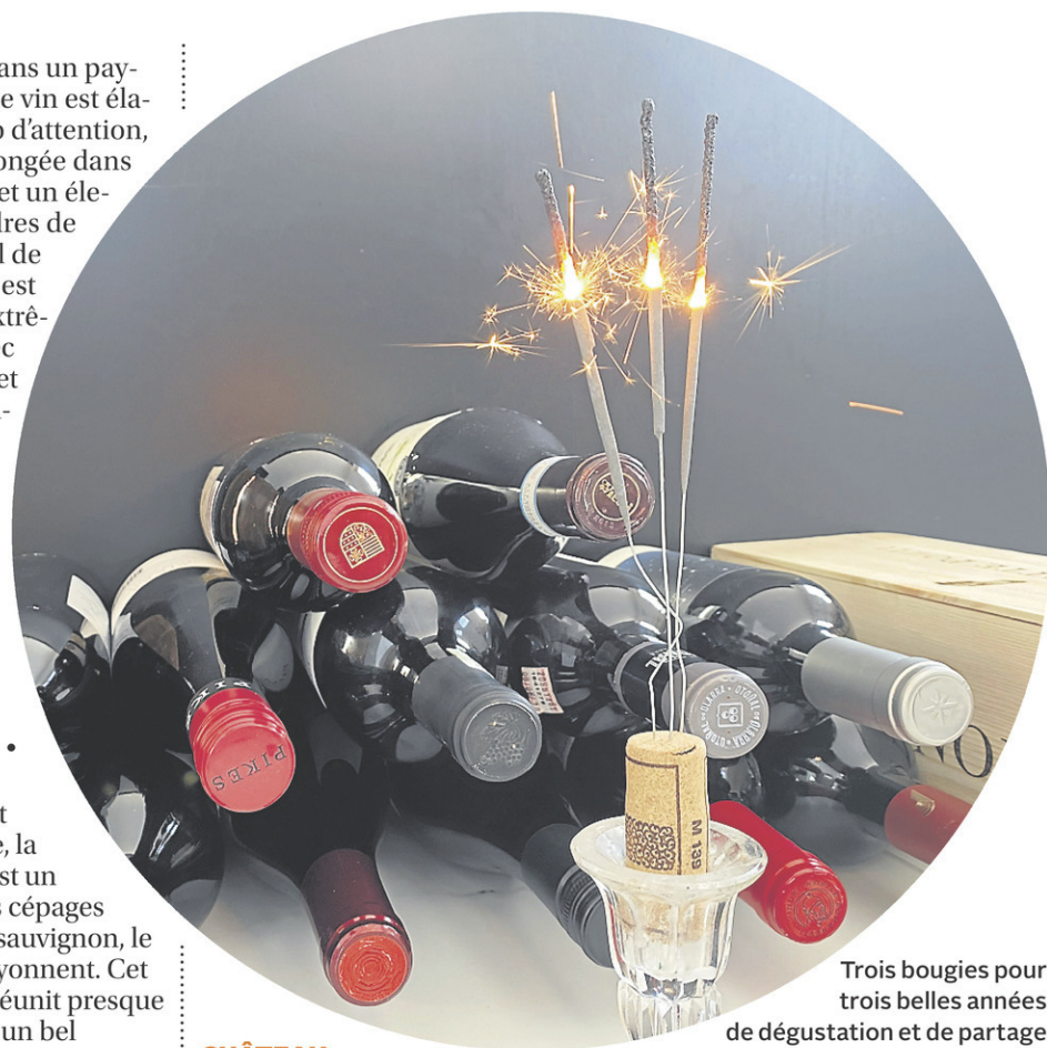
Trois bougies pour trois belles années de dégustation et de partage des meilleurs vins du moment.

Pour des suggestions quotidiennes de vins, suivez-moi sur Instagram @nrartdevivre ou sur mon site natalierichard.com