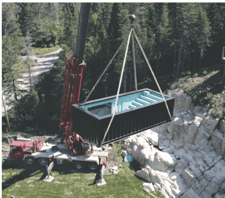
Selon Container Canada, les piscines-conteneurs peuvent être aménagées de façon autonome sur toutes sortes de terrains accessibles avec une grue.

Pour le moment, l'entreprise propose trois modèles de piscines-conteneurs. Le modèle Romy (8 x 20 ou 8 x 40 pieds), qui comprend une vitrine, le modèle Georges (8 x 20), et le modèle Sam (8 x 40).