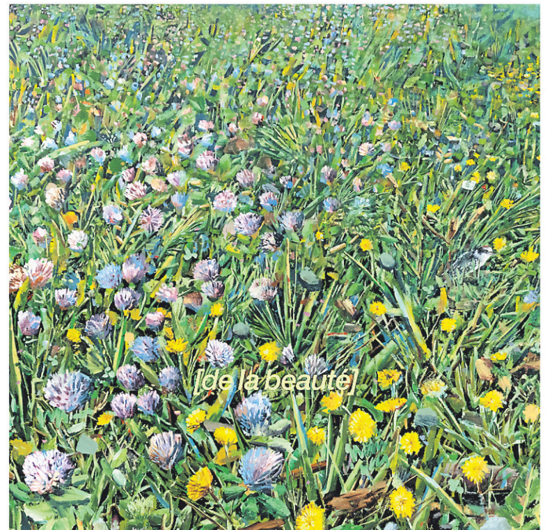
L'album Même l'impossible fleurit fait partie d'un projet plus large, intitulé [ de la beauté ].

Une séance d'écoute aura lieu le 18 mars à 10h dans l'intimité du Kool Club à Granby.