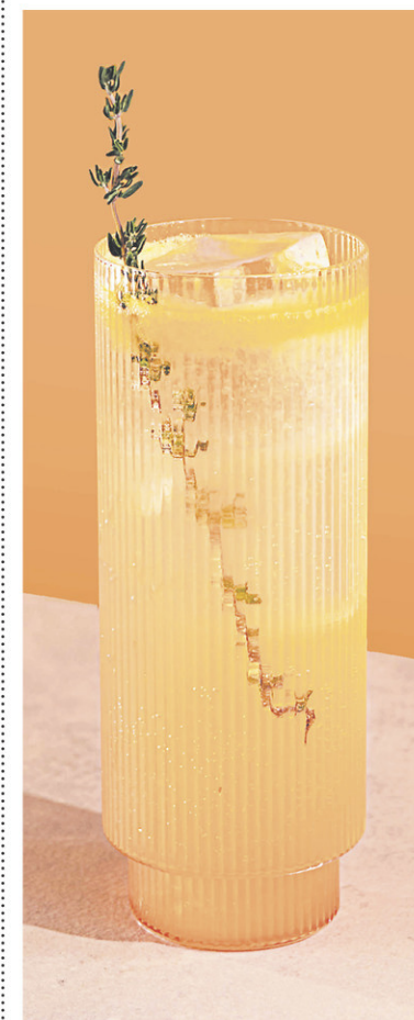
— MAËLLA LEPAGE