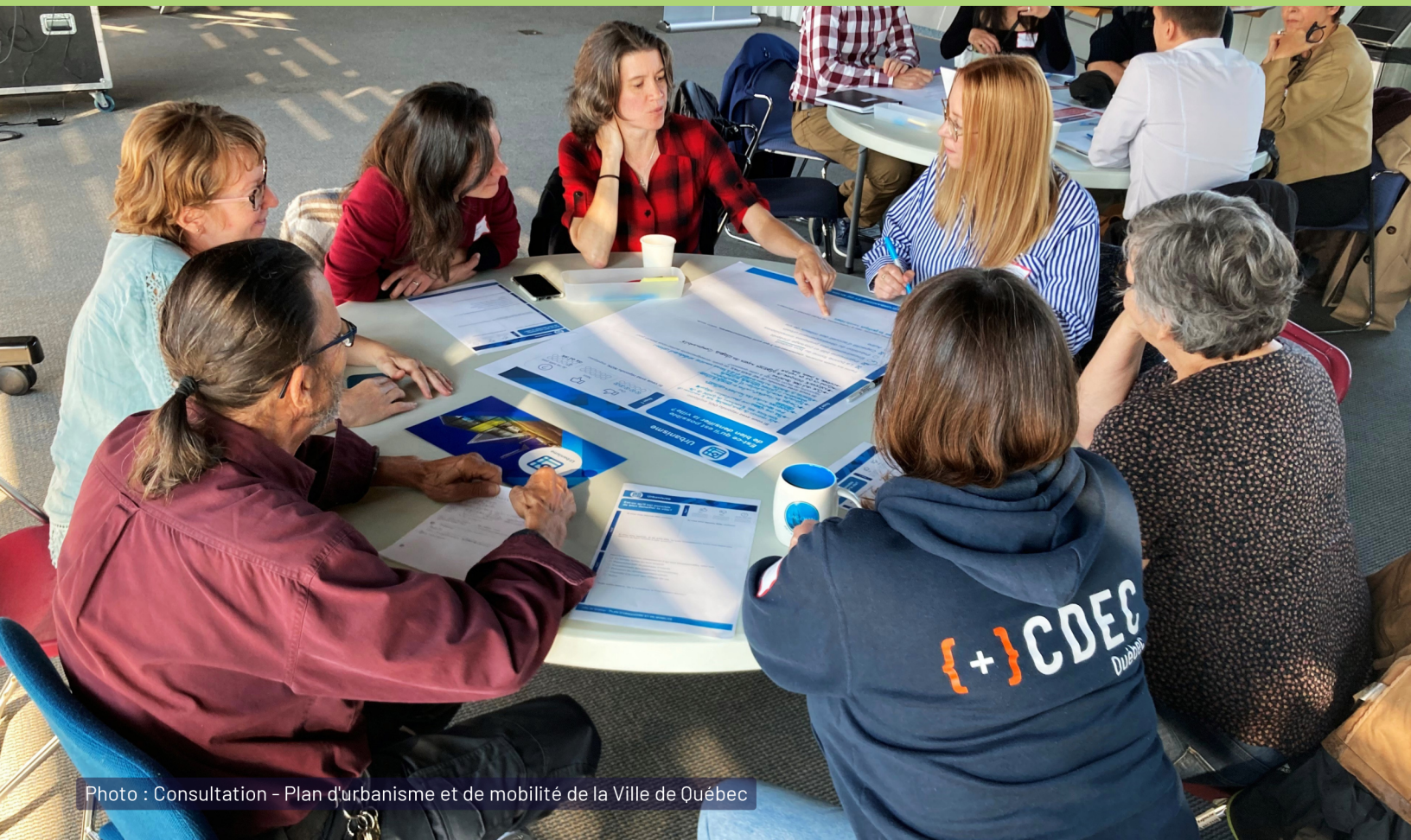
Photo : Consultation - Plan d'urbanisme et de mobilité de la Ville de Québec

La Ville de Québec a interpellé la CDEC à plusieurs reprises cette année afin de mettre à profit notre connaissance des enjeux et notre expertise en économie sociale. Ainsi, la CDEC a participé aux consultations portant sur l'élaboration de sa Politique de développement social , sur le Plan d'urbanisme et de mobilité et sur la mise à jour de la Vision entrepreneuriale 2026 . La CDEC a également été interpellée pour participer aux échanges sur la vitalité du quartier Saint-Roch . Ces échanges s'ajoutent aux travaux déjà entamés concernant l'offre alimentaire dans le Vieux-Québec et la revitalisation du secteur de la Canardière .