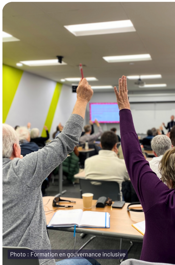
Photo : Formation en gouvernance inclusive