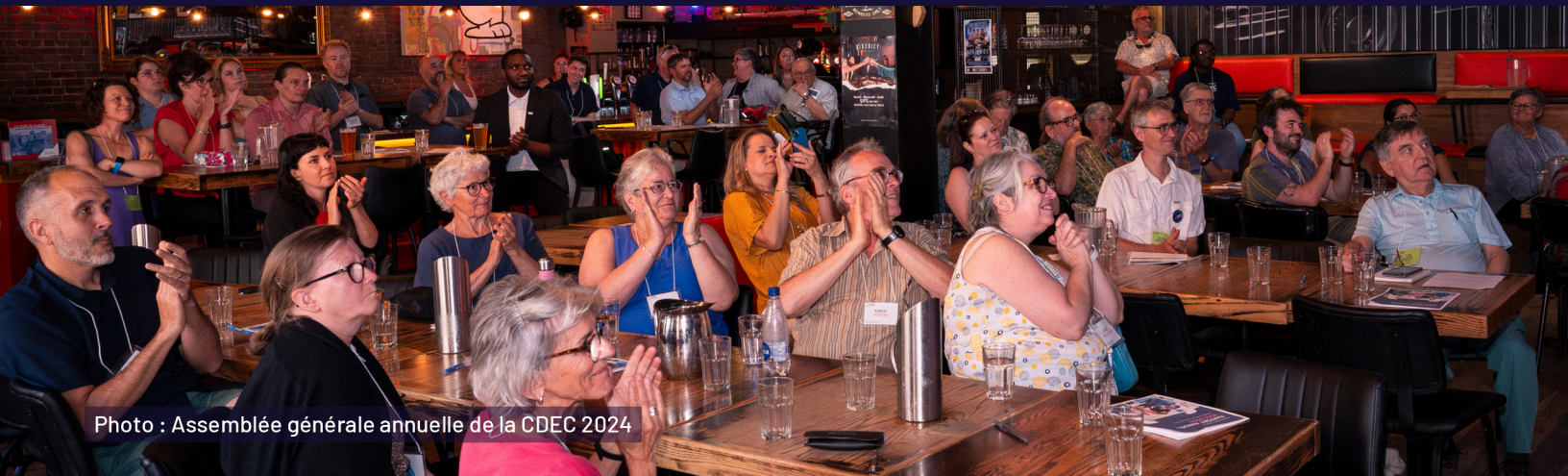
Photo : Assemblée générale annuelle de la CDEC 2024