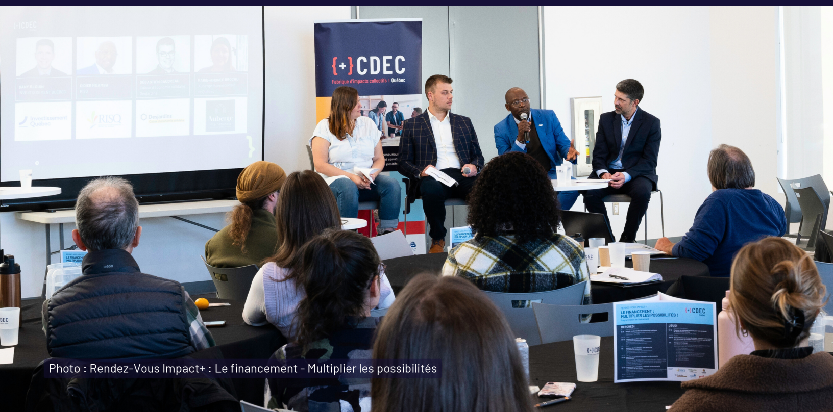
Photo : Rendez-Vous Impact+ : Le financement – Multiplier les possibilités