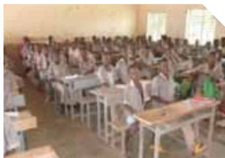
Bérégadougou. Modèle d'une école primaire en Afrique de l'Ouest. Classe de 80 élèves de 3 e secondaire au lycée départemental.

Quelle belle façon de terminer son diplôme d'études collégiales!