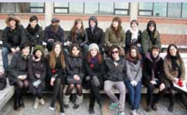
Nous les voyons ici à la fin d'une longue journée de marche...