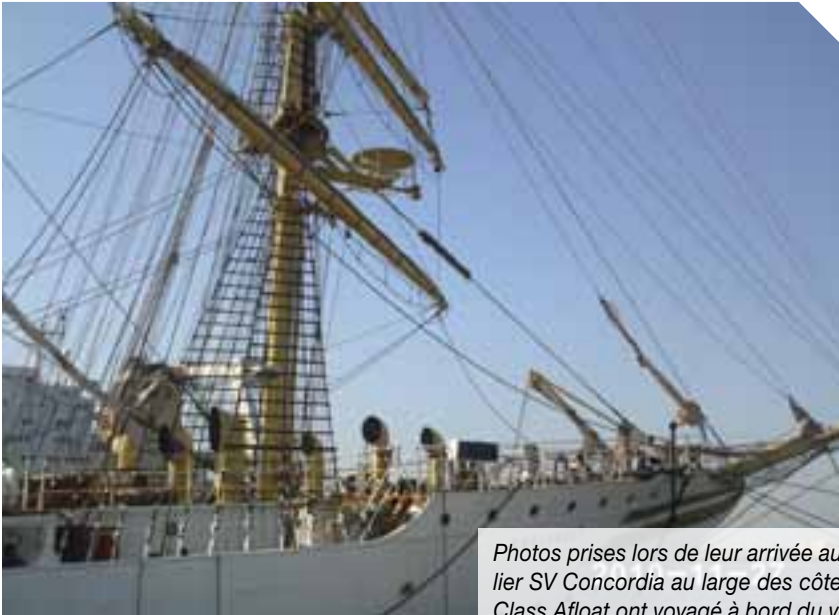
Photos prises lors de leur arrivée au Sénégal, en novembre 2010. À la suite du naufrage du voilier SV Concordia au large des côtes brésiliennes en février 2010, les étudiants du programme Class Afloat ont voyagé à bord du voilier SS Sorlandet.