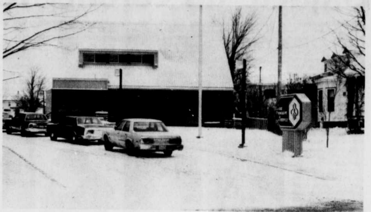
La Caisse populaire de Laurierville a été le théâtre, hier, d'un deuxième hold-up en moins de quatre mois. Fermée pour la journée, l'institution a rouvert ses portes ce matin.

Bien entendu, les résidents de Laurierville ont rapidement été informés de la situation. La plupart des gens, dans les endroits publics, plaignaient les membres du person-