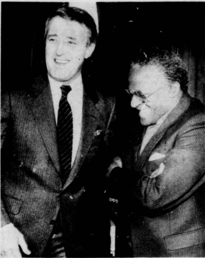
Mgr Desmond Tutu, prix Nobel de la paix 1984, a rencontré hier le premier ministre Brian Mulroney, à Ottawa.