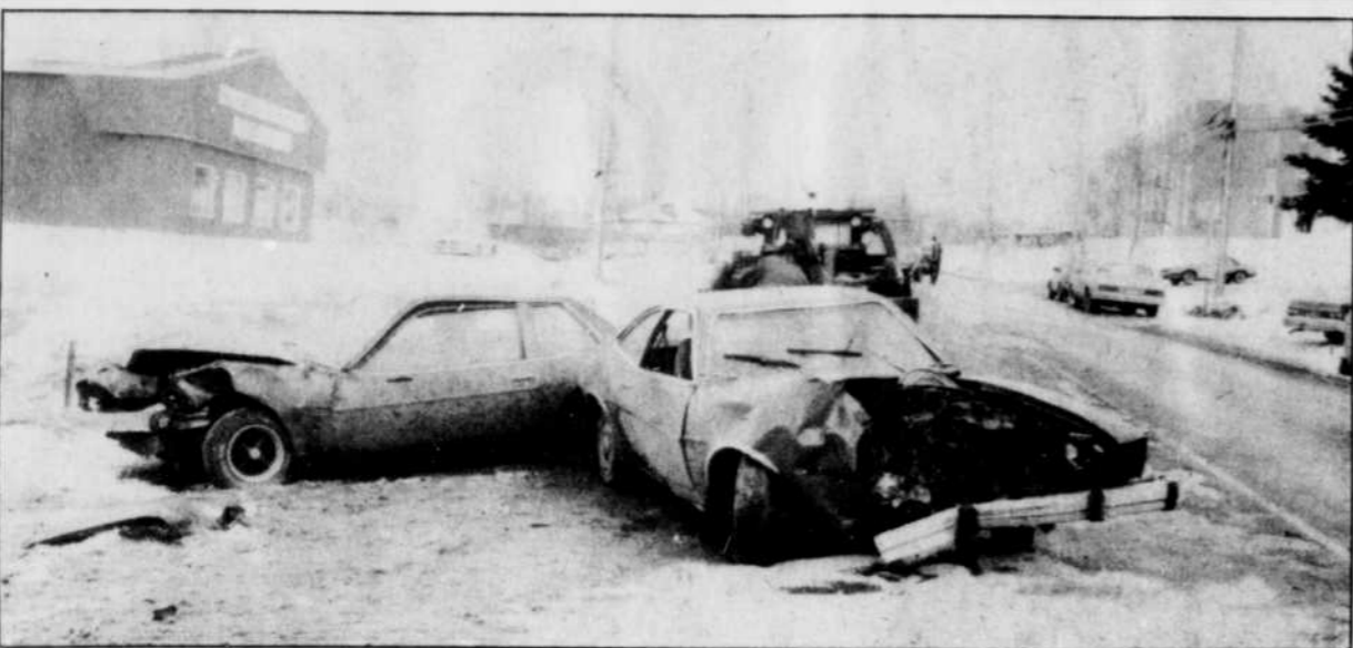
La collision de deux voitures de type intermédiaire, hier, en début d'après-midi, sur la rue King est, à Fleurimont, a fait quatre blessés.