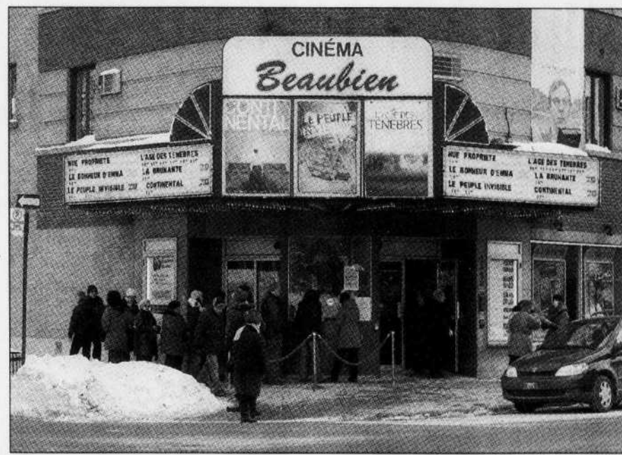
Le Cinéma Beaubien possède un des meilleurs taux d'occupation au Québec.

la climatisation du hall modifiée pour mieux répondre aux normes.