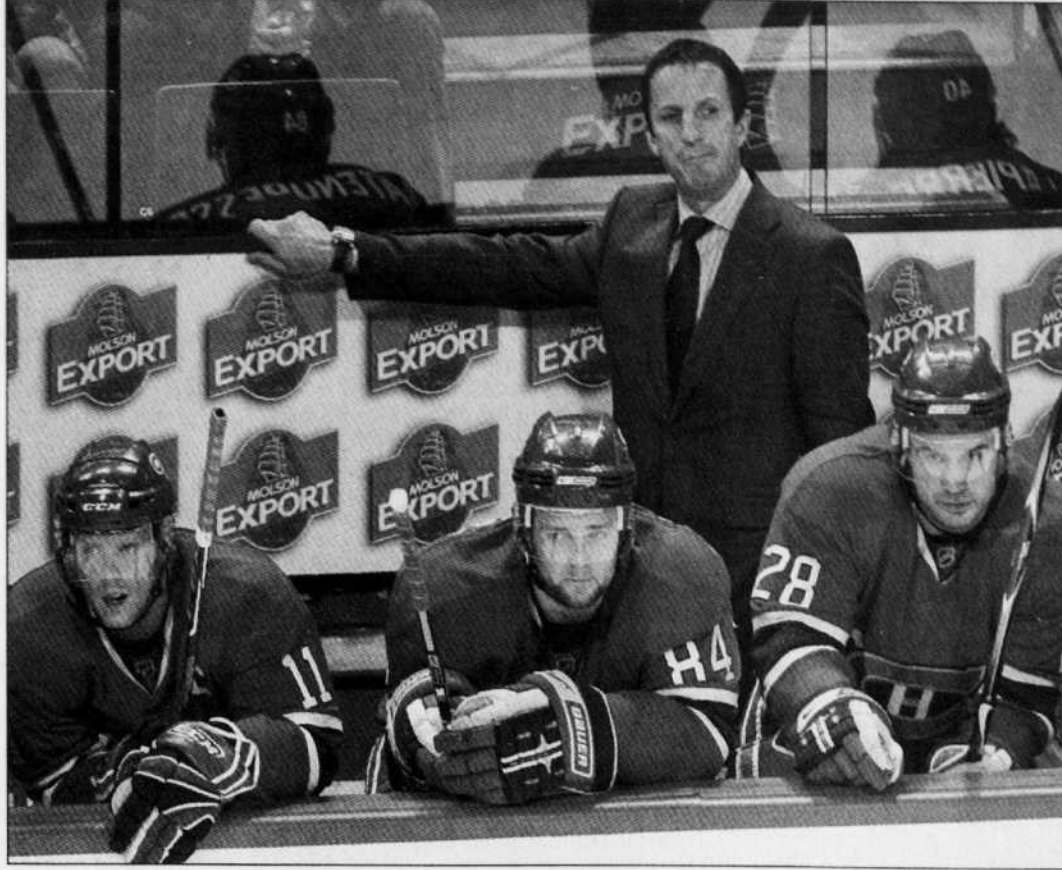
L'entraîneur Guy Carbonneau derrière le banc des joueurs du Canadien lors du match de samedi contre les Hurricanes de la Caroline du Nord. Un mauvais départ du Canadien contre le Lightning, demain, pourrait inciter la foule à manifester son mécontentement. Et c'est le capitaine qui risquerait alors d'écopier.