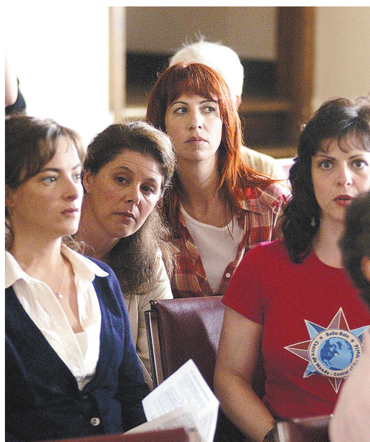
La population autour de Caraquet avait développé une grande passion pour Belle-Baie .