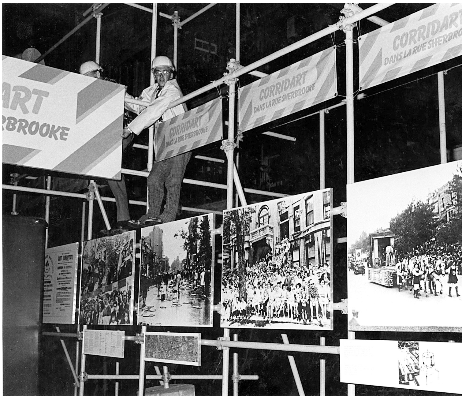
En 1976, des employés municipaux avaient démantelé l'exposition en plein air Corridart à la demande du maire Jean Drapeau.

L'ARCHITECTE, AUTREMENT Centre canadien d'architecture 1920, rue Baile, Montréal jusqu'au 10 avril