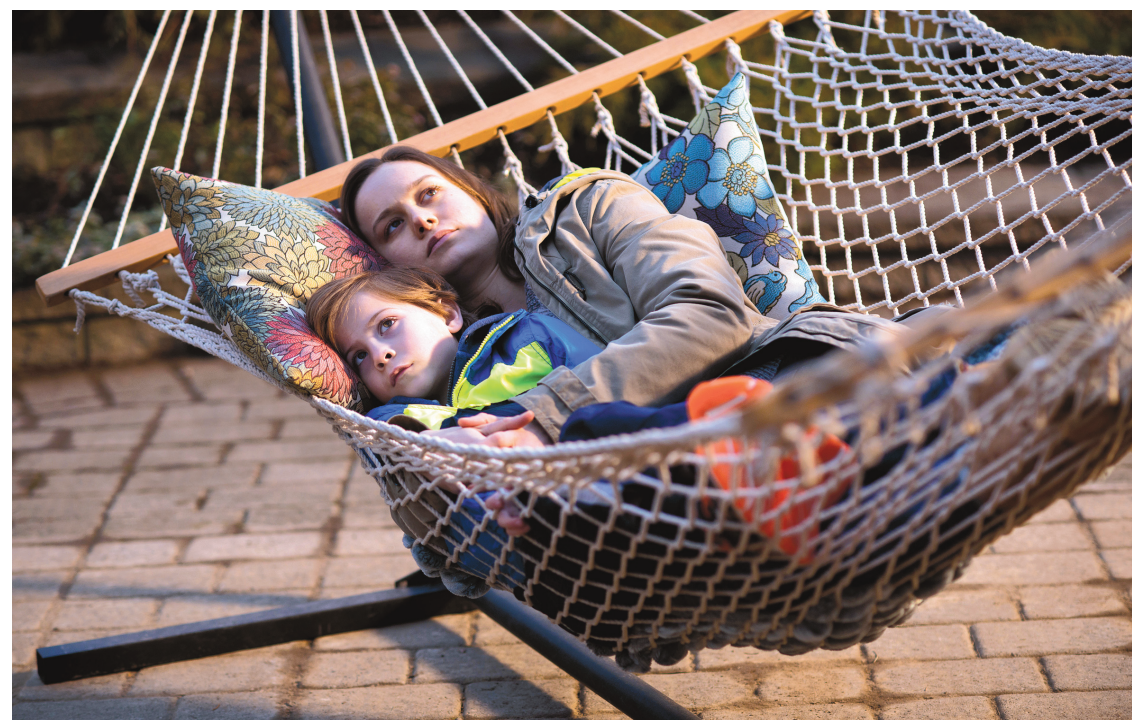
Room repose sur la force d'un regard d'enfant prisonnier de son carré de sable.

Jack, qui a l'air d'une fille, ambivalence voulue, est né dans un monde qu'il imagine sans y avoir accès autrement qu'à travers un écran de télé. Sa mère a été kidnappée par celui qu'ils appellent «Old Nick». Il est né dans un hangar et y vit