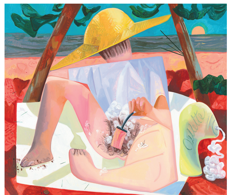
Grosse fatigue de Camille Henrot avait été primée Lion d'argent à la Biennale de Venise en 2013.