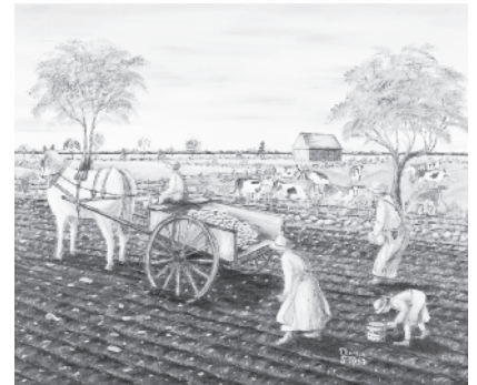
Photo : L'épierrement, huile sur toile Musée de la civilisation, don de Thérèse Sauvageau.

L'œuvre de Thérèse Sauvageau dépeint des scènes pittoresques de la vie rurale d'autrefois. Dans un extrême souci du détail, elle s'est appliquée à faire connaître les modes de vie et les valeurs de nos ancêtres.