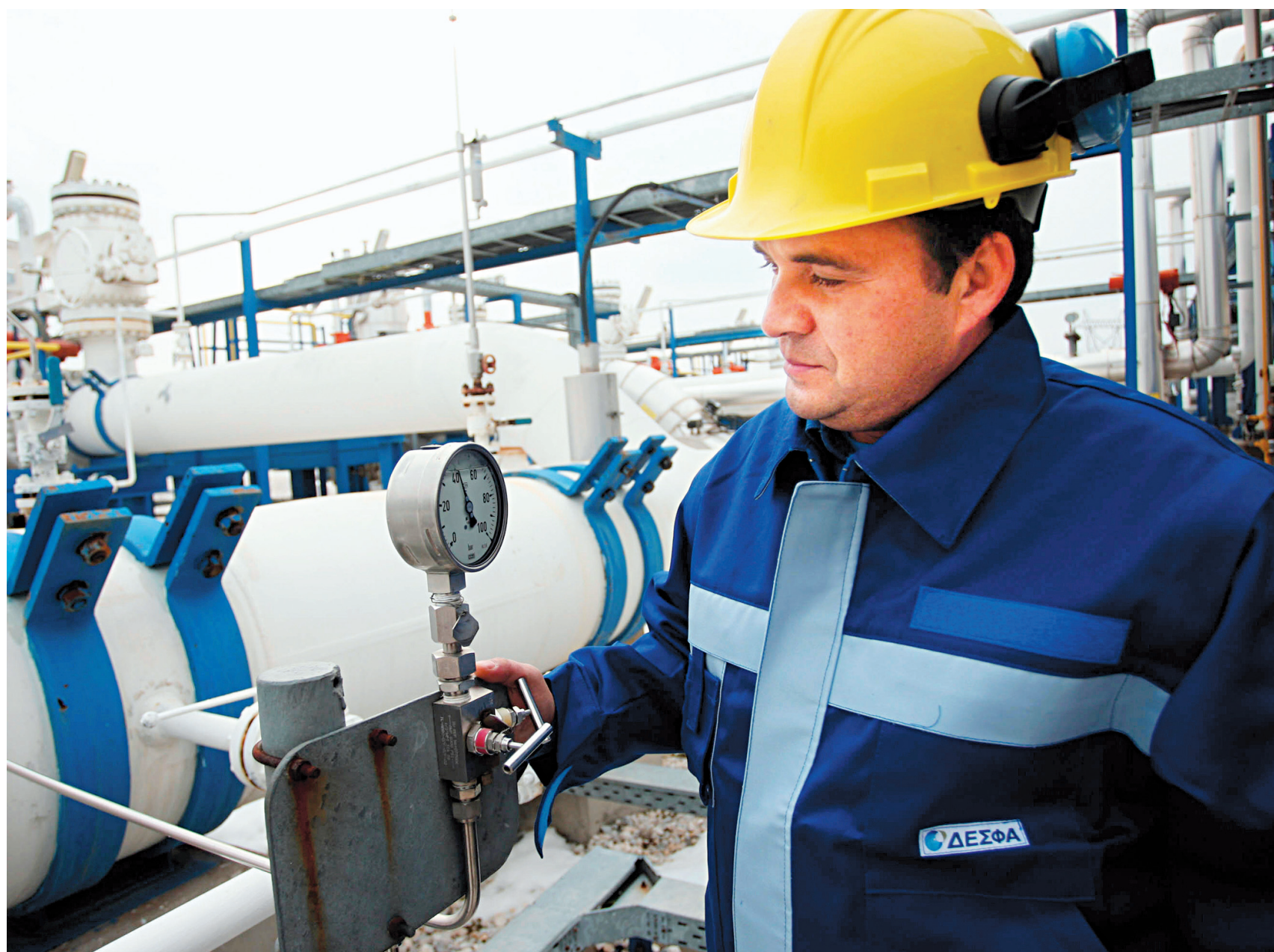
Un ouvrier inspecte un pipeline qui alimente la Grèce en gaz.

Quand même pas mal pour des entreprises qui disent ne pas avoir encore trouvé leur nouvelle vache à lait !