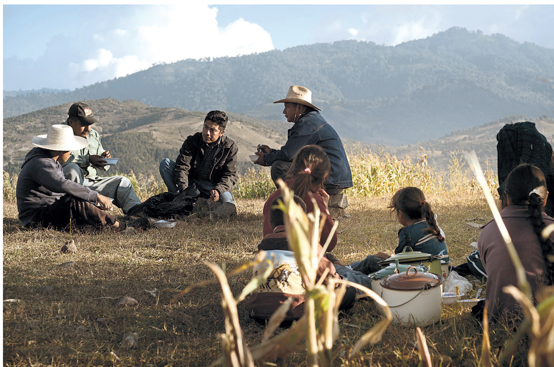
FESTIVAL DU NOUVEAU CINÉMA

La pièce a une espèce de valeur exemplaire par son dépouillement implacable.