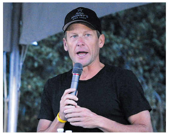
Armstrong avant la course caritative organisée par Livestrong dimanche.