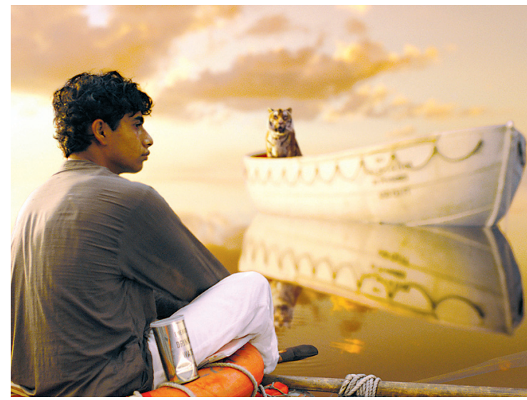
FESTIVAL DU NOUVEAU CINÉMA

L'histoire du fils d'un directeur de zoo qu'un naufrage envoie valser dans une embarcation en compagnie d'animaux sauvages avait longtemps été jugée inadaptée.