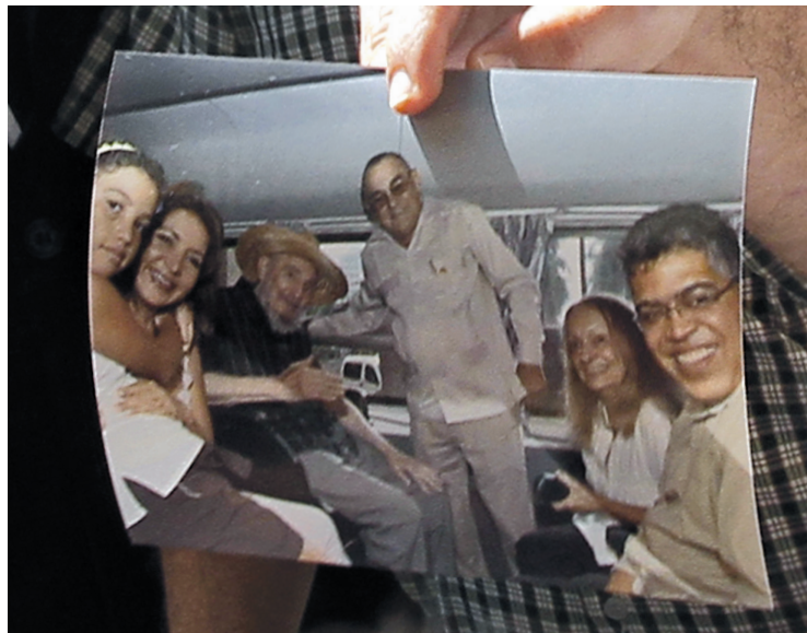
L'ancien vice-président vénézuélien Elias Jaua montre une photo de Fidel Castro, le troisième à gauche, dans un hôtel de La Havane à Cuba ce dimanche.

assemblées provinciales et nationale n'ont pas encore été fixées, mais le nouveau Parlement se réunit traditionnellement le 24 février, date anniversaire du début de la guerre d'indépendance, en 1895.