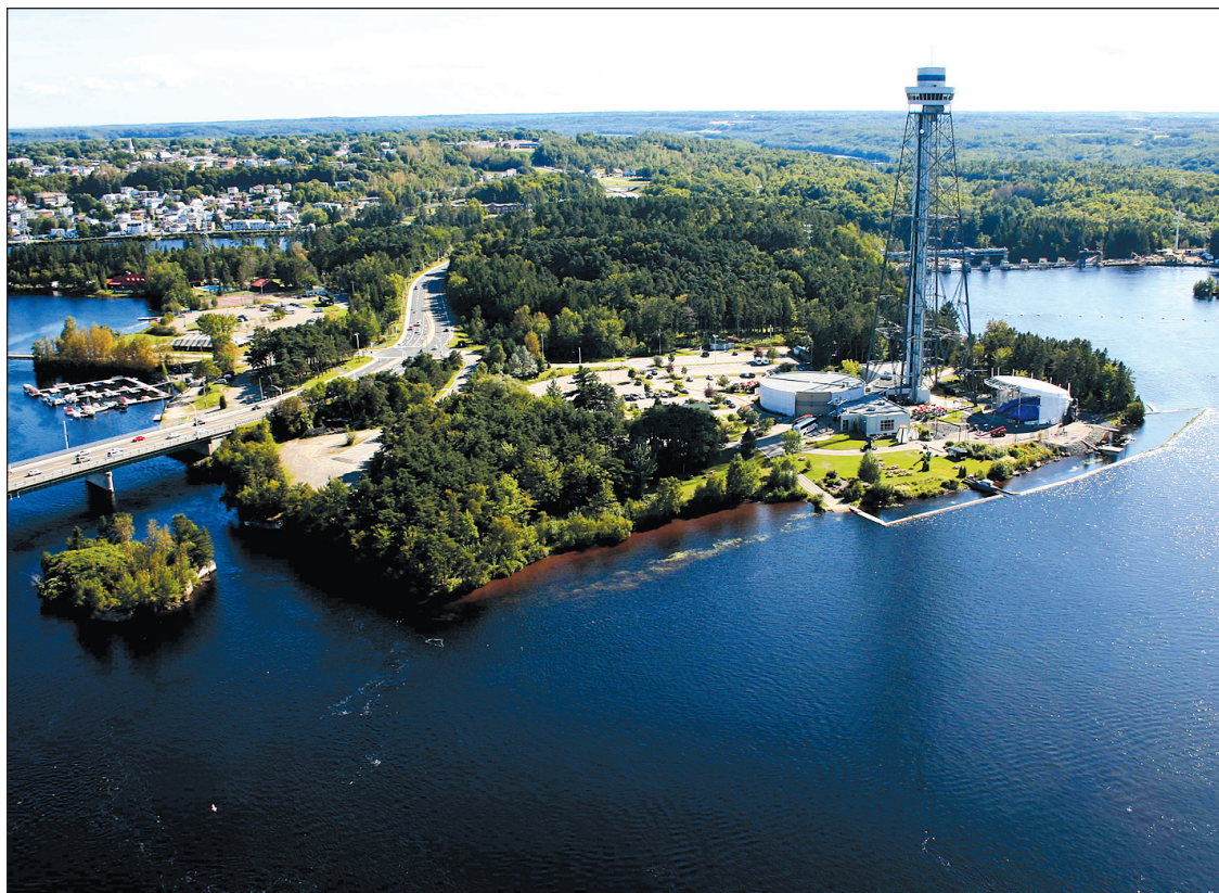
La Ville de Shawinigan est en train de marquer le présent avec un taux de pénétration de ses activités socionumériques de 4,2%, soit l'un des plus élevés du Québec. La ville de l'électricité parvient à joindre près d'un quart de ses 50000 habitants par l'entremise de ses comptes Twitter et Facebook.

Selon lui, l'engouement des internautes pour les réseaux sociaux — 60% du Québec branché se trouve sur Facebook, 57% sur YouTube et 23% sur Google+, indiquent les dernières données du Centre francophone d'informatisation des organisations — a donné le ton à l'émergence, mais devrait aussi assurer la