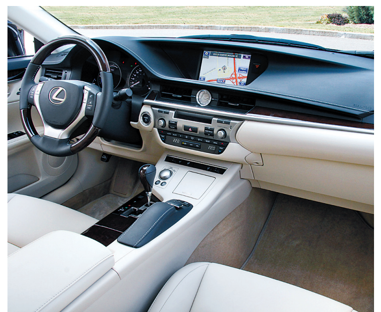
L'intérieur de cette berline de luxe se veut spacieux, devant comme derrière. Plusieurs niveaux de dotation figurent au catalogue pour en faire un petit salon privé sur quatre roues.

On oublie facilement, c'est vrai, le rôle de conducteur qu'on a lorsqu'on est au volant d'une voiture aux allures de