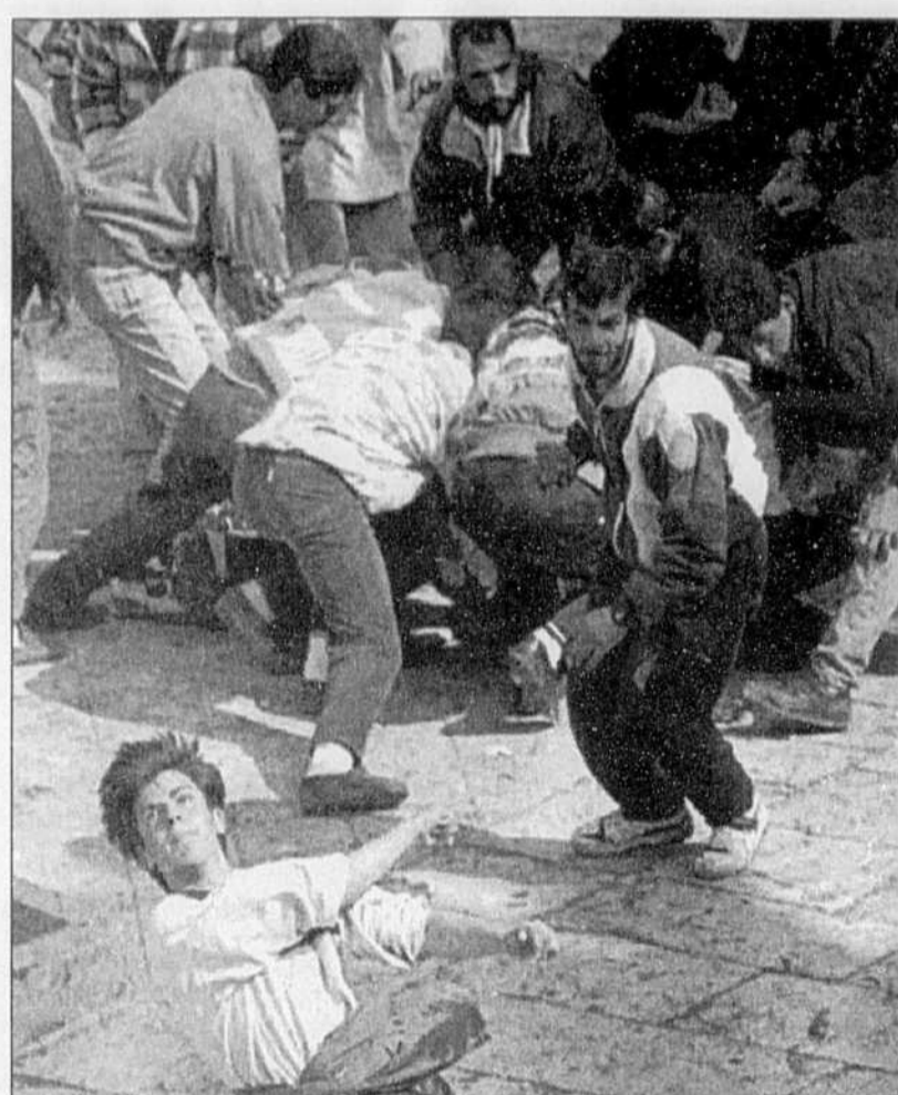
Scène de rue hier à Jérusalem.