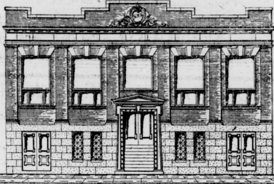
LA FACADE DE LA MORGUE QUE LA COMPAGNIE BOURGIE, LIMITEE, S'ENGAGE A CONSTRUIRE, SI LA VILLE LUI EN ACCORDE LE PERMIS.