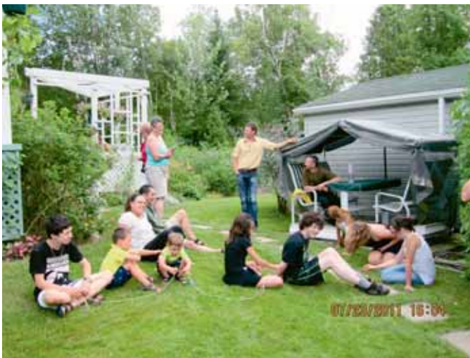
Les enfants s'amusaient ferme à cette fête même si certains d'entre eux ne s'étaient jamais rencontrés.