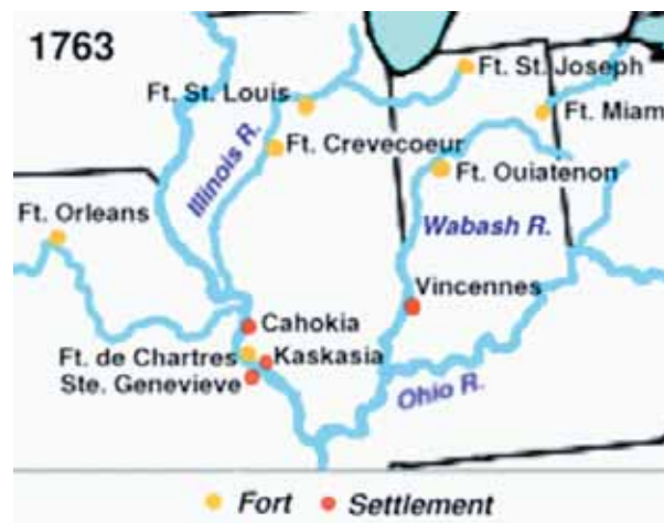
French settlements and forts in the Illinois Country in 1763 / Établissements et forts français aux Pays des Illinois en 1763

In 1696-1700, the trading posts established by LaSalle and the Indian missions south and south west of Lake Michigan became points of attraction for emigrants and adventurers from New France. The descriptions of this region by LaSalle and others who had been there featured a warm climate, fertile ground and an abundance of game. Settlers from Québec, Détroit, and Louisiana Territory began to arrive and established villages such as Cahokia, Kaskaskia, Ste Geneviève, St Philippe,