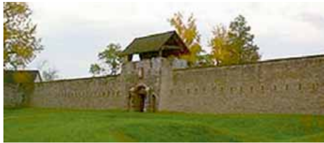
Photograph of Fort De Chartres / Photo du Fort De Chartres Reconstructed, largely in stone, per original French plans as it looked in its 1752 -1760 configuration. There were three successive versions of the fort. It was a wooden structure when the expedition set out for Santa Fe in 1739 (16) / Reconstituit, principalement en pierre, selon les plans originaux français et tel que sa configuration le montrait entre 1752 et 1760. Il y eut trois versions successives du fort. Il était en bois lors de l'expédition de Santa Fe en 1739 (16)