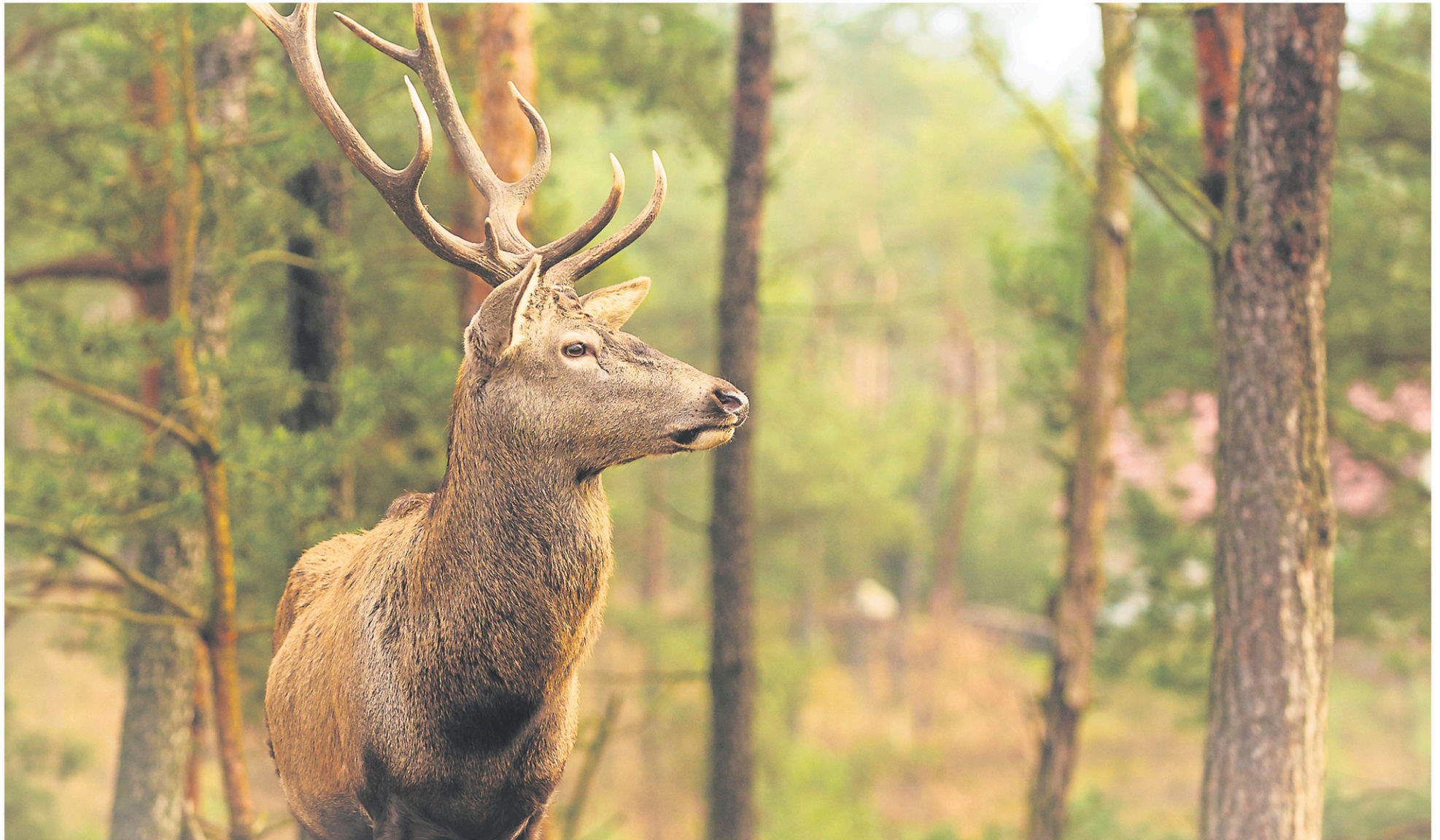
De manière générale, les nutriments sont plus concentrés dans la viande de gibier que dans la viande d'élevage.