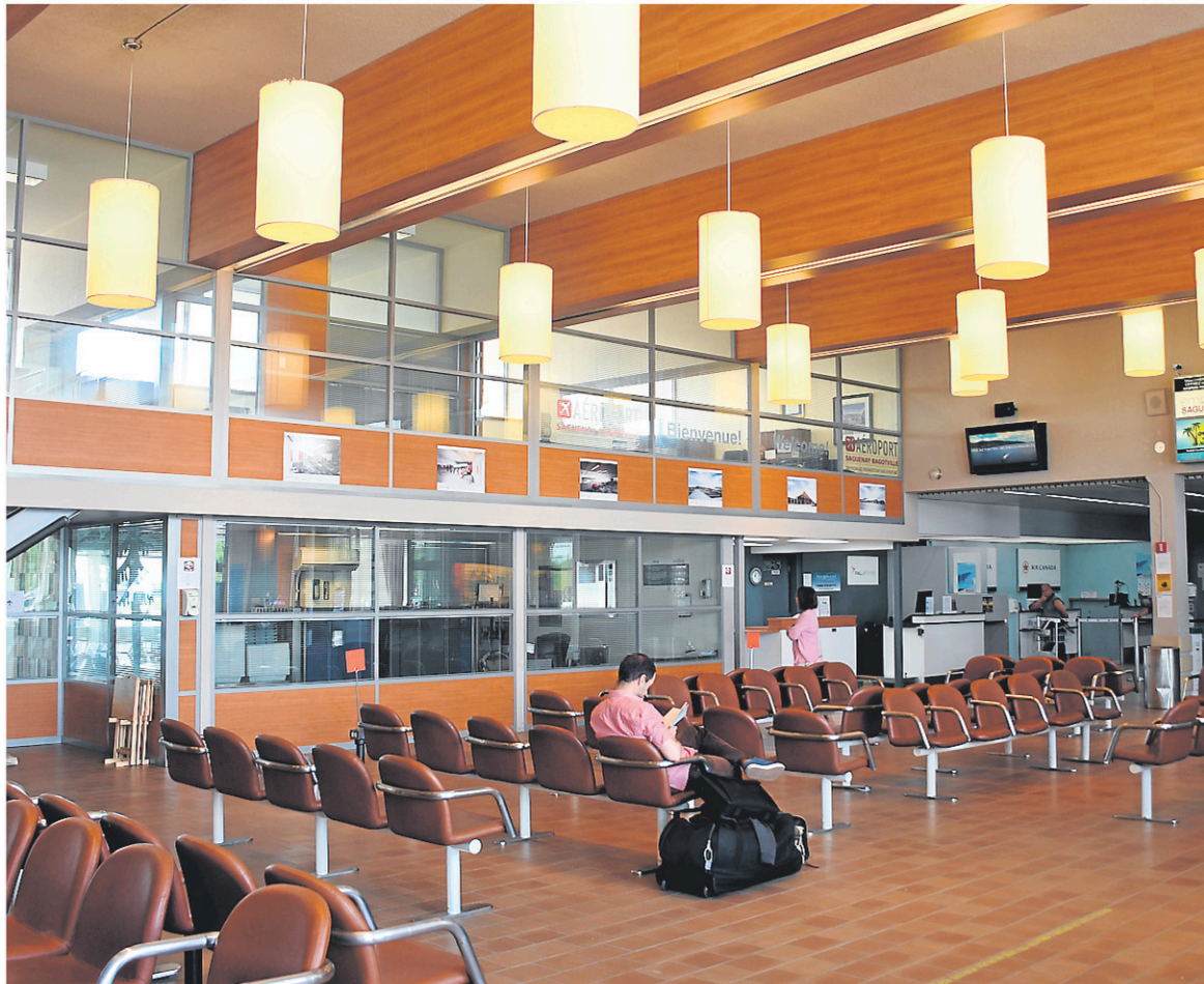
La mesure de 800 000 $ vise à offrir des vols à moindre coût aux touristes américains et européens afin de les inciter à sortir des grands centres urbains pour visiter le Saguenay-Lac-Saint-Jean.

En plus des 800 000 $ annoncés pour amener les touristes européens et américains vers les régions, la ministre Joly devrait aussi accorder 2,5 millions supplémentaires pour les opérations courantes de Tourisme Saguenay-Lac-Saint-Jean et pour un projet de commercialisation visant l'Europe et les États-Unis.