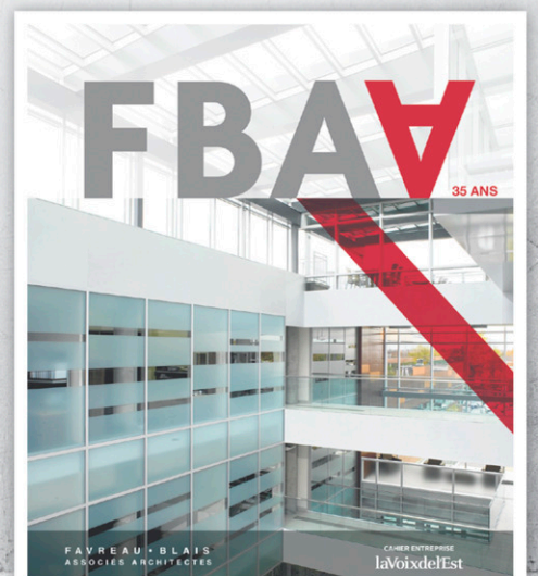
FAVREAU BLAIS ASSOCIÉS ARCHITECTES Pour son 35 e anniversaire