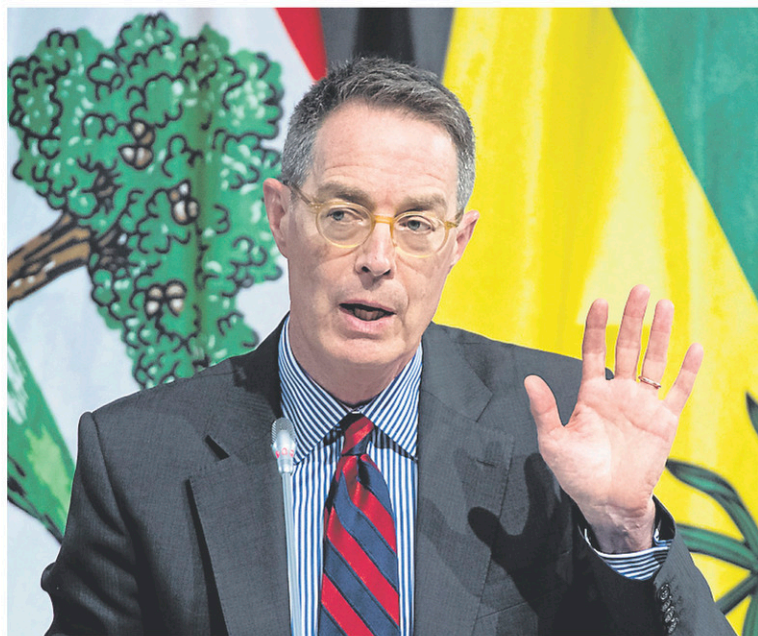
Le juge Nicholas Kasirer occupera un des trois sièges réservés à des juges du Québec à la Cour suprême.

« La cour pourrait avoir d'autres besoins à un moment donné, par exemple celui de nommer une personne autochtone. Nous pourrions devoir diluer cette exigence à un moment donné », a-t-il justifié, ajoutant qu'il préfère ne pas avoir à s'inquiéter de la « constitutionnalité » d'une exigence de bilinguisme