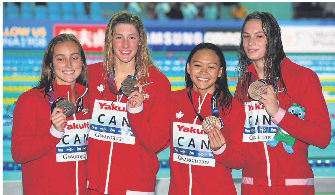
Emily Overholt, Taylor Ruck, Kayla Sanchez et Penny Oleksiak ont complété le 4x200 m libre en sept minutes et 44,35 secondes.