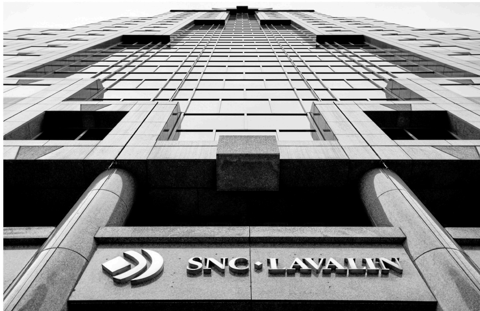
Exportation et développement Canada affirme qu'une enquête indépendante blanchit ses employés à la suite d'une allégation selon laquelle ceux-ci auraient fermé les yeux sur la corruption dans le cadre d'une transaction impliquant SNC-Lavalin en 2011.

En avril dernier, l'entreprise n'avait pas voulu commenter le reportage de CBC, affirmant que l'allégation remontait à avant 2012 — lorsque des scandales