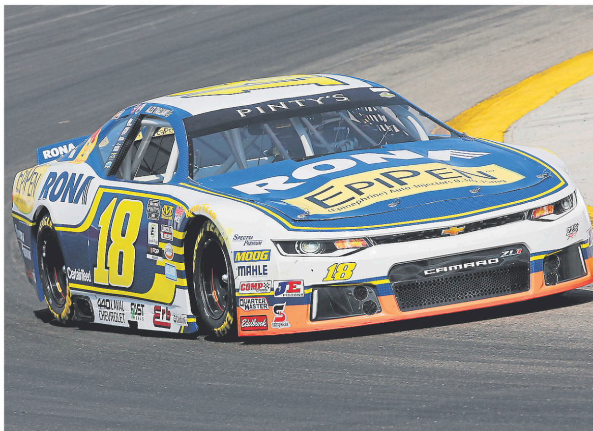
Non, ma voiture n'était pas à point à Saskatoon.