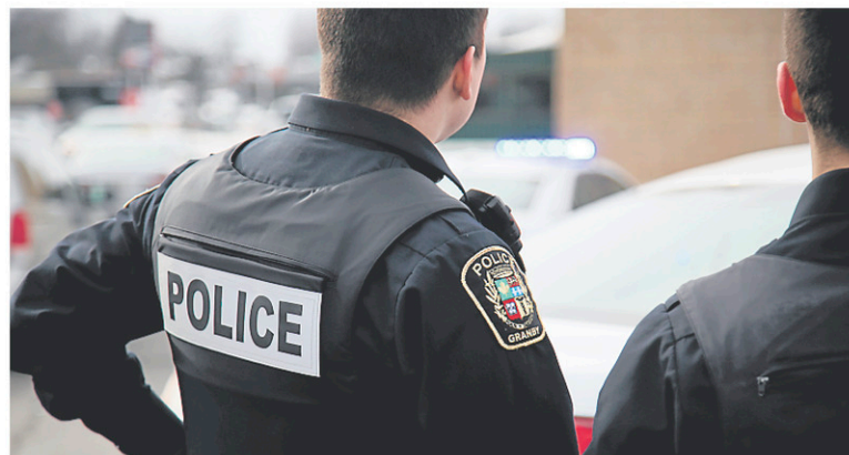
Un conducteur en état d'ébriété qui voulait échapper aux policiers a provoqué une poursuite, mercredi soir, au centre-ville de Granby.

D'ici là, son permis de conduire a été suspendu 90 jours et sa voiture a été remise.