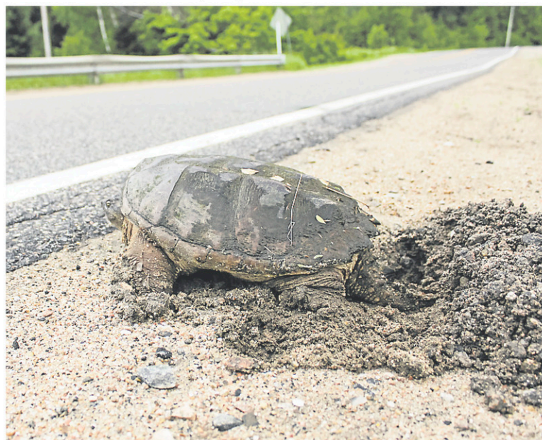
Pour la ponte, les femelles cherchent principalement des sites au sol sablonneux, terreux ou graveleux pour y déposer leurs œufs. Les voies d'accotement des routes non pavées attirent souvent les femelles pour la ponte même si ces milieux sont dangereux pour elles.

Lorsque des zones de traverses de tortues sont observées, il est recommandé d'en faire le signalement sur le site www.carapace.ca . Selon les initiatives citoyennes, il est possible de contacter sa municipalité ou le ministère du Transport du Québec si la traverse se trouve sur une route provinciale afin d'installer un panneau pour aviser les automobilistes de ralentir dans les zones les plus sensibles.