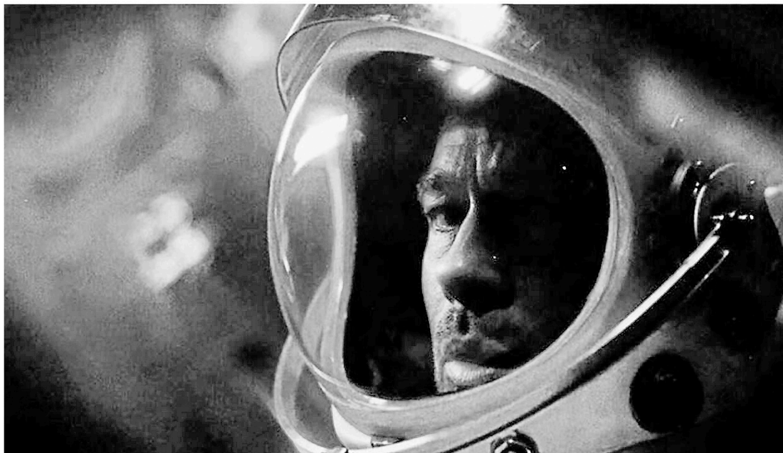
La Mostra de Venise accueille également des productions hollywoodiennes telles que Joker , avec Joaquin Phoenix, ainsi qu' Ad Astra , un film de science-fiction mettant en vedette Brad Pitt (photo).