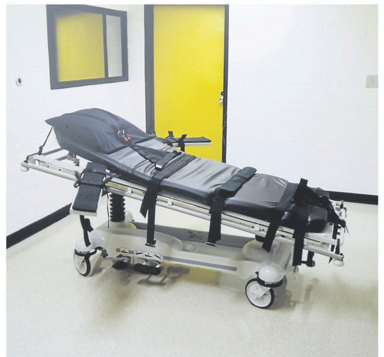
Une chambre de la mort d'une prison en Géorgie. Même s'ils peuvent, plusieurs États n'appliquent pas la peine de mort en raison de difficultés d'approvisionnement en substances létales, car plusieurs pharmaceutiques refusent maintenant de s'y associer.

Si la plupart des meurtres sont jugés au niveau des États, les tribunaux fédéraux peuvent être saisis des cas les plus graves (attentats, crimes racistes, meurtre d'un témoin, etc.)