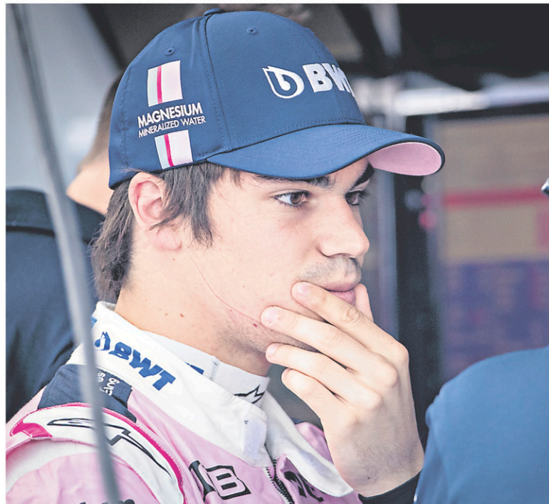
Lance Stroll pointe présentement au 16 e échelon du classement des pilotes avec une maigre récolte de six points.

«Vous savez, c'est une lutte perpétuelle entre l'ajout de nouvelles pièces sur la voiture afin de gagner de l'adhérence dans les virages et l'augmentation de la traînée aérodynamique en ligne droite», a expliqué le Québécois.