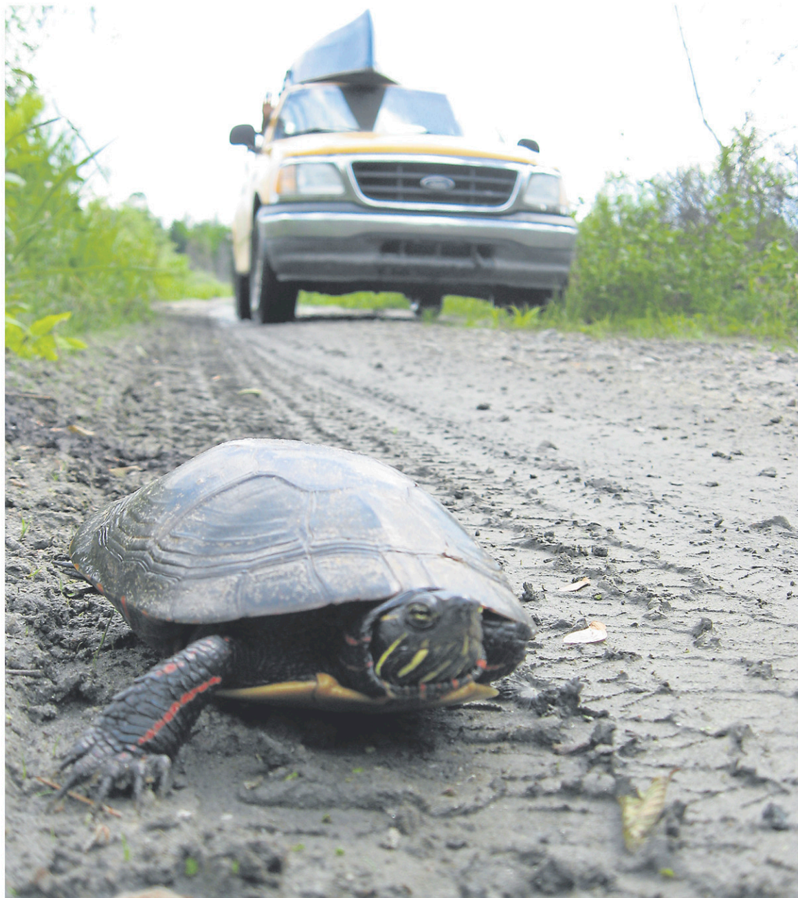
Une tortue a été photographiée sur une route non loin d'un milieu aquatique.

En Estrie, trois endroits ont été répertoriés comme des « points chauds » pour le passage de tortues sur les routes, soit la rue du Rocher dans la MRC de Brome-Missisquoi, le