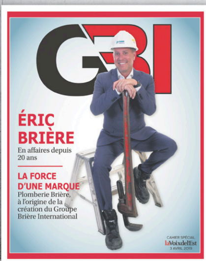
GROUPE BRIÈRE INTERNATIONAL Pour illustrer son expertise