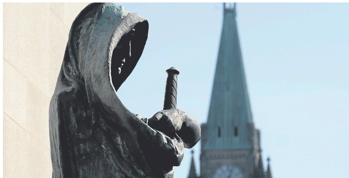
La Cour suprême du Canada a fait savoir jeudi matin qu'elle entendrait la cause, sans donner d'explications, comme c'est toujours le cas.

La prochaine étape revient toutefois à la Cour suprême. La date à laquelle les parties plaideront leurs arguments n'est pas encore déterminée.