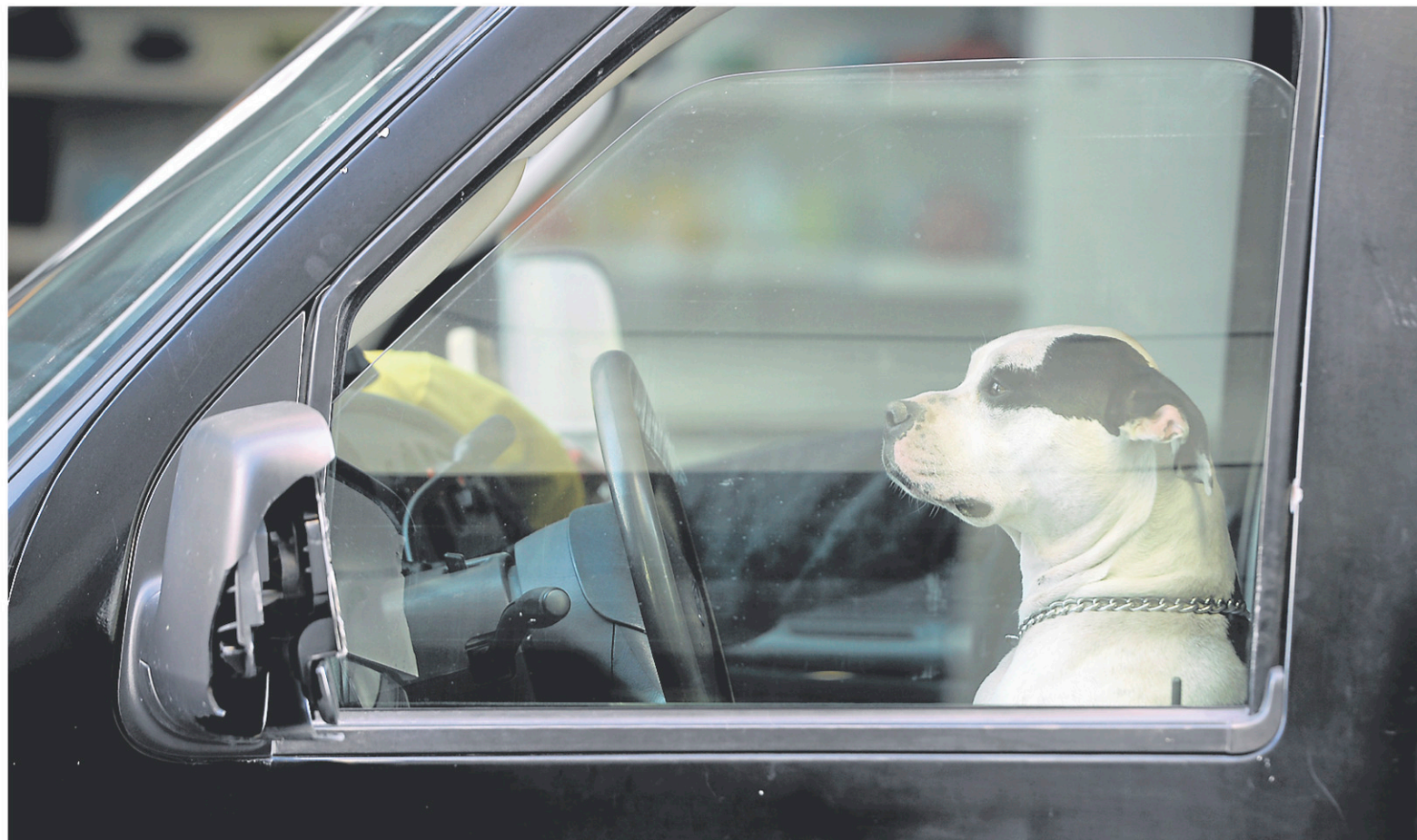
La SPA de l'Estrie affirme avoir reçu près d'une trentaine de signalements pour des chiens laissés dans des voitures l'été depuis le début du mois de mai.

« Avec les chaleurs annoncées pour la fin de semaine et les journées chaudes de la semaine dernière, la SPA de l'Estrie désire rappeler aux gardiens de chiens