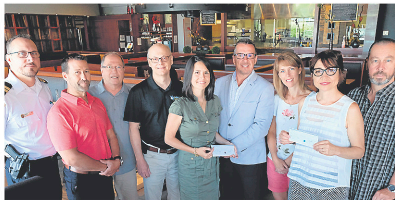
Des organismes de Granby se partagent plus de 135 000 $ grâce à deux événements organisés par les policiers de Granby en juin et en juillet.

Les deux événements, organisés par le Service de police de Granby, ont été couronnés de succès. D'abord, le 19 e Tournoi de soccer amical des policiers, qui a réuni 28 équipes du Québec et une de l'Ontario les