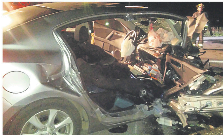
Une femme et deux hommes ont subi de graves blessures lors d'une violente collision frontale survenue sur la route 112 à Rougemont, mercredi soir.

La route a finalement été rouverte vers 4 h 15 jeudi matin.