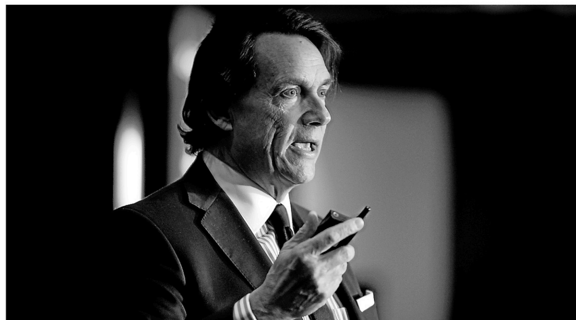
Le président et chef de la direction de Québecor, Pierre Karl Péladeau demande à Québec d'intervenir pour empêcher cette transaction.