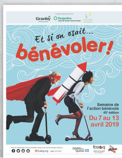
CENTRE D'ACTION BÉNÉVOLE Pour la semaine de l'action bénévole