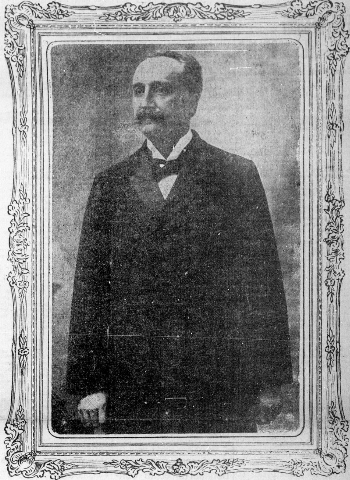
Le magnifique portrait à l'huile que les conservateurs de St-Jean-Baptiste présenteront au chef de l'opposition, jeudi soir et qui a pour auteur M. Nuckle, peintre canadien de cette ville.

Nous croyons intéresser nos lecteurs en publiant, à l'occasion du banquet Monk, quelques pensées détachées de discours prononcés par l'éminent chef conservateur de notre province :