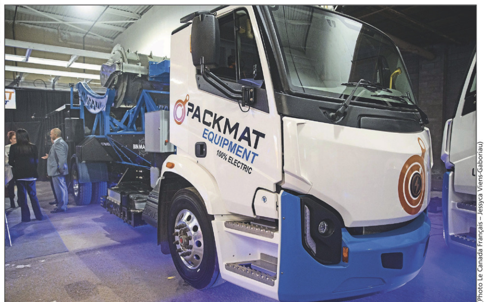
Packmat Equipment a développé le premier compacteur mobile 100 % électrique au monde.