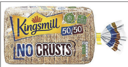
Emballage St-Jean a développé un sac à pain fait de plastique recyclé postconsommation. Une boulangerie du Royaume-Uni l'utilise pour vendre ses produits.

La politique municipale s'est également immiscée dans les affaires économiques. Des industriels ont dénoncé un règlement qui freine leur développement, ainsi que