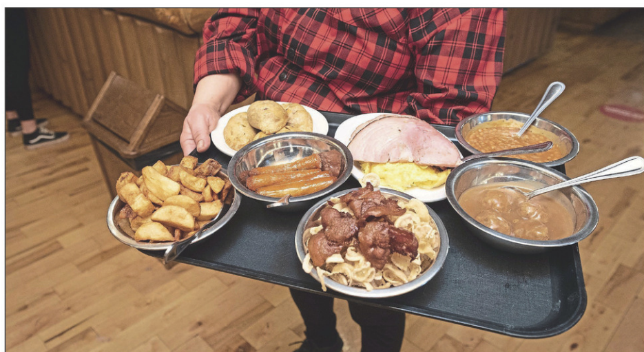
Les cabanes à sucre ont pu rouvrir leurs portes au printemps 2022, après deux années de fermeture forcée en raison de la pandémie.

Olymel a aussi fermé son département d'emballage de porc à Saint-Jean, en plus d'avoir restructuré ses effectifs. La boutique Bébé Fafa a délaissé son local pour se concentrer entièrement à