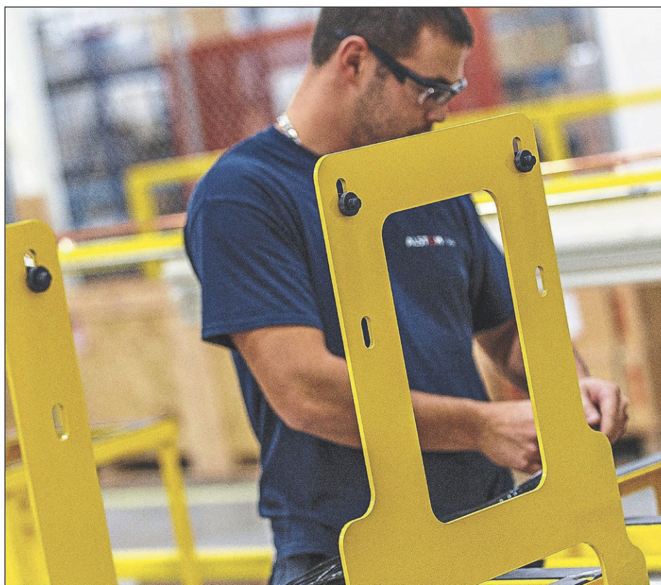
Dans le secteur manufacturier, 38 % des emplois à combler offrent un salaire supérieur à 30 $ l'heure.

Des effets sur la santé psychologique des travailleurs sont aussi notés. Plus de la moitié des entreprises sondées