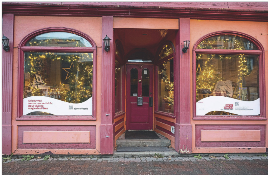
Cet autre décor réalisé par l'entreprise Carte Blanche peut être vu au 140, rue Richelieu.