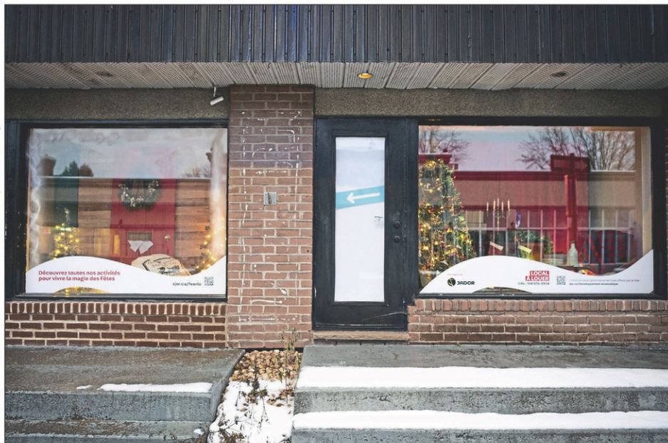
Productions Jador a élaboré ce décor sous la thématique des Noëls d'antan.