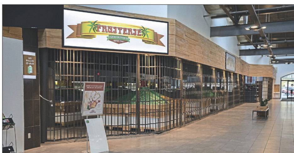
Contrainte à la faillite, la fruiterie des Halles a subitement fermé ses portes en octobre.