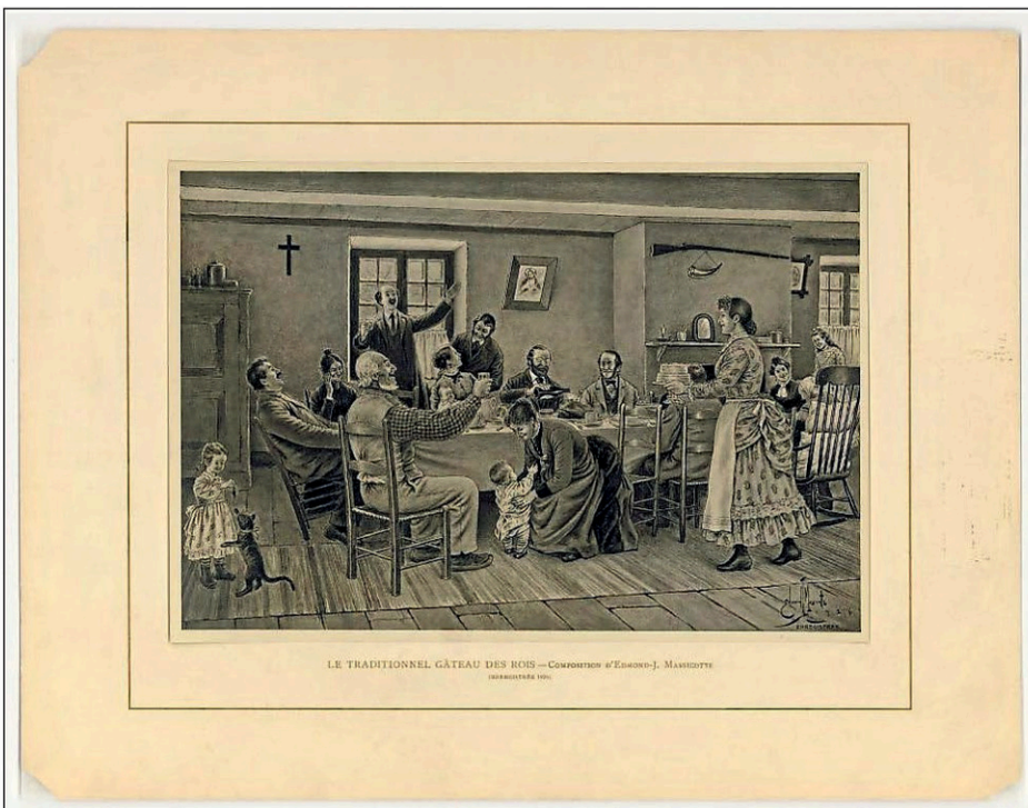
Il y a 100 ans cette année, on rééditait, sous forme de recueil publié chez Granger Frères, douze des tableaux documentaires de Massicotte sous l'intitulé Nos Canadiens d'autrefois . Cette série sera complétée par cinq planches, dont celle du Traditionnel gâteau des Rois enregistrée en 1926.

Dans certaines paroisses, l'Épiphanie marquait également un moment particulier où l'on procédait à la bénédiction des jeunes enfants. D'ailleurs, au début du XX e siècle, les bambins de la paroisse Saint-Grégoire-le-Grand étaient conviés à une telle cérémonie réalisée spécialement