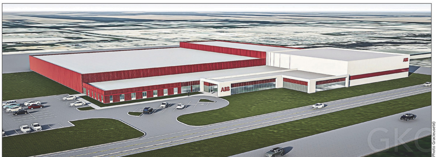
ABB investira 18 M$ à son usine du parc industriel d'Iberville.