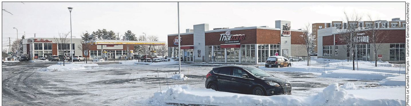
En août, le Faubourg Saint-Jean a été vendu à une entreprise ontarienne au prix de 61 M$.

ABB a annoncé son intention d'investir 18 M$ à son usine d'Iberville. Transdev a investi 5 M$ pour électrifier ses bus, et Transport Bourassa a acquis deux poids lourds électriques.