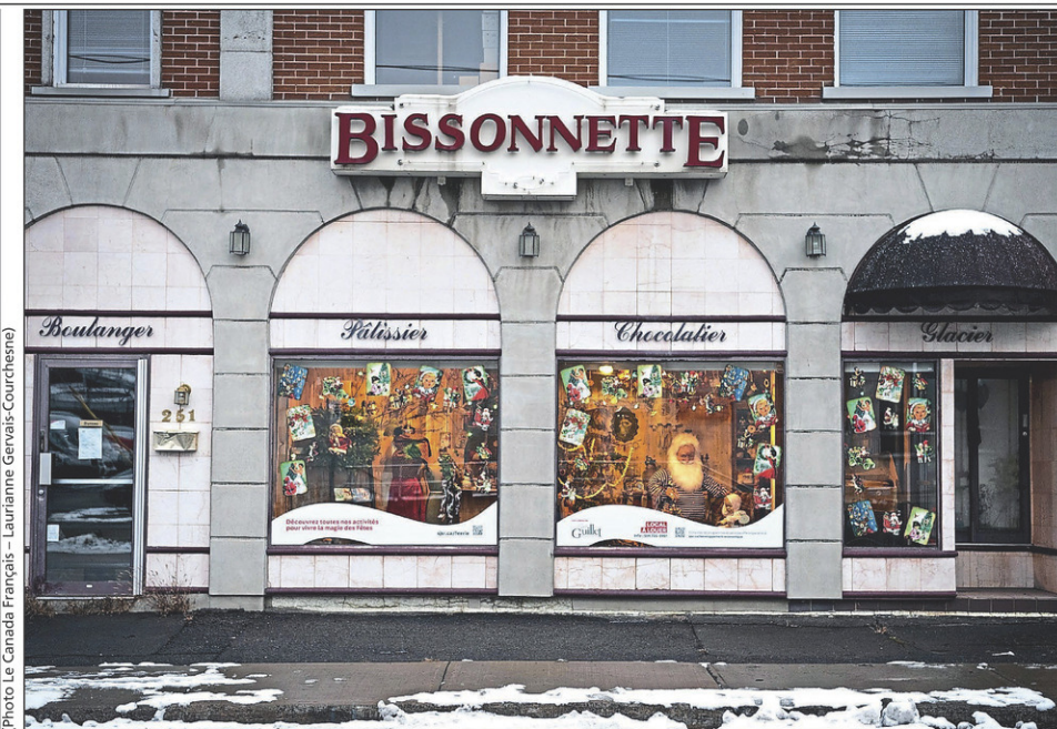
La Société de développement Vieux-Saint-Jean propose une deuxième édition de vitrines de Noël. Ces décors féeriques embellissent des locaux à louer. Celui sur cette photo se trouve au 251, rue Champlain. Il a été créé par l'équipe de Signé Guillet.