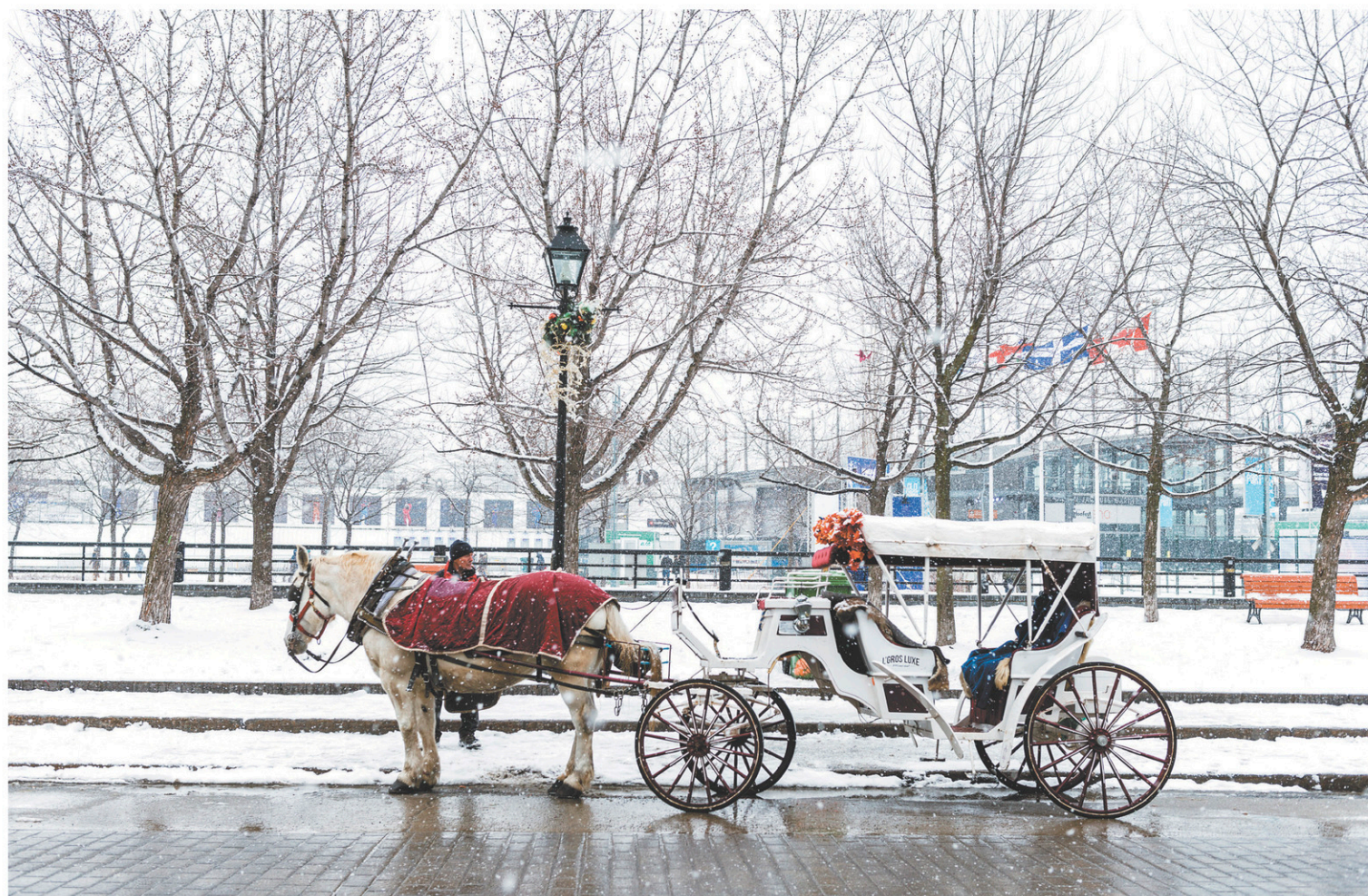
Les nombreuses lacunes que l'on reproche à l'industrie des calèches peuvent être corrigées par l'adoption de règlements appropriés et de mesures de contrôle resserrées.

Des investissements sont nécessaires pour l'aménage-