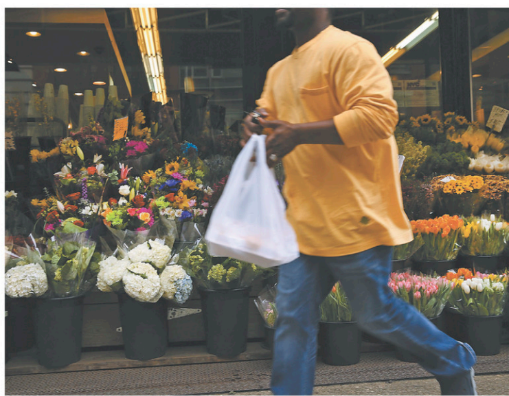
Les plastiques actuels sont fabriqués avec du pétrole alors que les plastiques compostables sont fabriqués à partir de végétaux.

fabriqués avec du pétrole alors que les plastiques compostables sont fabriqués à partir de végétaux (végéplastiques). Ils offrent presque toutes les propriétés des plastiques actuels : on peut en fa-