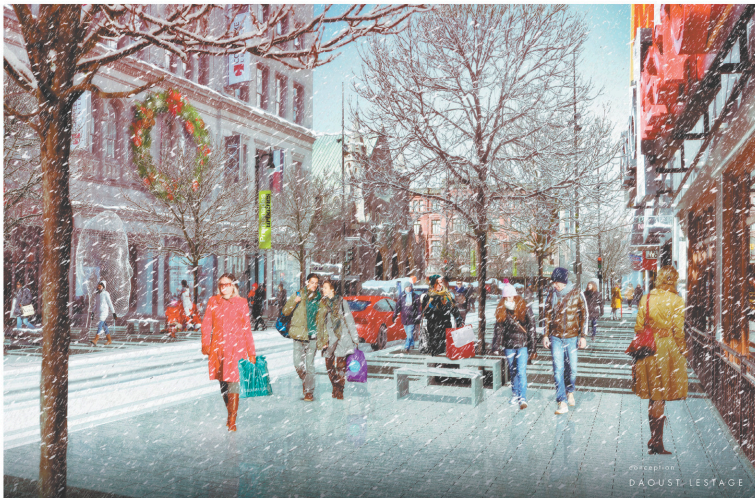
Le projet de réaménagement de la rue Sainte-Catherine Ouest présenté par l'administration de Denis Coderre en mai 2015 prévoyait la construction de trottoirs chauffants.

L'administration Plante s'apprête toutefois à larguer les trottoirs chauffants, dont les coûts sont estimés à 26 millions. La mairesse évoque les difficultés rencontrées avec les dalles chauffantes installées à la place Vauquelin dans le cadre des travaux de 14,7 millions pour la re-