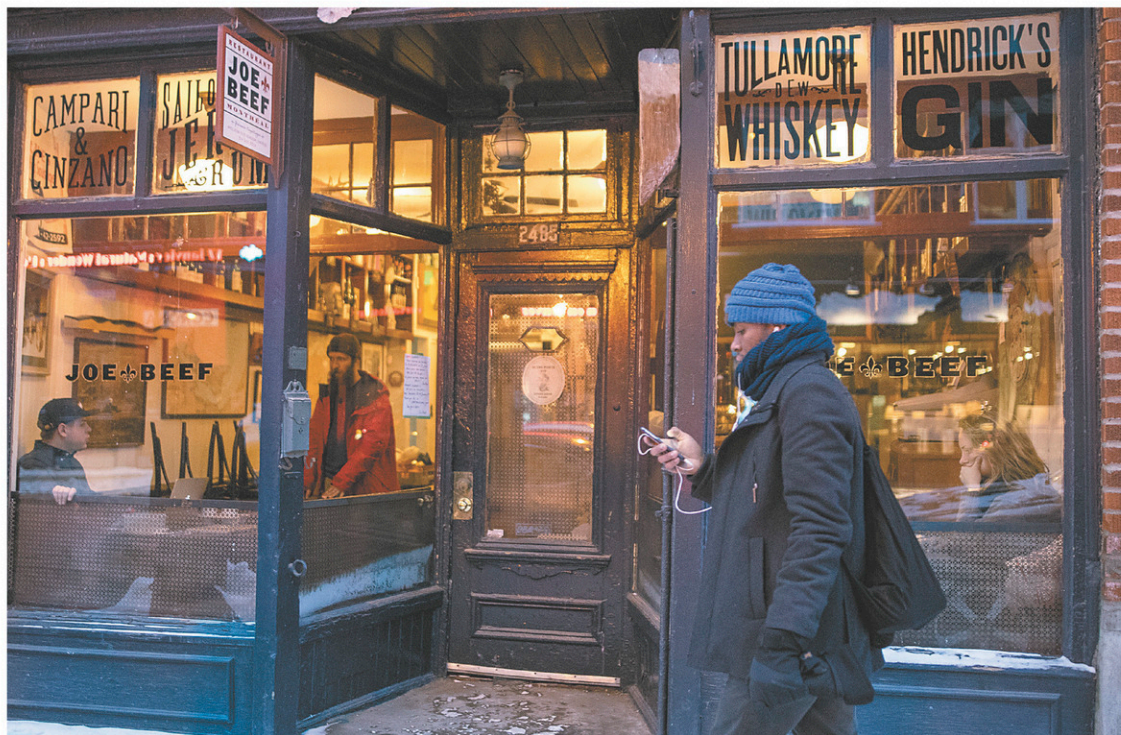
Le réputé restaurant Joe Beef a perdu sa cave à vin de collection dans la nuit de dimanche à lundi en raison d'une fuite d'eau causée par le dégel d'un tuyau.

«Nous sommes 70 employés dans 3 restaurants. On ne peut pas se permettre de fermer, alors on a tout fait pour que les travaux soient