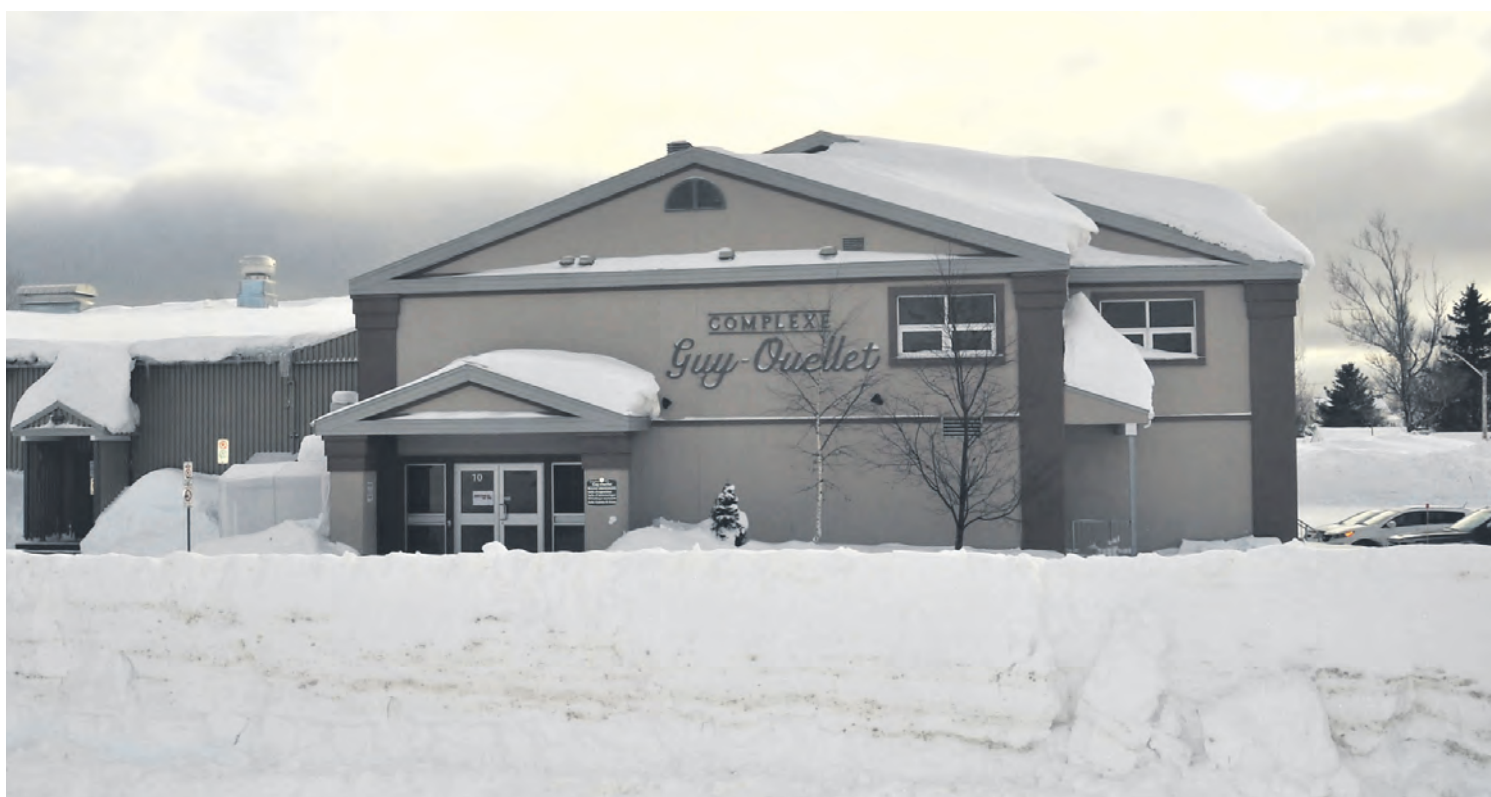
Le Complexe Guy-Ouellet de Forestville ferme ses portes et annule toutes ses activités jusqu'à nouvel ordre, en raison des mesures de prévention demandées par l'Union des municipalités du Québec.

presse, vendredi le 13 mars, les bureaux municipaux étaient tous fermés en raison de la tempête. Il nous a donc été impossible de connaître les intentions des autres localités du territoire à ce sujet.