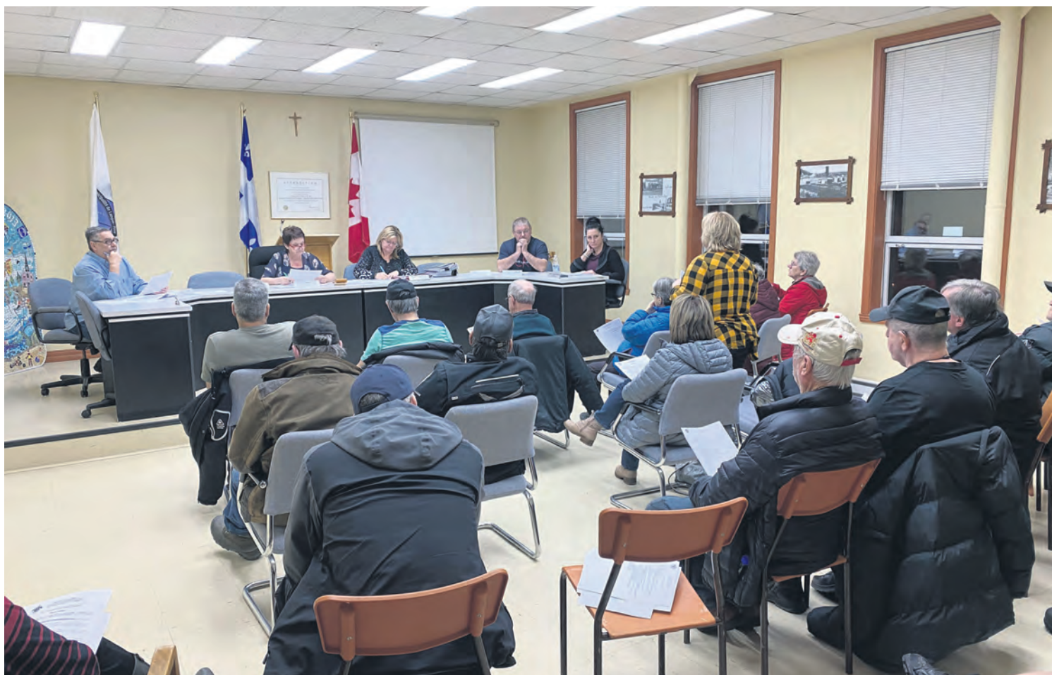
La municipalité de Longue-Rive a revu à la baisse le salaire de ses conseillers municipaux en présentant un nouveau projet de règlement le 12 mars.

« Comme nous n'avons pas reçu d'augmentation depuis 2010, l'année où les conseillers municipaux ont décidé de diminuer leur salaire pour aider à rembourser une dette de plus d'un million de dollars, le calcul s'est fait en chiffrant les remboursements que nous aurions dû avoir pour combler cette baisse. Ne les ayant jamais reçus, nous avons décidé de les reprendre puisque la muni-