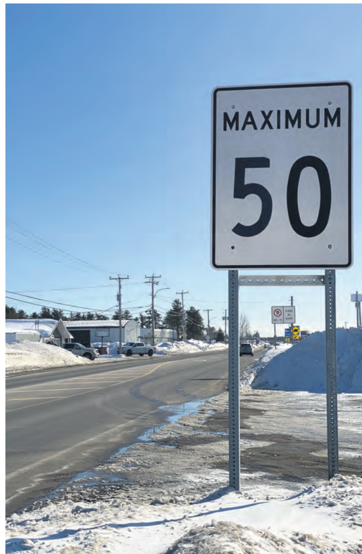
Les élus de Forestville demandent au ministère des Transports une évaluation du débit de circulation et de la vitesse des véhicules aux entrées ouest et est de la Ville.

(JG) – Les conseils municipaux de Colombier, de Longue-rive et Forestville décrètent le mois d'avril le mois de la Jonquille, en appui à la Société canadienne du cancer, qui est le seul organisme qui vient en aide à tous les Québécois atteints de tous les types de cancer et leurs proches, à travers la recherche, la prévention, l'accès à un réseau d'aide, l'information basée sur les dernières données probantes et la défense de l'intérêt public. Les élus encouragent donc la population à accorder généreusement son appui à la cause de la Société canadienne du cancer.